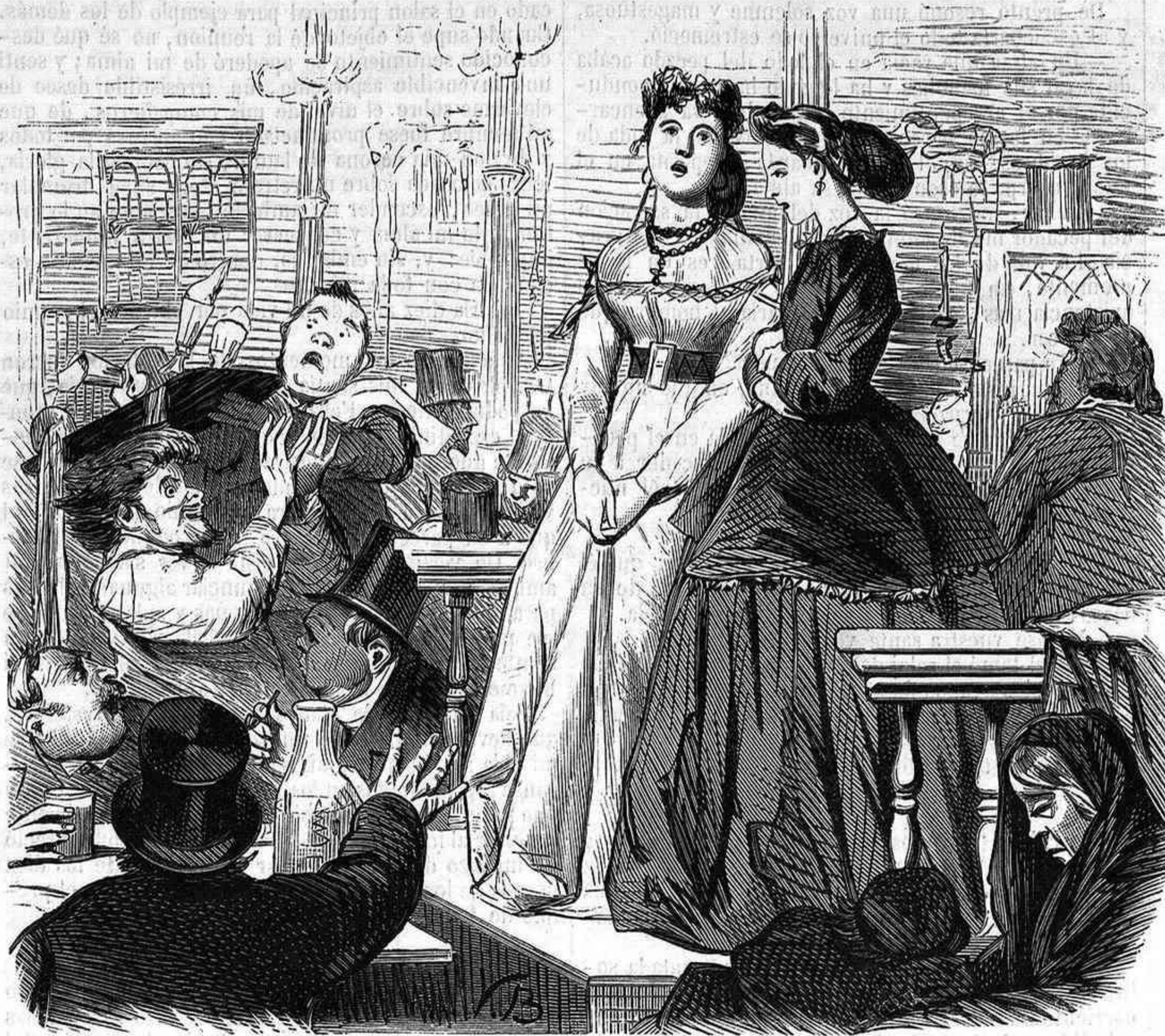
LOS CAFÉS CANTANTES.

—¡Chico y chica! —¡Un chocolate! —¡Ay! ¡mamaaá! —¡Mozo! ¡café!