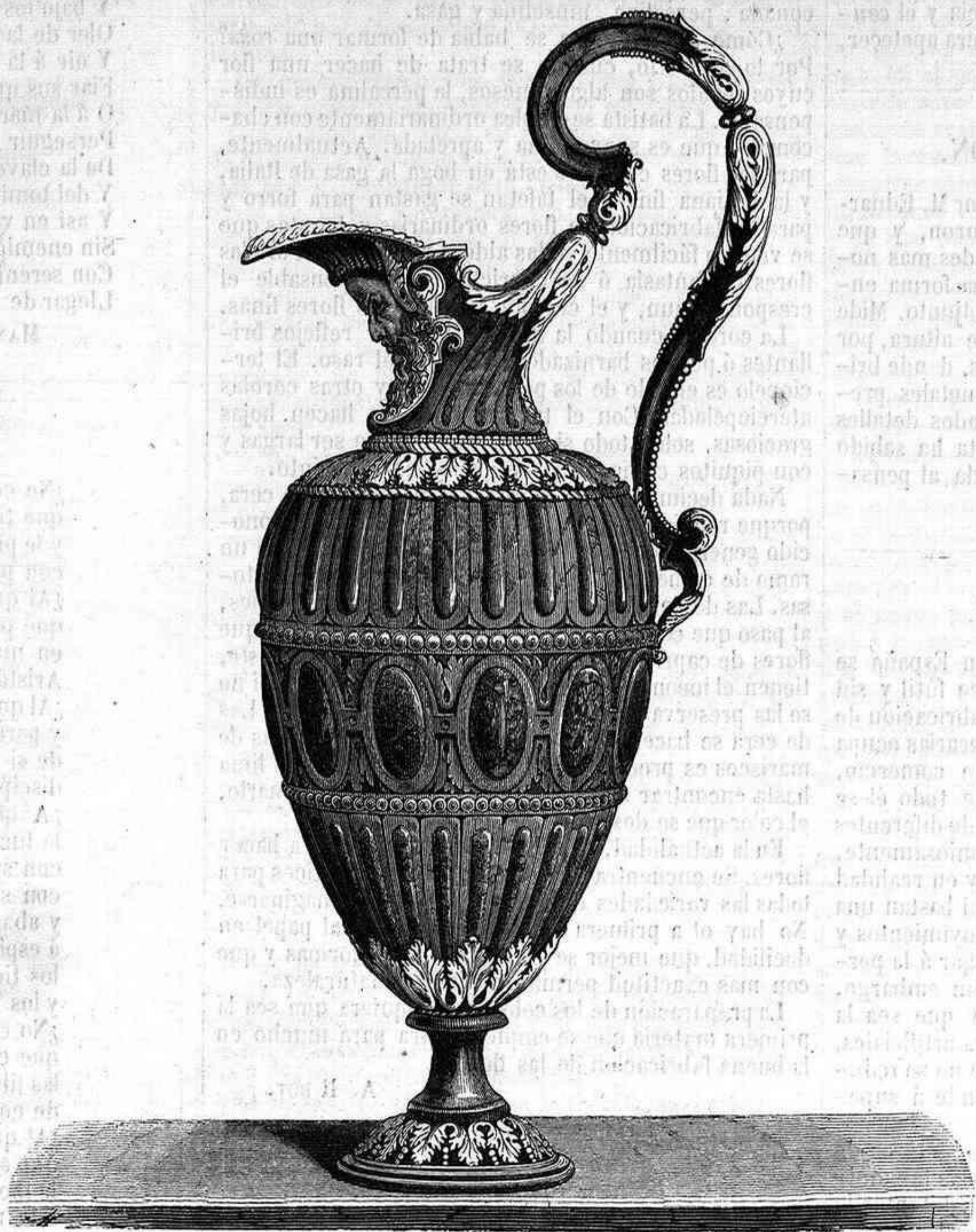
ESPOSICION DE PARIS.—AGHAMANIL DE MR. DURON.

Damos en este número un grabado que representa el café-restaurant de M. Gousset. Hállase este establecimiento en el jardín reservado, es decir, en uno de los puntos del Campo de Marte mas á propósito para abarcar de una sola mirada todas las maravillas de la Exposicion. Desde él han podido tambien los que la han visitado, reparar sus fuerzas, con el descanso y las comidas que á precios arreglados á todas las fortunas allí se preparaban, y oír al mismo tiempo la música con que de cuatro á seis de la tarde amenizaba las horas uno de los regimientos de la guarnicion de París, establecido en el lindo kiosko levantado para la