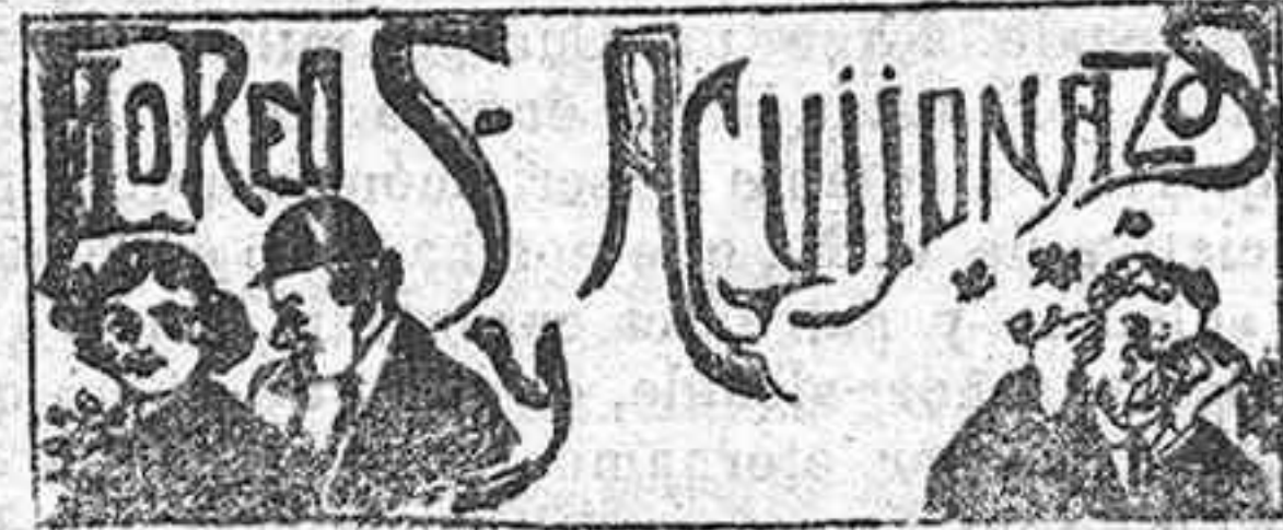
La familia de Noé