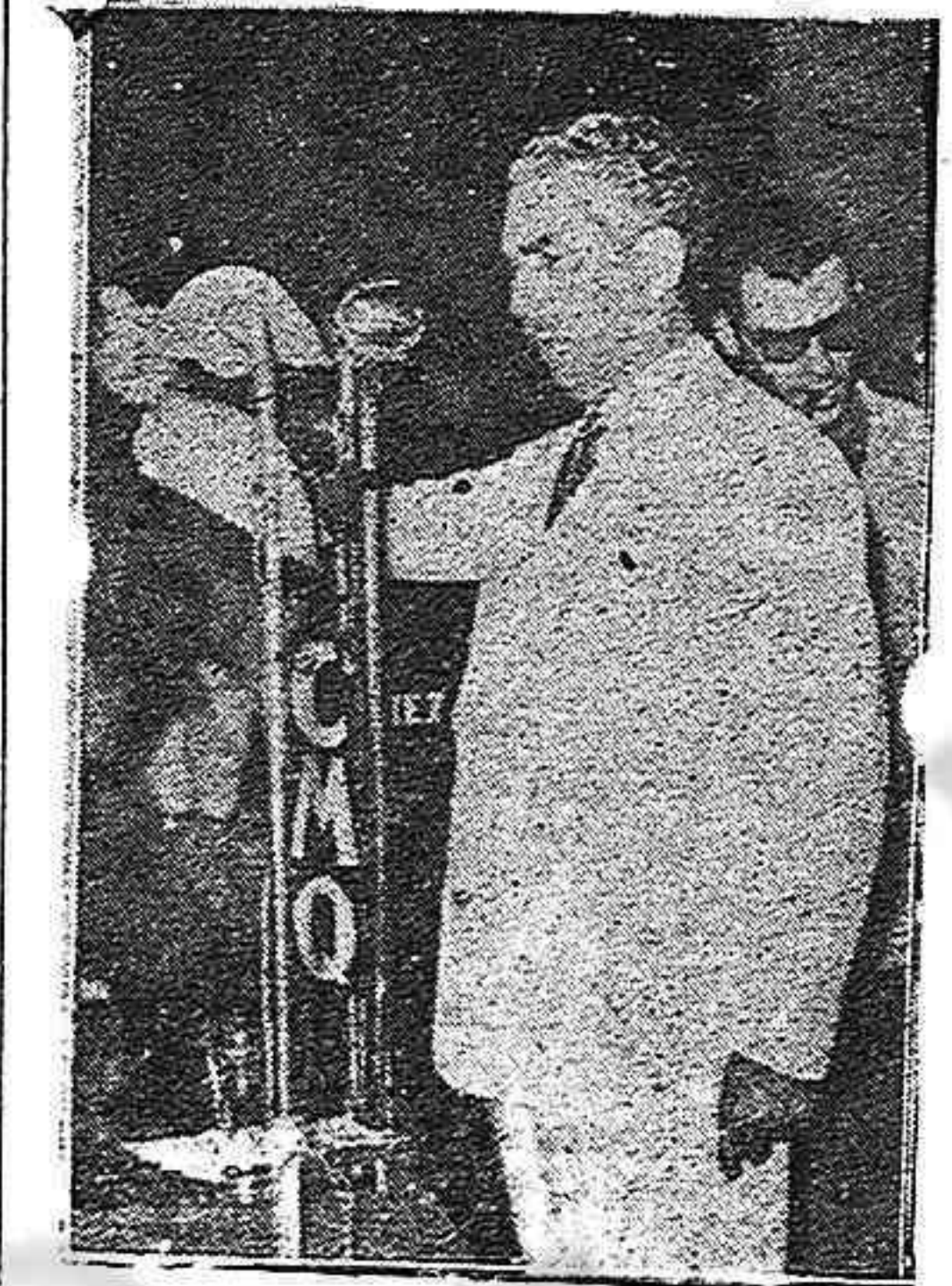
Senador de la República y Presidente del Partido Socialista Popular...