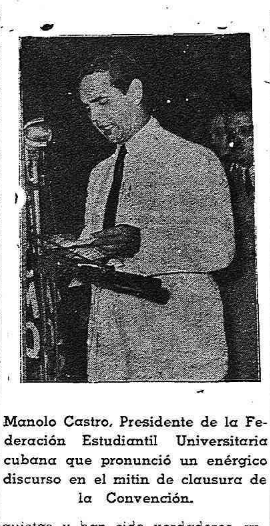
Manolo Castro, Presidente de la Federación Estudiantil Universitaria cubana que pronunció un energético discurso en el mitin de clausura de la Convención.