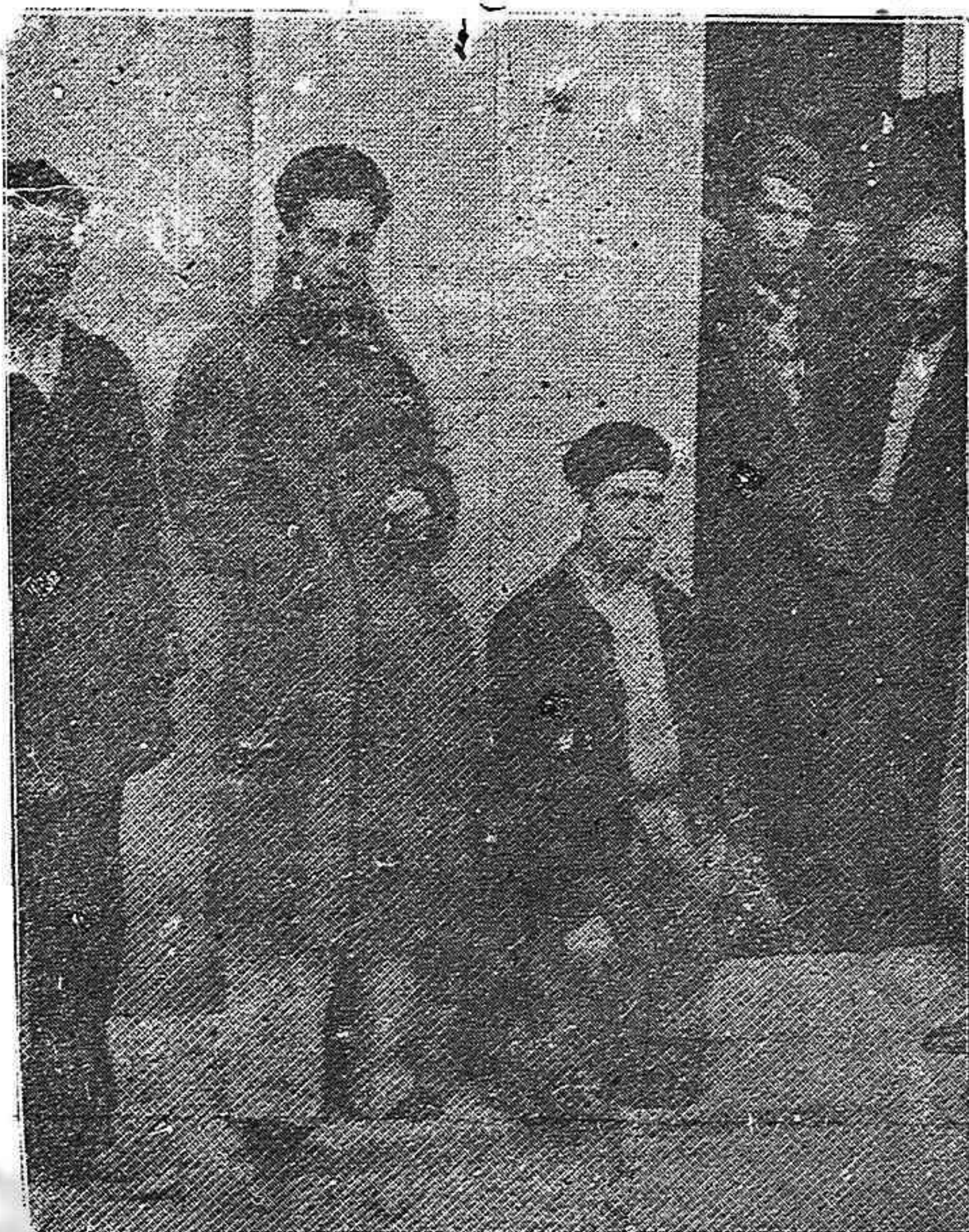
Como esta foto recién recibida de Francia revela, varios millares de héroicos patriotas, solidos en penoso estado físico de su larga lucha contra el hitlerismo, carecen por completo de miembros artificiales, muletas, lentes, dentaduras, etc. [Nuestra ayuda, desde América, debe ser cuantiosa y rápida si queremos salvar preciosas e innumerables vidas]