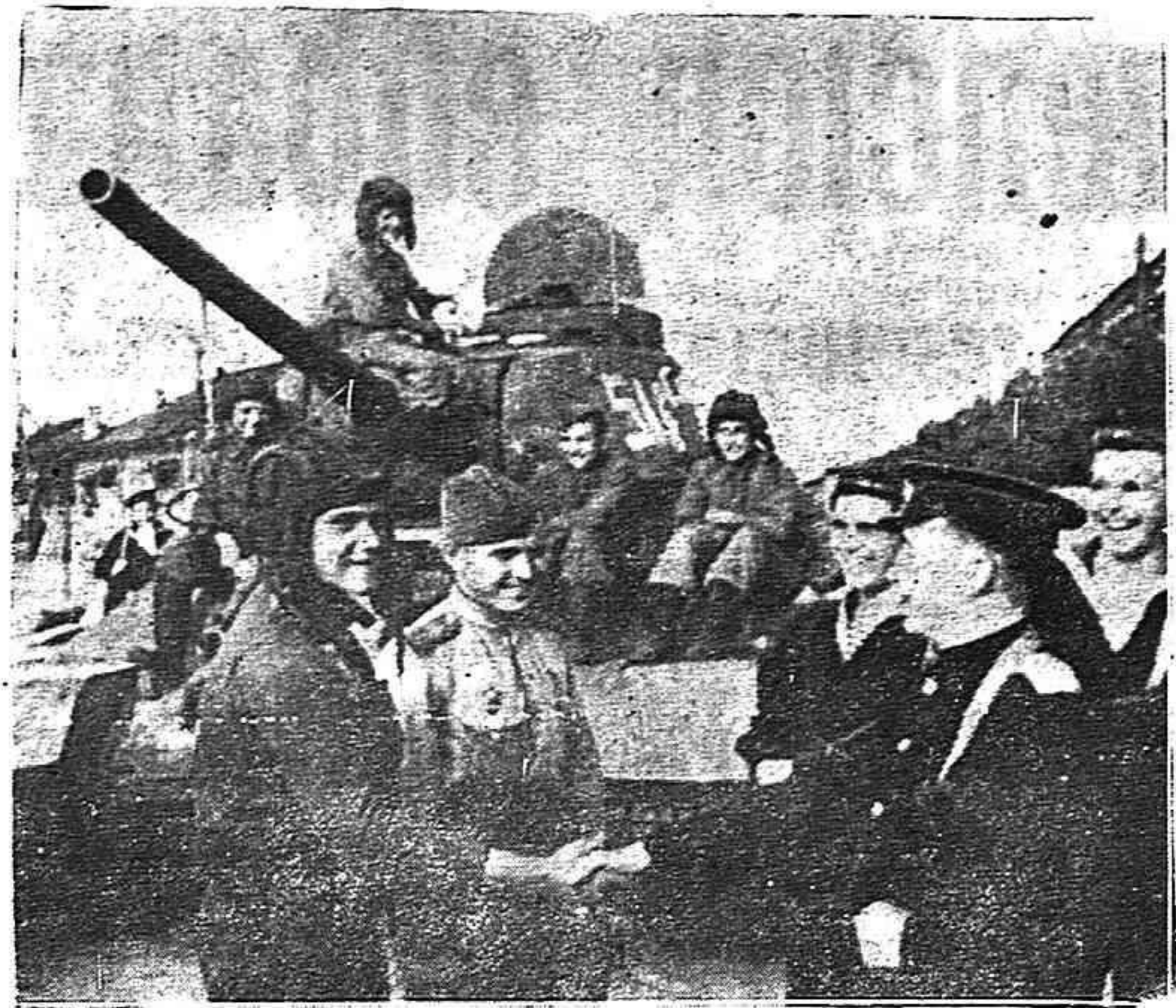
Tras una marcha relampagueante por tierra y por mar, tanquistas y marineros soviéticos se saludan a su llegada a Puerto Arturo.

En estos días de feliz triunfo de nuestro pueblo, toda la humanidad democrática se inclina ante el recuerdo luminoso de los héroes de Leningrado, de Moscú, de Stalingrado y de Sebastopol. En los días de pruebas más duras, se alzaron por orden de Stalin ante la formidable avalancha de la agresión fascista y salvaron a nuestra patria, salvaron del dominio de bárbaros salvajes a la civilización mundial. Las victorias del Ejército Rojo han librado a nuestra patria de la amenaza de invasión alemana en el oeste y de invasión nipona en el este. Esas victorias han hecho posible la tan esperada paz