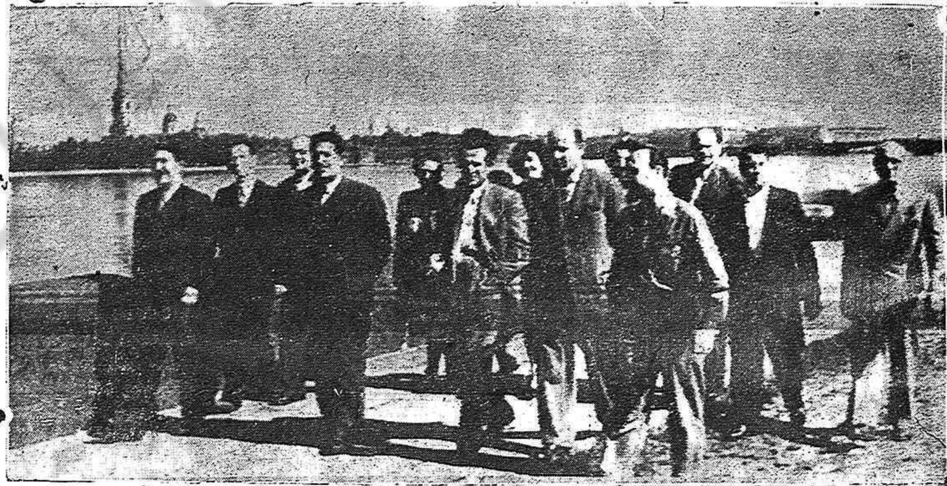
Una delegación fraternal de trabajadores italianos de visita en la URSS, recoge las orillas del Neva en la heroica Leningrado.

El Gobierno de Coalición puede ser la palanca que haga rodar, movida por el esfuerzo de nuestro pueblo, la agrietada y tambaleante roca del franquismo. Cuanto más tardemos en forjarla, más aumentará la ya larga cuenta de sangres y dolores de nuestro pueblo.