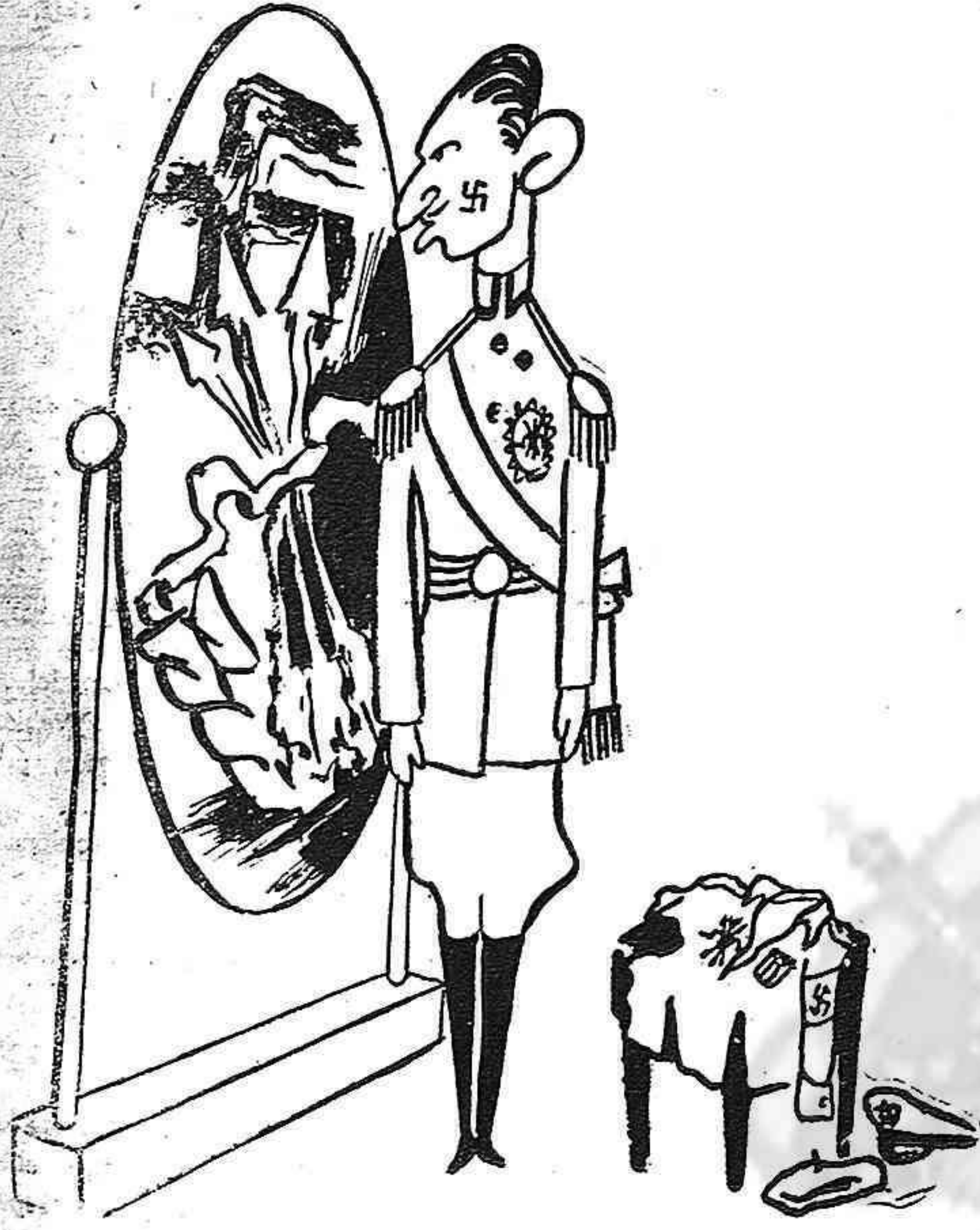
EL PRINCIPE: ¿PODRE PASAR CON ESTE MODELO?