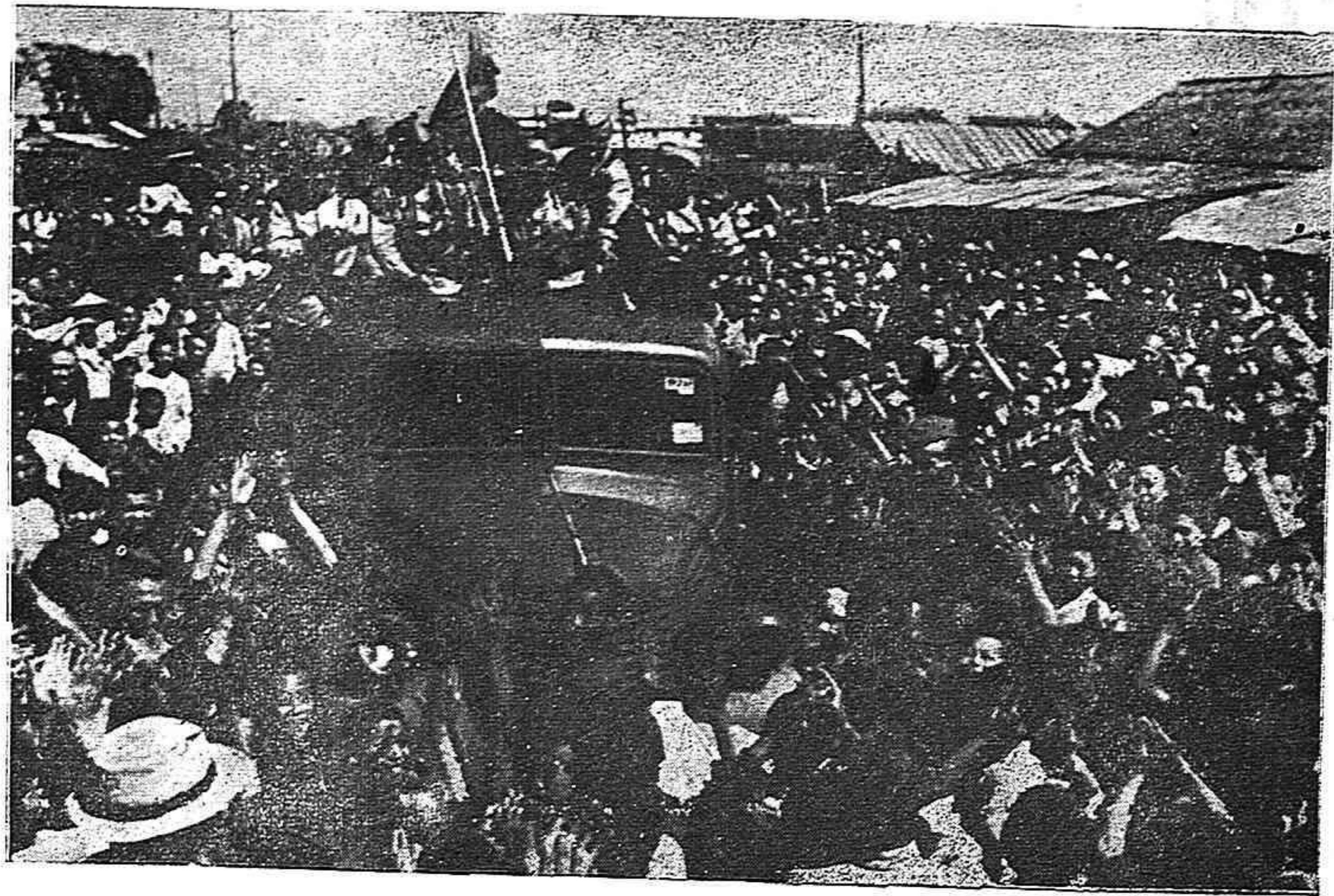
El pueblo de Manchuria acogió con desbordante alegría al glorioso Ejército Rojo en toda la vasta extensión de esa provincia china. En la foto, se ve a una muchedumbre popular en uno de los barrios de la ciudad de Harbin patentizando a los soldados soviéticos su júbilo y cariñosa amistad.