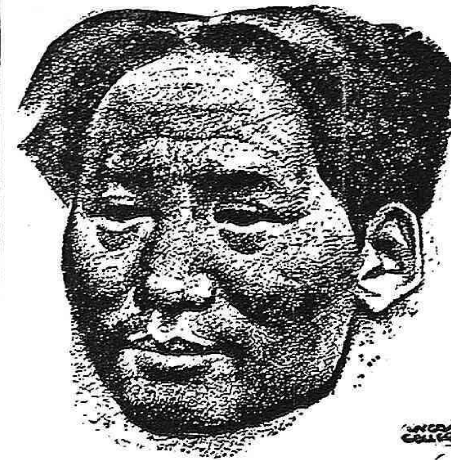
Comarada Mao Tse Tung, Secretario General del heroico Partido Comunista de China, el partido campeón en la lucha del pueblo chino por la derrota del imperialismo japonés.

su infamante obra. Esta infame maniobra reaccionaria debe ser desamascarada por todos los españoles antifascistas y patriotas, denunciándola ante el mundo democrático como una maniobra típica de los restos del fascismo que en España tienen hoy su principal base de operaciones contra las Naciones Unidas y la democracia española.