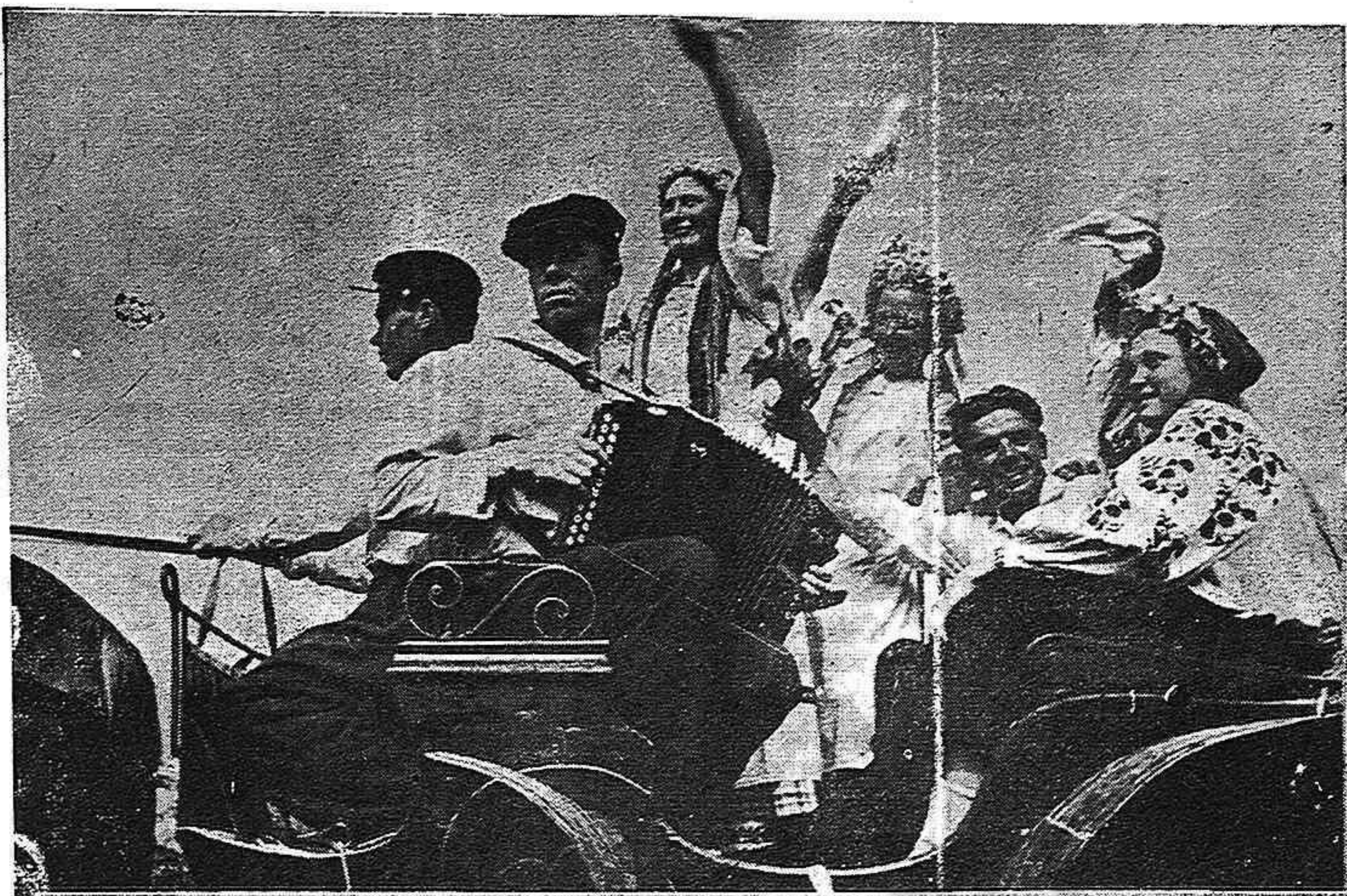
La alegría de la victoria se extiende entre todos los pueblos de la invicta y vencedora Unión Soviética

Del periódico IZVESTIA, Moscú, 29 de agosto de 1945.