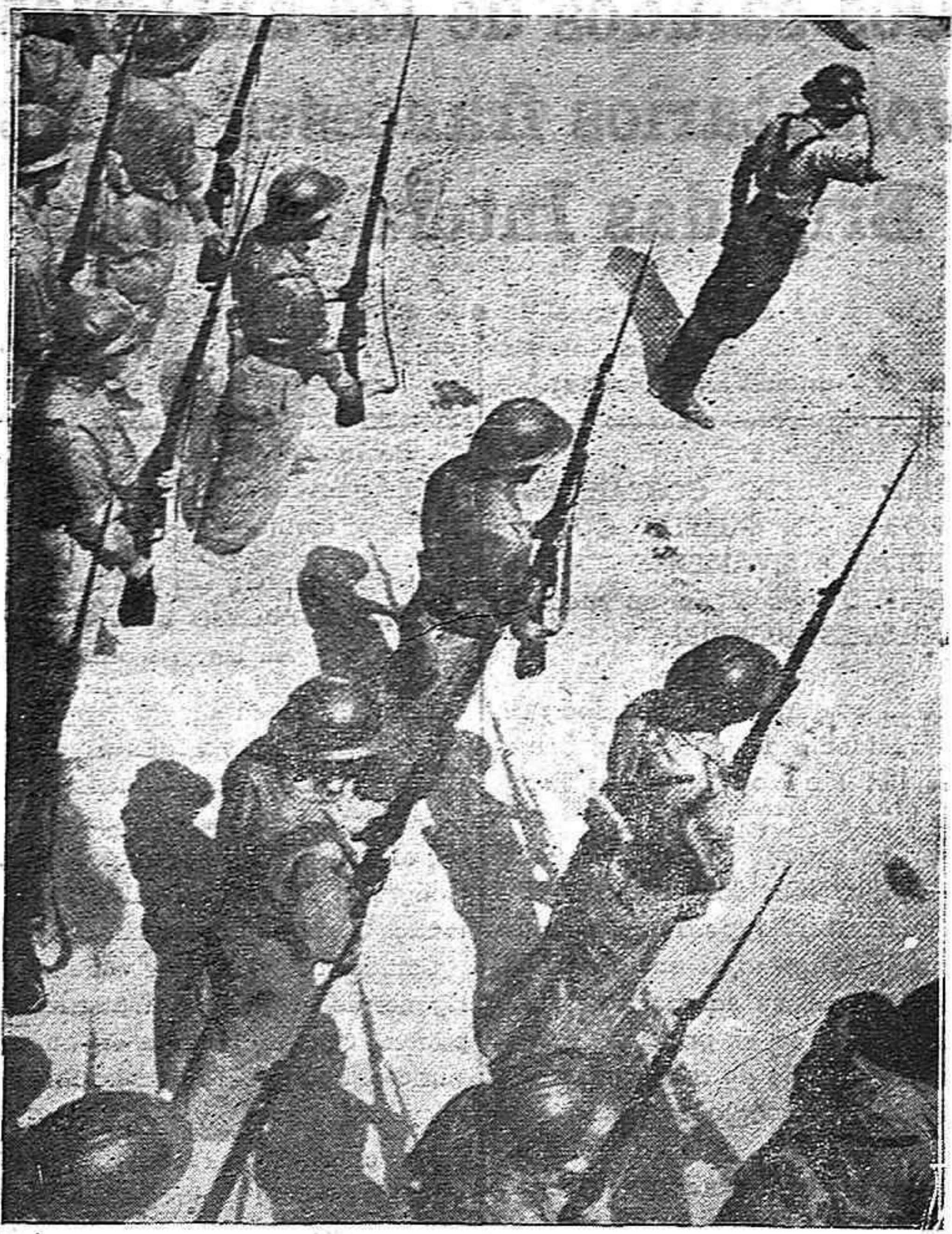
Auténticos hijos del pueblo de España, éstos fueron los gloriosos integrantes del Ejército Popular que defendieron con heroísmo inmortal la causa del pueblo y de la Patria durante tres años de guerra; éstos son los que hoy, en ciudades y sierras, luchan contra el fascismo y por la libertad de España; y éstos serán los que hayan de integrar el futuro Ejército de una España libre, democrática y progresiva.