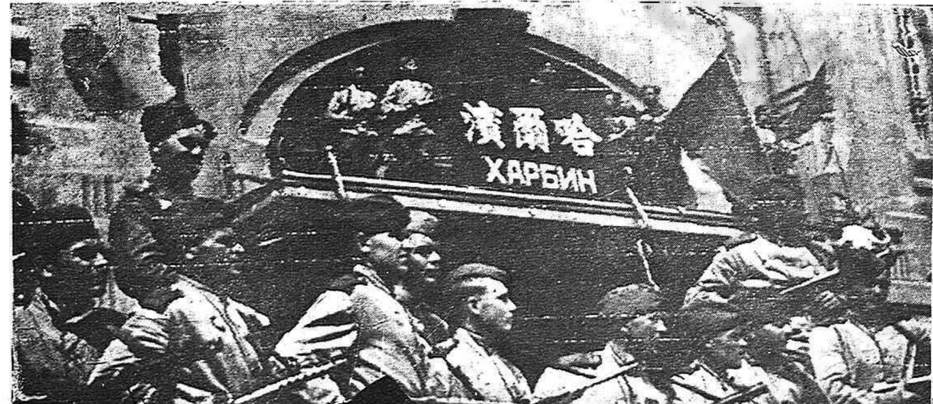
Después de sus múltiples y fulgurantes avances en tierras de Manchuria, el Ejército Rojo ocupó la ciudad de Harbin, que constituía el centro de mando fundamental de los nipones en el continente asiático.

(EL PUBLICO, PUESTO EN PIE, PRORRUMPE EN VIVAS Y GRANDES APLAUSOS).