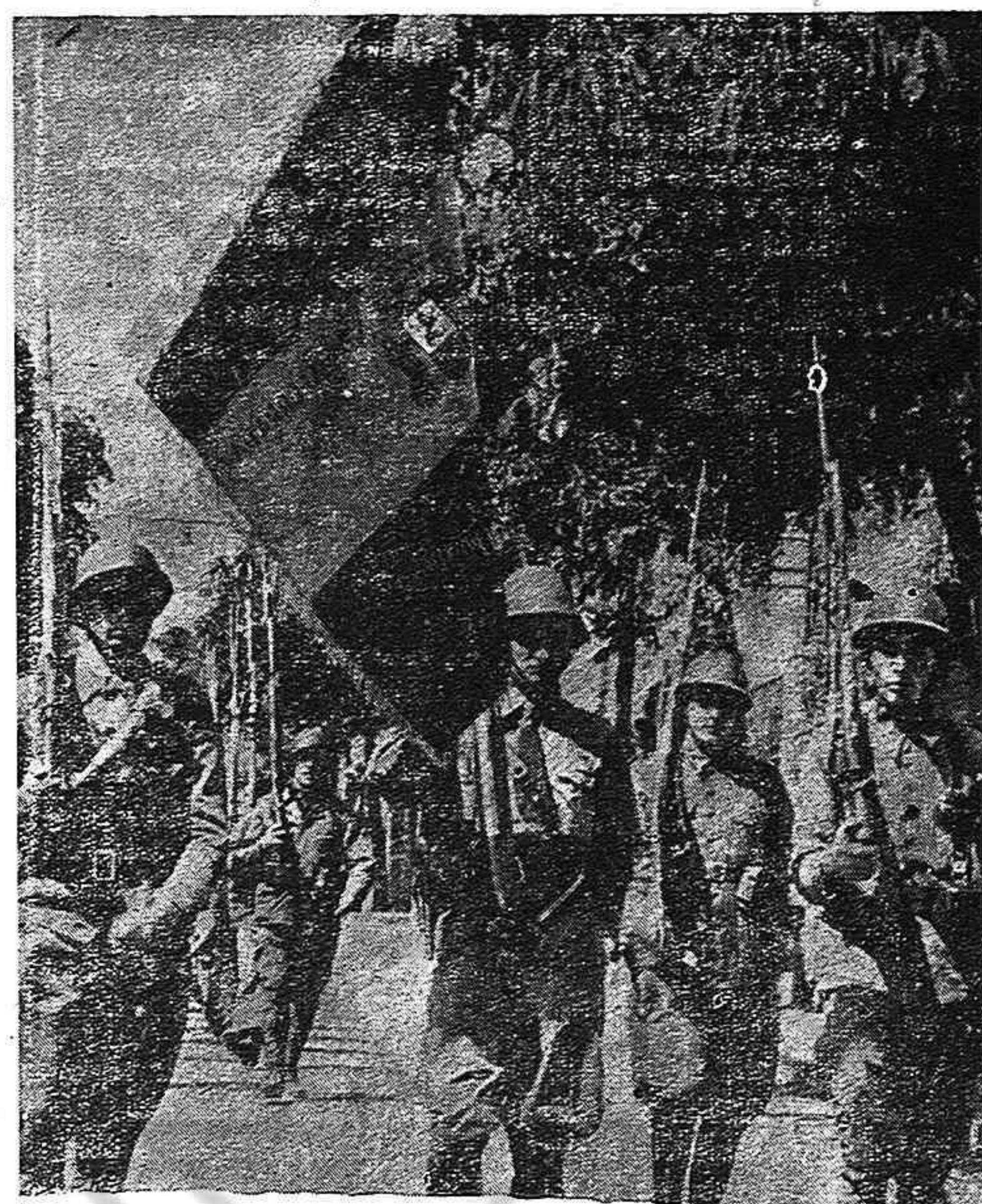
Sobre el fascismo falangista aplastado, formaremos un ejército republicano, democrático, popular, que sea la firme garantía de la independencia, de la libertad y del bienestar de España.

("IZVESTIA", Moscú, 30 de junio de 1945.)