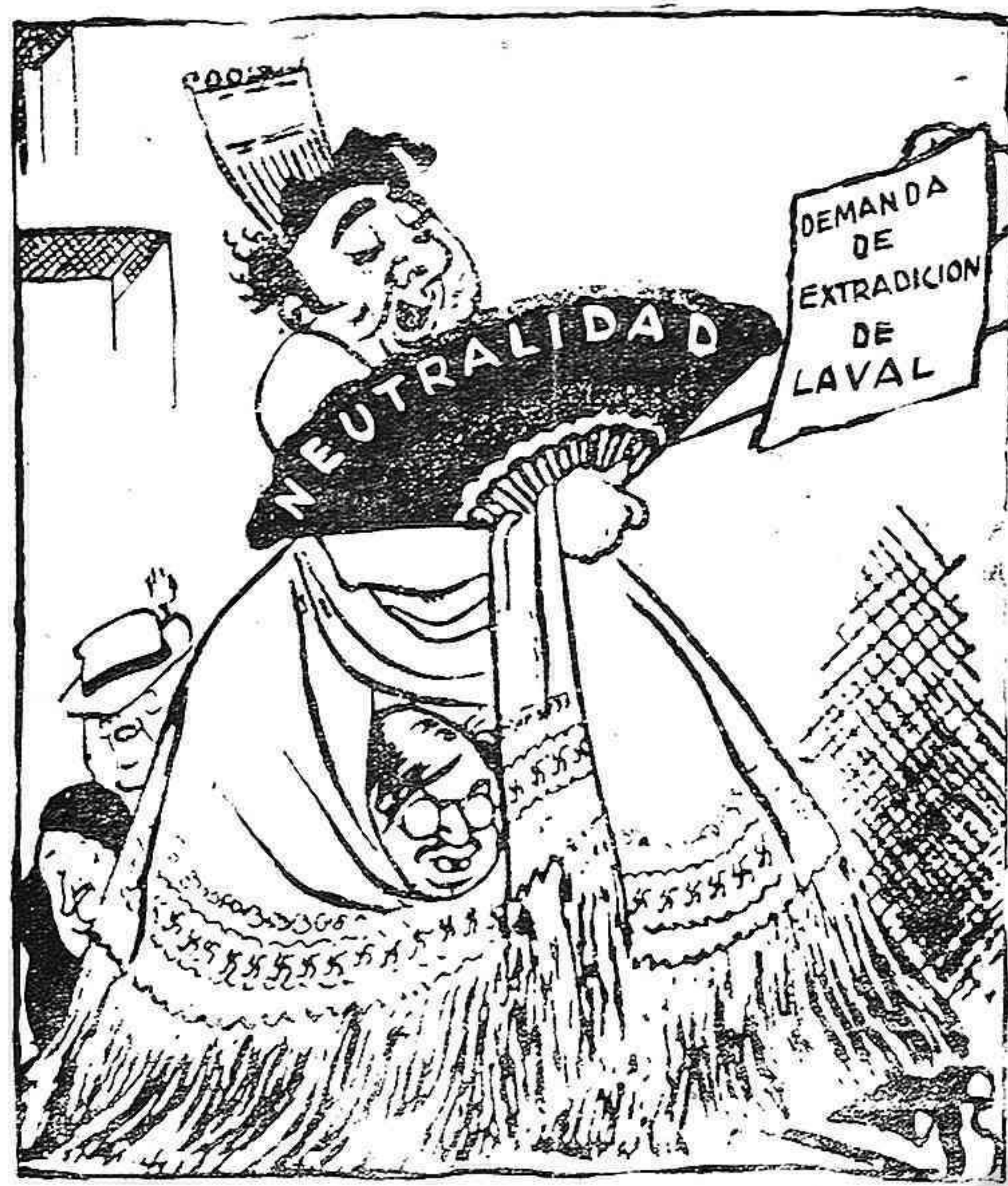
(Boris Efimov en "La Guerra y la Clase Obrera").

gistas han tratado por todos los medios de aplastar los profundos sentimientos democráticos de nuestro pueblo, su amor por la causa de las Naciones Unidas que es la suya, para de esa forma, mediante su usurpación del poder, envolver y comprometer a nuestra patria en la vil aventura nazi-fascista. EL FRANQUISMO ENEMIGO JURADO DE ESPAÑA Y DEL MUNDO Tales son los aspectos de lo que Franco y la banda falangista han hecho de España. El régimen franquista es un enemigo despiadado del pueblo español, de la nación