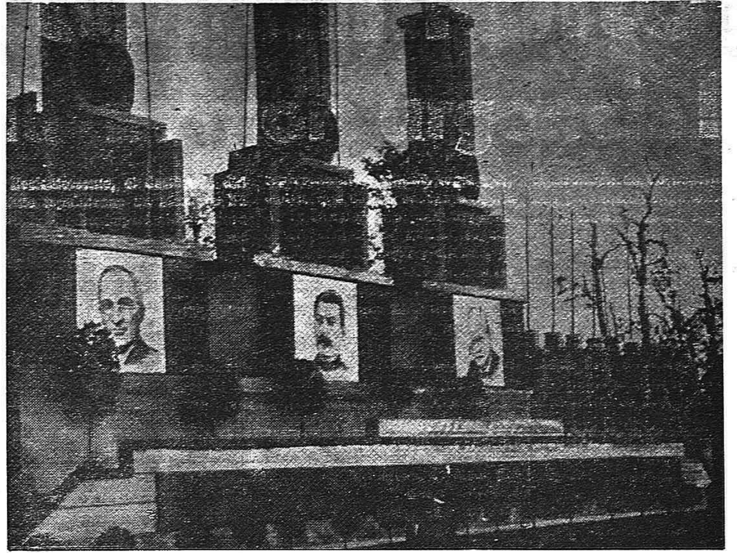
Berlin. En Unter den Linden, una enorme decoración realizada por arquitectos soviéticos se yergue como símbolo de victoria y de unidad de los grandes países que libraron la guerra.