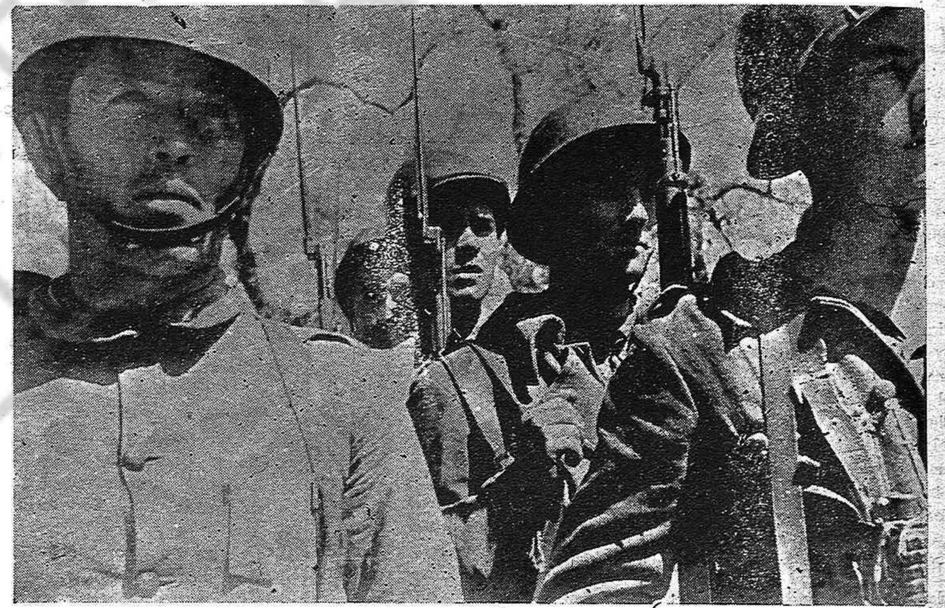
Hace nueve años fueron valerosos soldados del ejército Popular. Ahora son intrépidos y legendarios guerrilleros. Y pronto volverán a constituir el escudo irrompible de la libertad y progreso de España.

Se puede afirmar que, en la actualidad, el ambiente general de los antifascistas que se encuentran en las cárceles españolas, es de que dentro de la cárcel no se hace nada positivo y que el puesto de todos los españoles es en el monte, con los heroicos guerrilleros que siembran el terror entre las filas falangistas. Incorporarse a las guerrillas es la obsesión de la in-