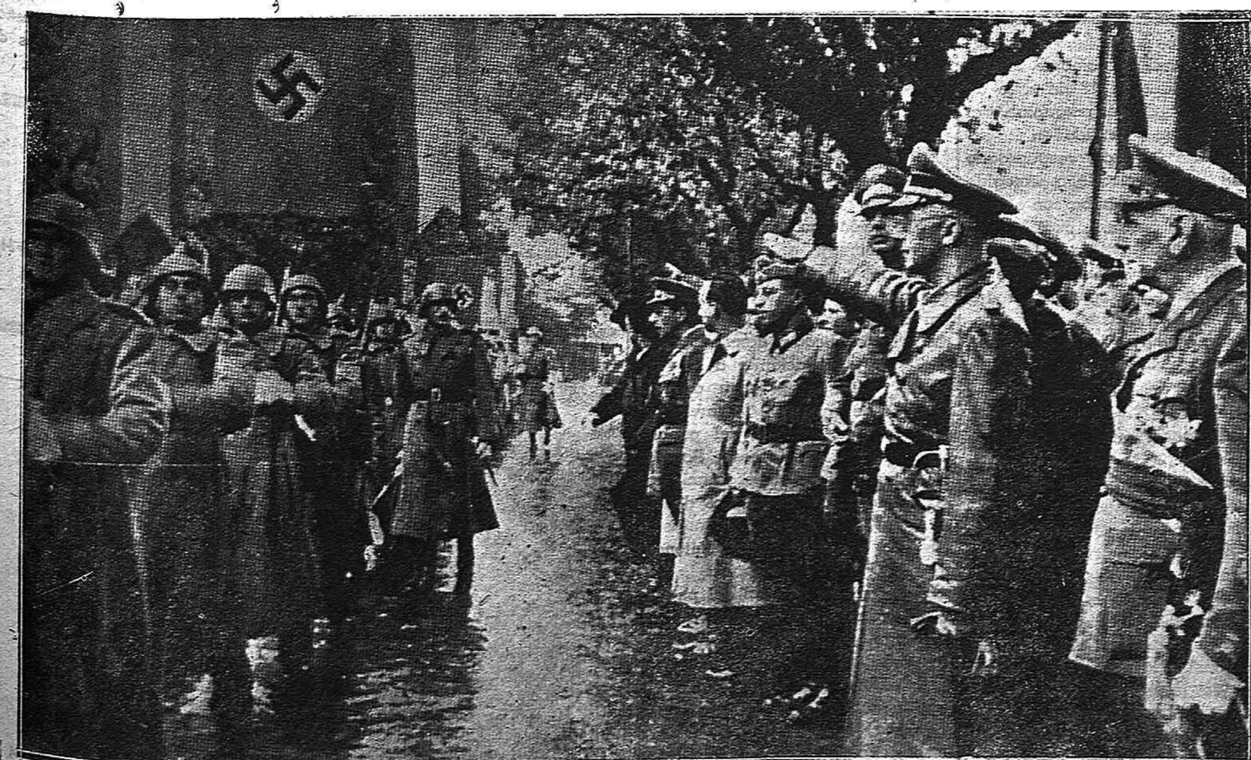
El crimen monstruoso del 18 de julio fue realizado por Franco y Falange bajo la égida de la swástica nazi, del segur fascista y de sus yugos y flechas de ignominia. ¡Cuanto asesinato y vejación a España y a su pueblo han cometido en estos nueve años! Y ahora hablan de "democracia", de "neutralidad", de "derecho a formar parte de la organización mundial". En la presente foto los tenemos en los momentos de euforia, en los momentos de la "camaradería" de fascismo y de armas. Himmler, en la Castellana de Madrid, revista las tropas franquistas como si revistase a la Wehrmacht en Unter den Linden. Himmler terminó ya con cianuro. Franco y Falange terminarán en la horca.