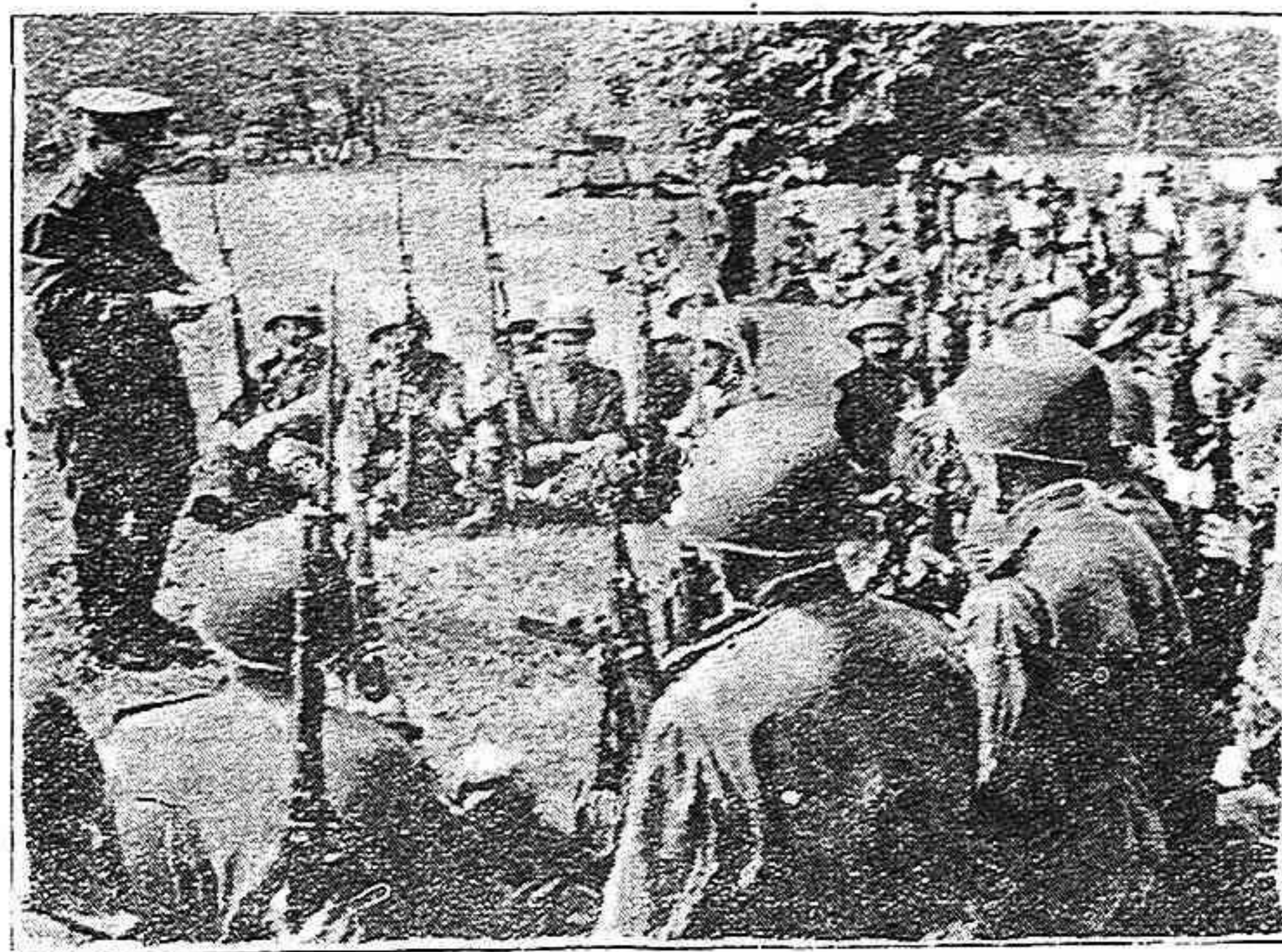
En uno de los barrios de Berlín, una unidad de soldados soviéticos escucha una lección teórica.