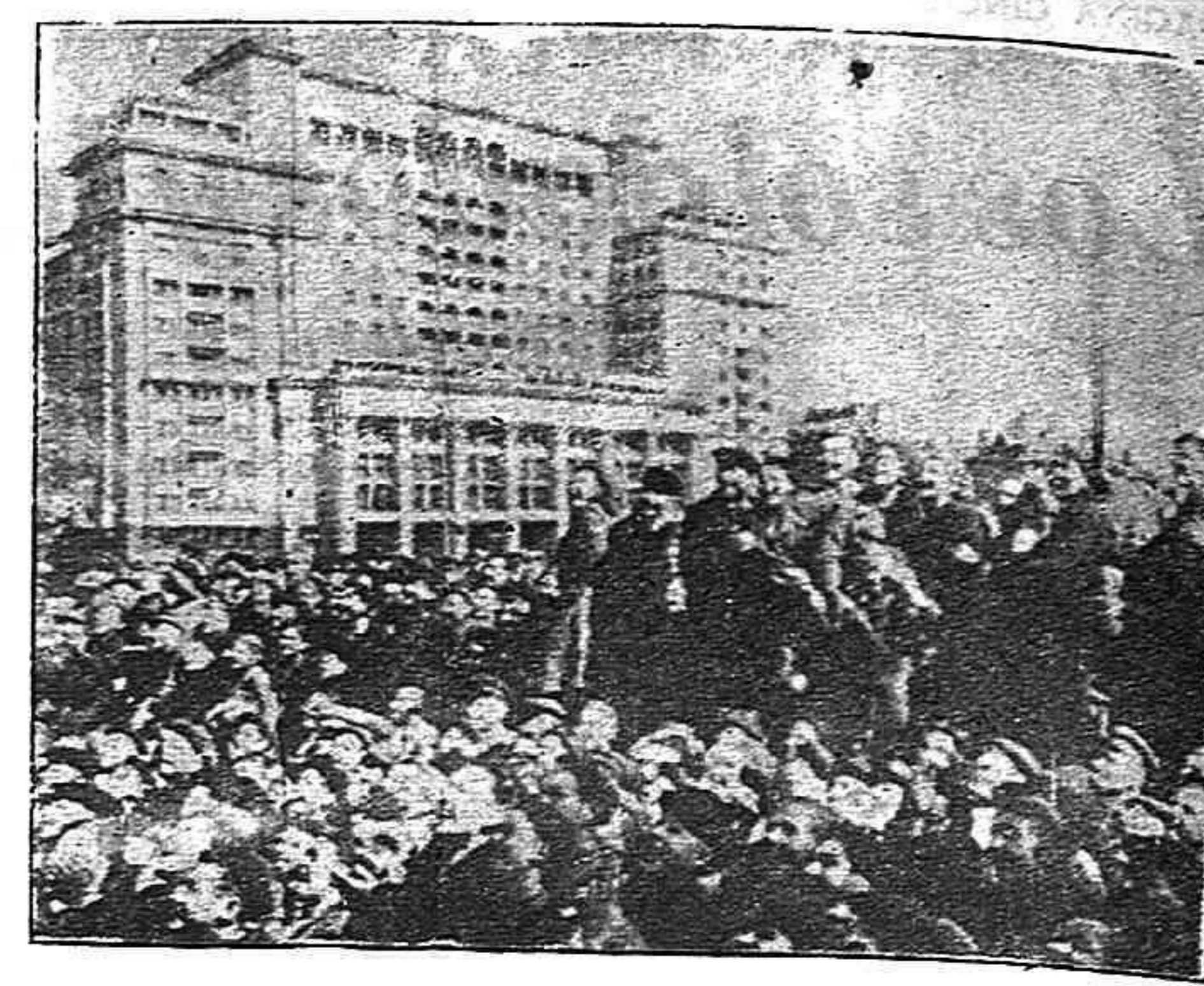
Enormes multitudes jubilosas celebraron en Moscú el día de la Victoria sobre el hitlerismo. En la foto se ve una gran muchedumbre ante la Embajada norteamericana.