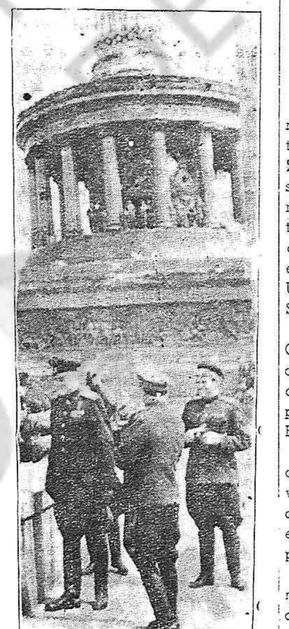
El Mariscal Rokossovski (primero a la izquierda) al pie de la Columna de la victoria de Berlín.