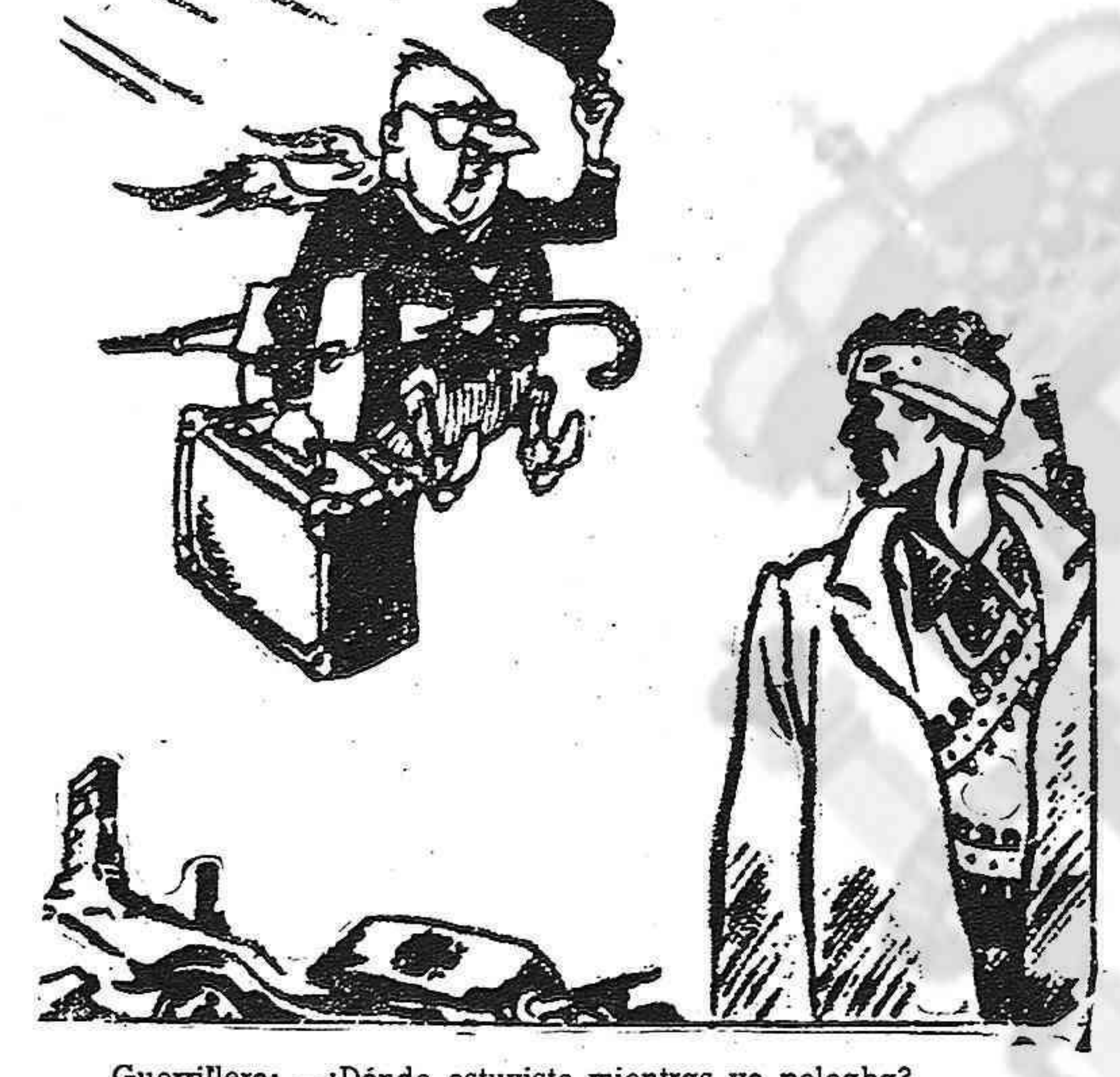
Guerrillero: —¿Dónde estuviste mientras yo peleaba? Ex-Ministro: —Estuve en la emigración, bebiendo whiskey y esperando la paz, pero ahora estoy dispuesto a sacrificarme y a gobernar el país.

Boris Elimov en "Estrella Roja" de Moscú.