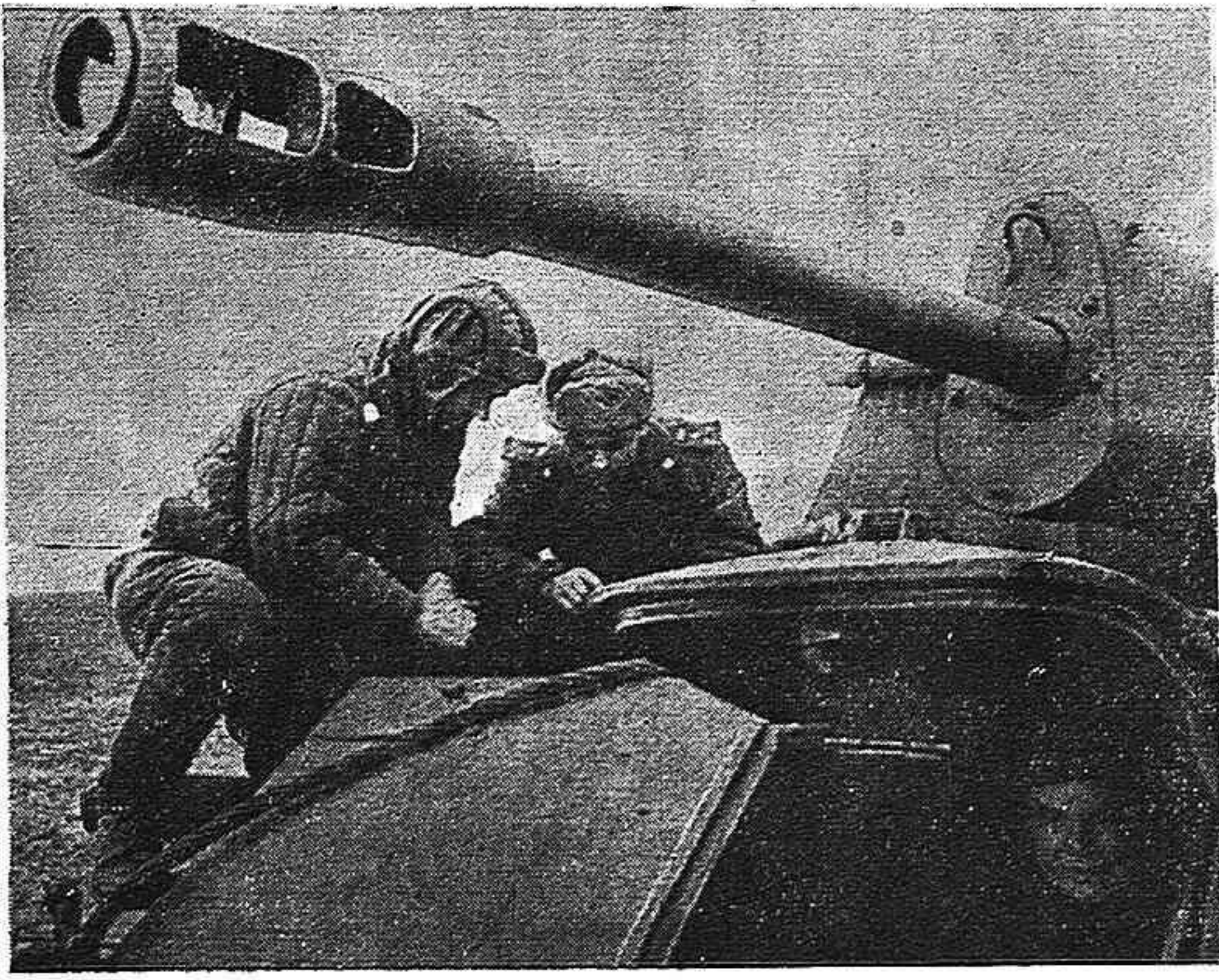
Planeando una nueva misión en las proximidades de Budapest.

de ser permitida en estos momentos a los más interesados en el mismo: a los propios españoles. Esta es una época en que en el interior del país, comprendiéndolo así, habrá de celebrarse los esfuerzos de organización y combate. En el exterior, paralelamente hemos de centuplicar las energías y marchar mucho más