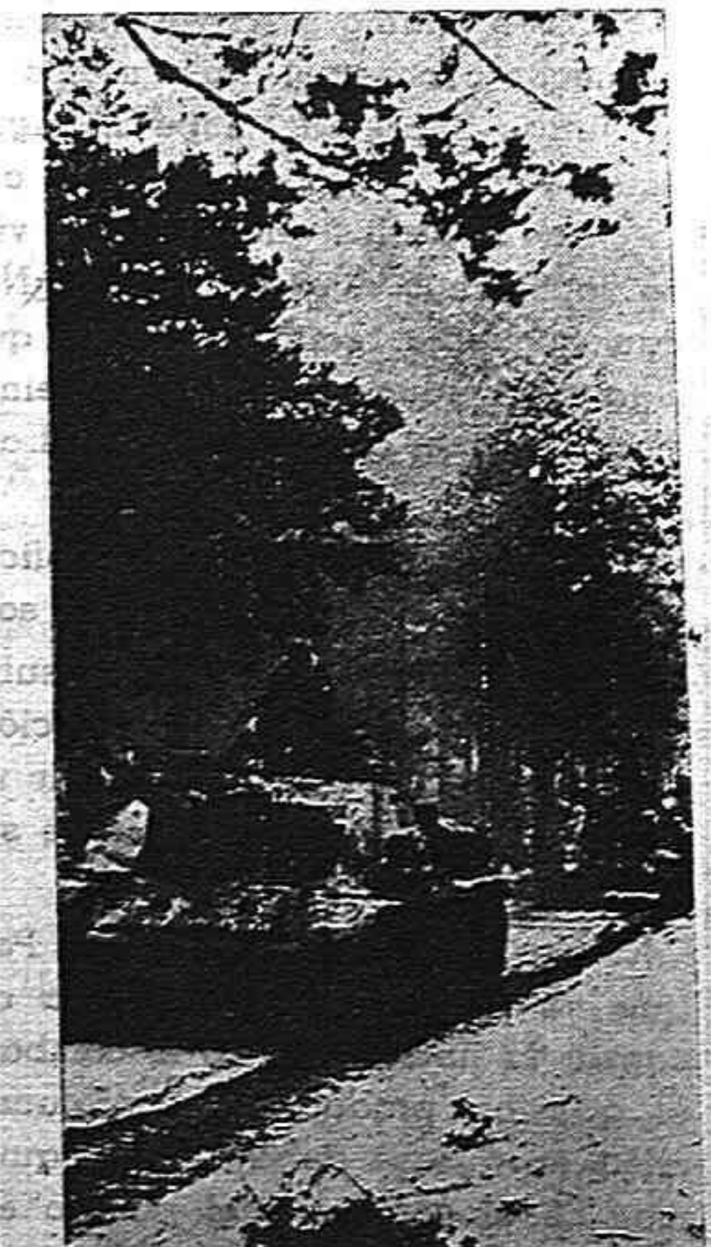
Cañones de autopropulsión pertenecientes al ejército de Cherniajovky con rumbo a Koeningberg, capital de la Prusia Oriental.