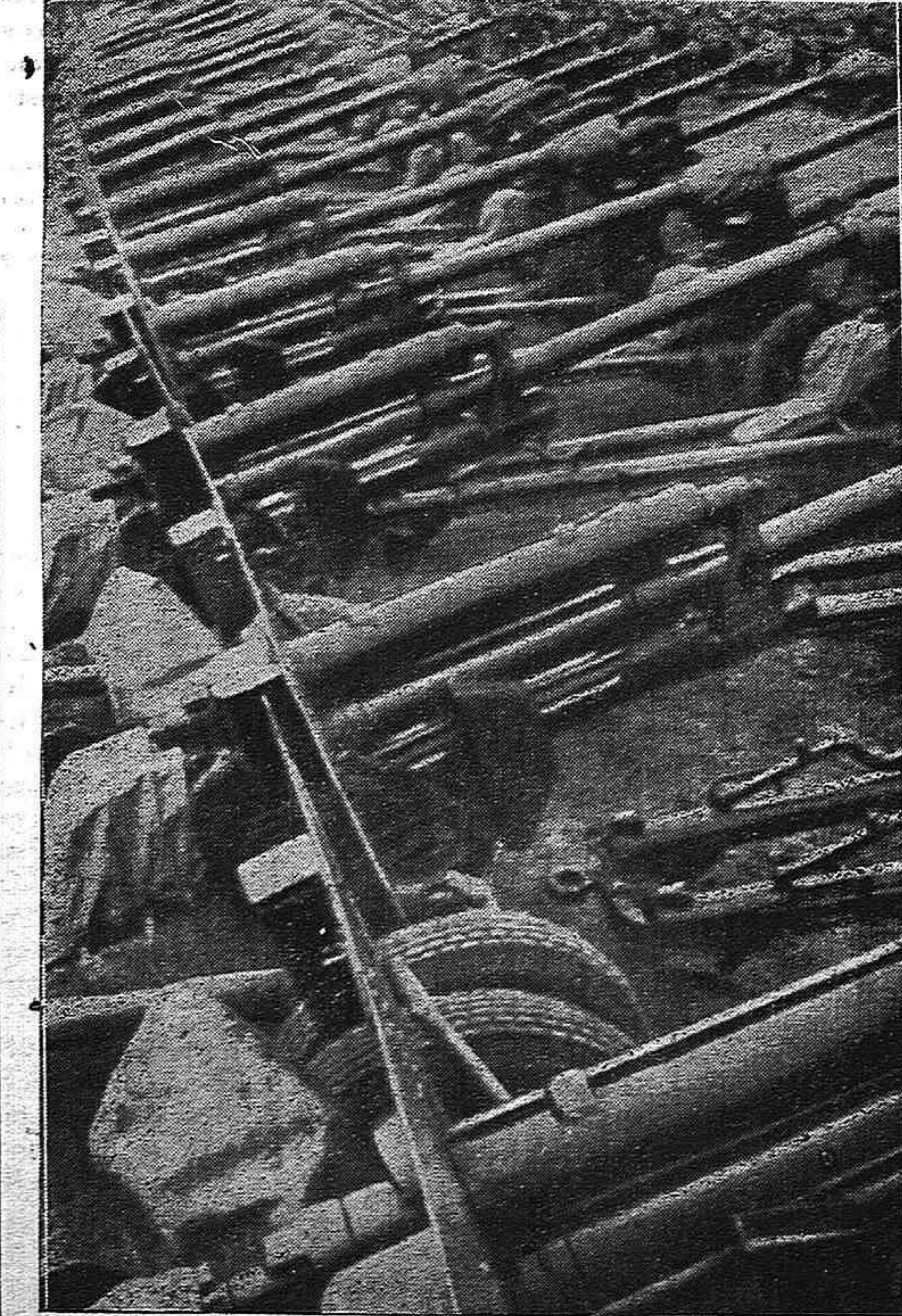
Una "hornada" de cañones está lista para emprender el camino del frente.

Un sólo hecho bastará para dar la tónica de la simpatía y del respeto que el Partido despierta entre los mejores luchadores del pueblo. Consiste en que en todas las cárceles es corriente que los condenados soliciten el ingreso al Partido deseosos de morir bajo una bandera gloriosa que tantas víctimas cuenta en favor de la libertad y que realiza sin desmayos ni claudicaciones la batalla implacable contra los enemigos del pueblo. Uno de estos casos que más emoción produjo fué el de un anarquista preso, que la noche antes de morir,