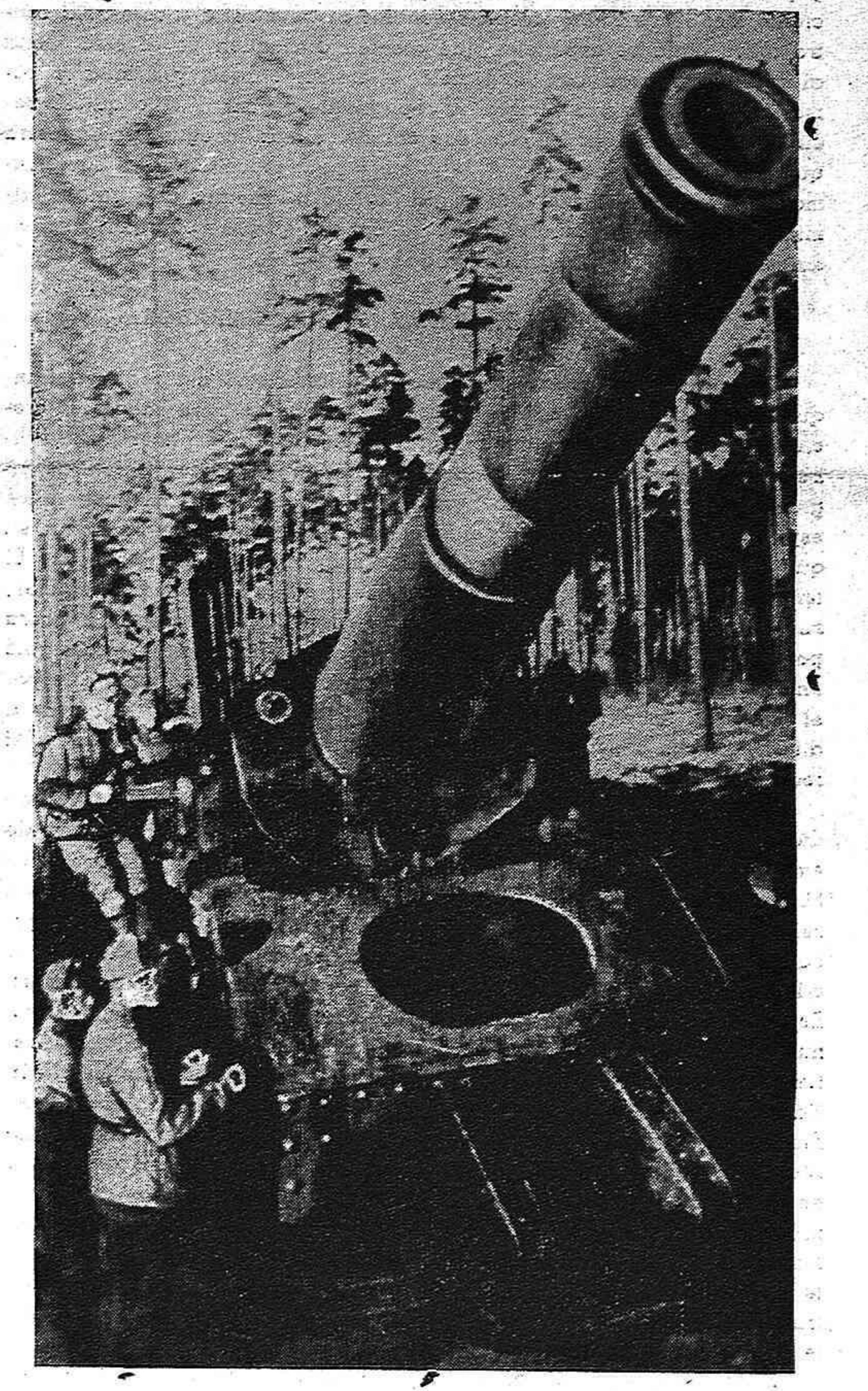
Una de las poderosas piezas artilleras del Ejército Rojo que en estas jornadas están pulverizando las defensas nazis en las llanuras de Polonia.

paña. De las palabras del Sr. Negrín obviamente se desprende la perentoriedad de la unidad republicana y democrática española como la condición vital de la liberación patria en momentos en que la horrenda calamidad del fascismo está siendo barrida de las tierras de Europa. Ciertamente, es el arma de la disensión en las inmensas filas adversarias uno de los más importantes instrumentos de supervivencia que esgrime alevosamente el régimen hitlerizado que sojuzga a España. Es esta verdad indiscutible y elemental algo profundamente arraigado en el ánimo de todos los que dedicamos nuestros mejores esfuerzos, consiguiéntenente, a impulsar y propiciar una vas-