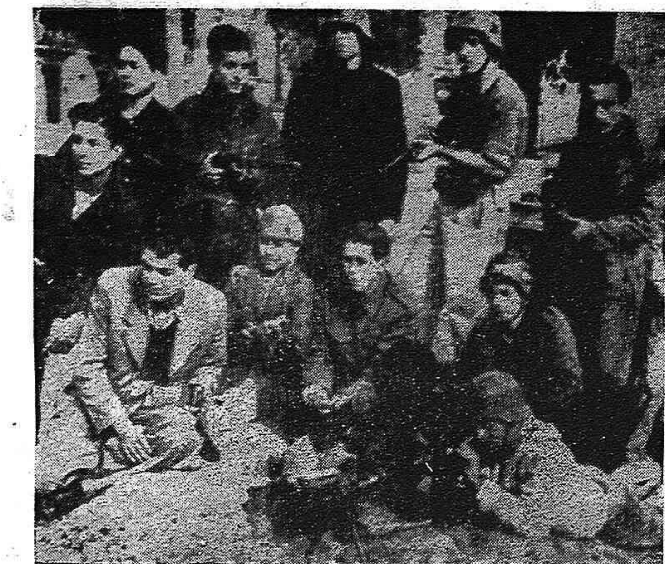
Endurecidos y avezados por cuatro años de lucha contra los invasores nazis, un grupo de combatientes de las unidades juveniles del ELAS griego se dispone a cumplir nuevas misiones para garantizar la libertad e independencia de su patria.

El pánico que los falangistas sienten ante el incremento de la lucha del pueblo y ante su segura y próxima derrota, ha tenido como consecuencia, en un loco afán defensivo, el incremento del terror hasta grados que jamás antes se habían conocido. Un sólo dato dará la medida de esta nueva era de persecuciones. Sólo en las regiones próximas a los Pirineos — en Cataluña y Navarra — han sido dete-