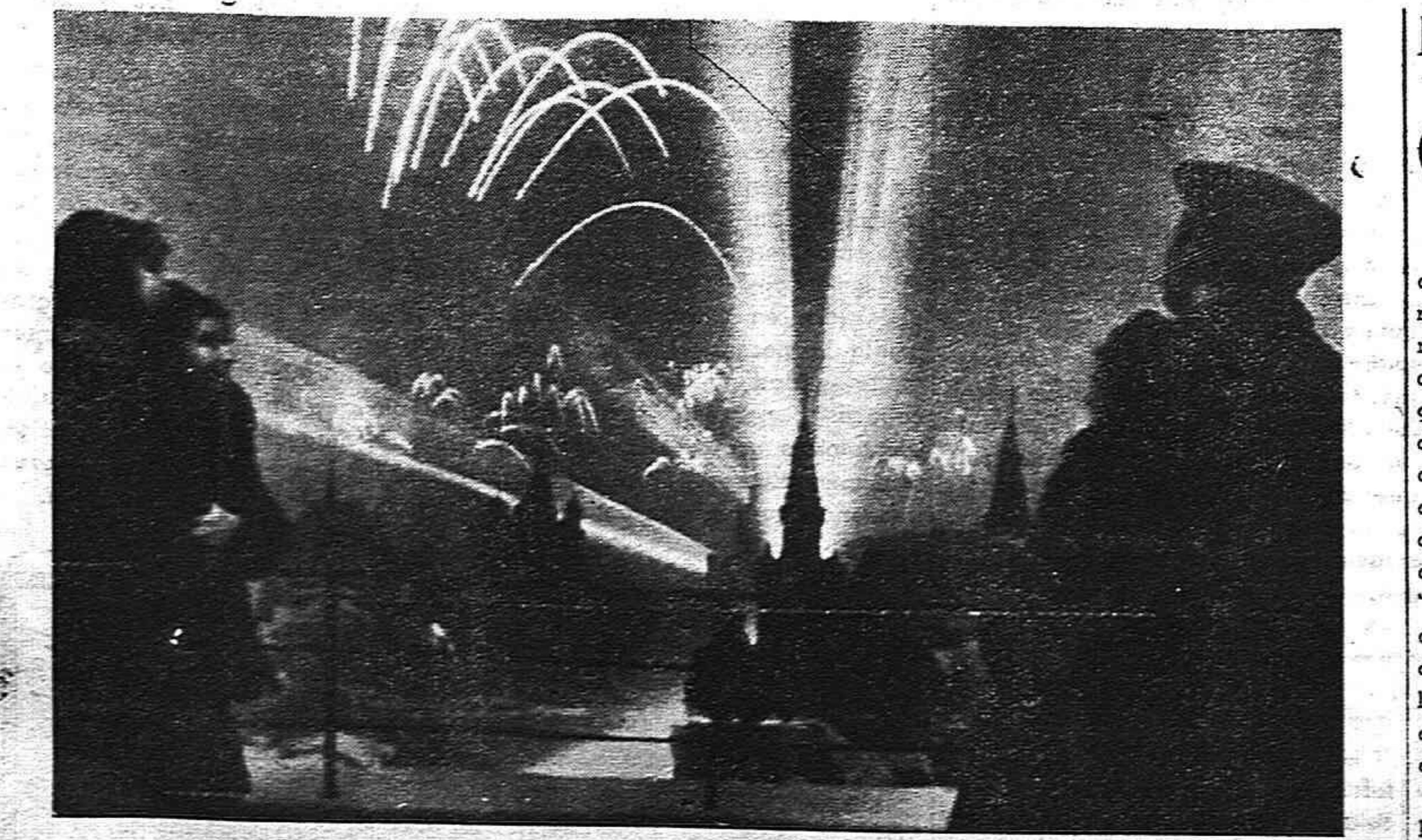
En la noche del 19 de noviembre, Moscú produjo escenas de belleza y de alegría como la que muestra la foto para celebrar el Día de la Artillería del Ejército Rojo.