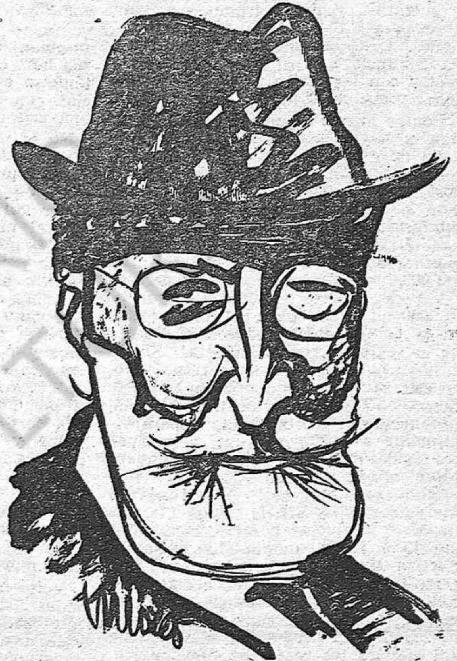
Dibujo de Enrique Moret

siete, yo le veía semanalmente en la Academia Española; y conversando con él en el saloncillo contiguo a la sala de juntas, semana tras semana contemplaba con admirativa amistad un hombre siempre dispuesto a manifestarse sin aspaviento, pero con firmeza, contra la opresión y la injusticia; en defini-