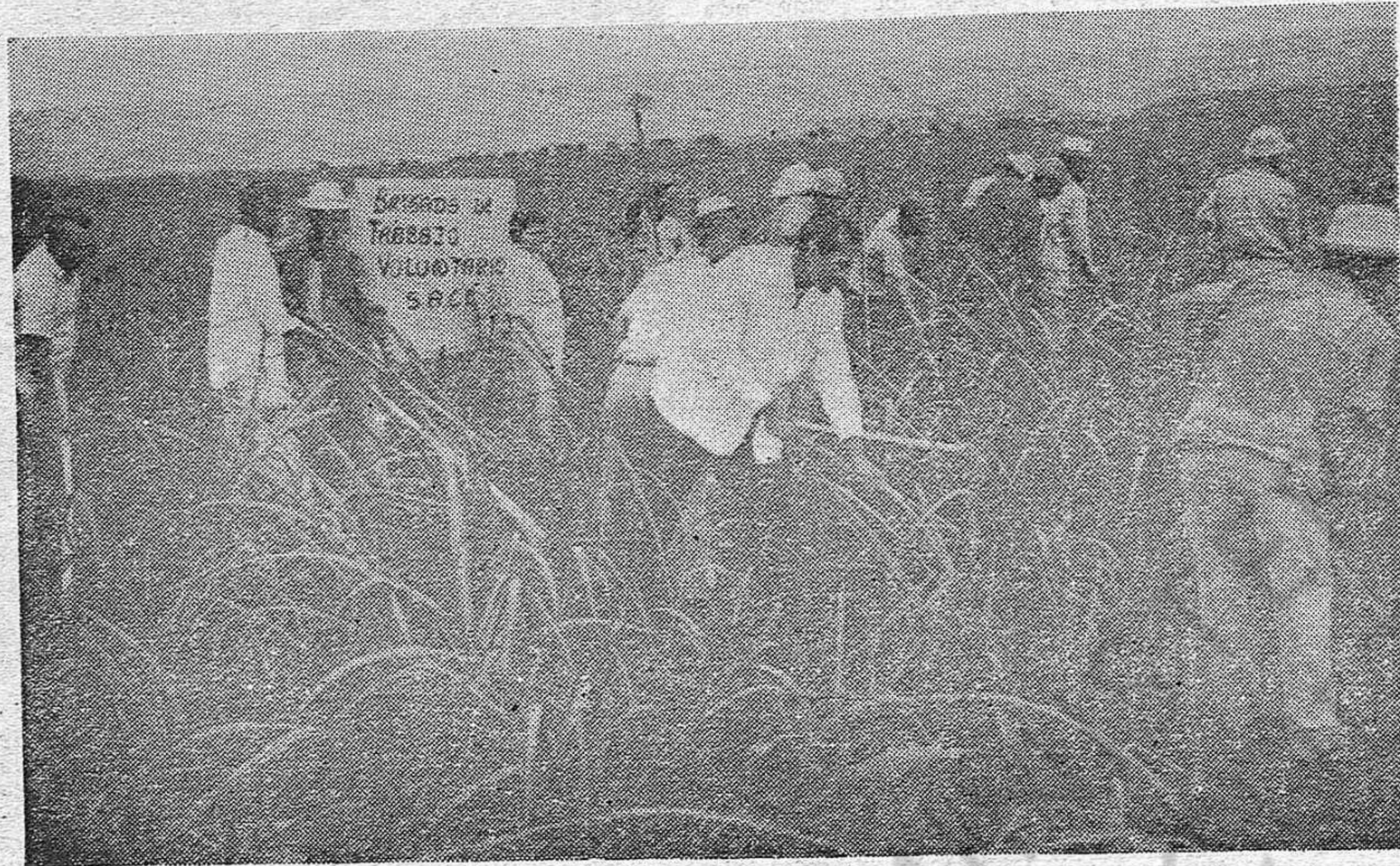
Los compañeros que integran el Comité de la SACE en la Básica del Guaso, trabajando en el campo de caña que tienen a su cargo.