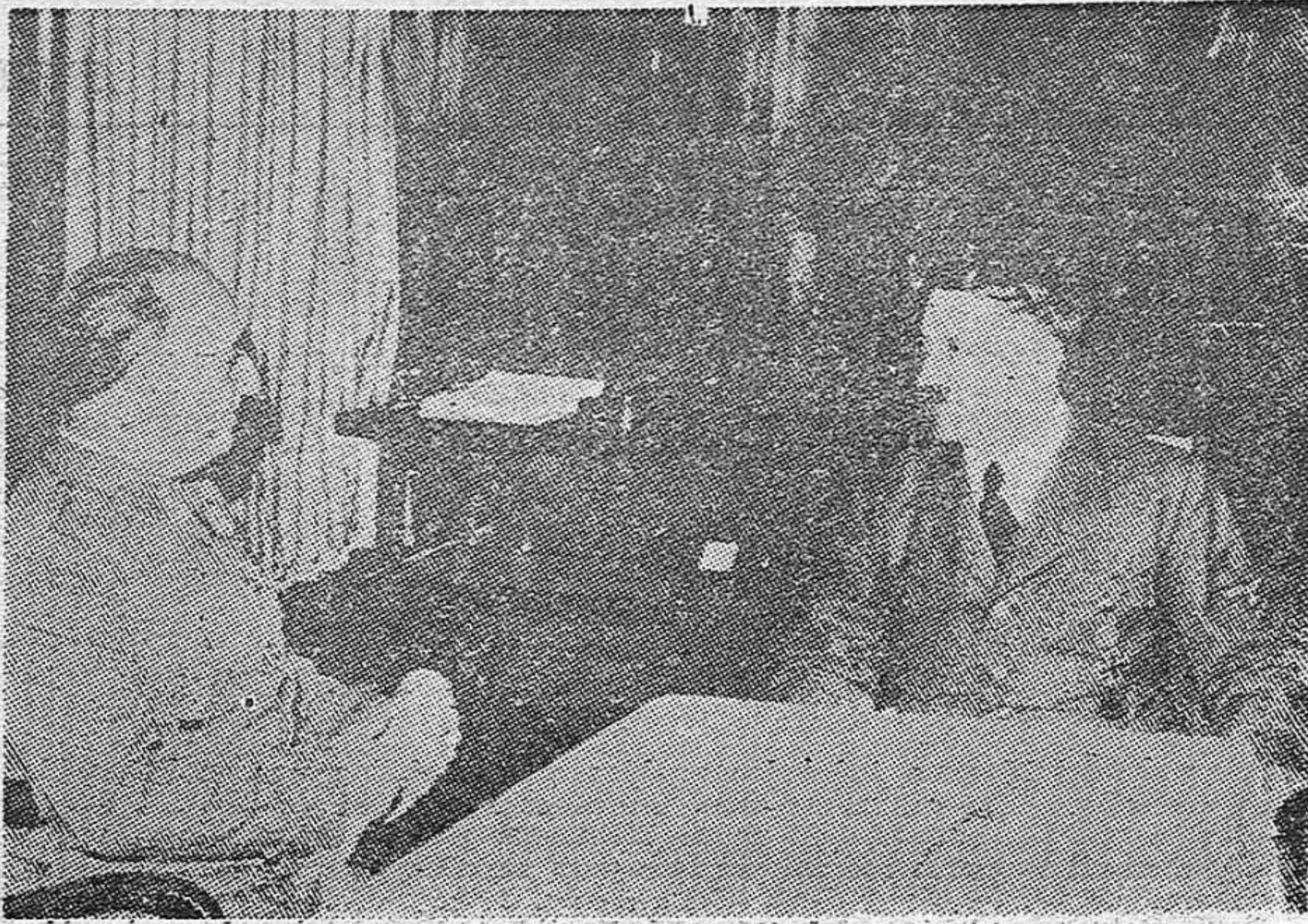
1940: Hitler y Franco

A los veinte y tantos años de la derrota del fascismo en la segunda guerra mundial el neonazismo se levanta como una amenaza real a la democracia, a la cultura y a la vida misma de los pueblos.