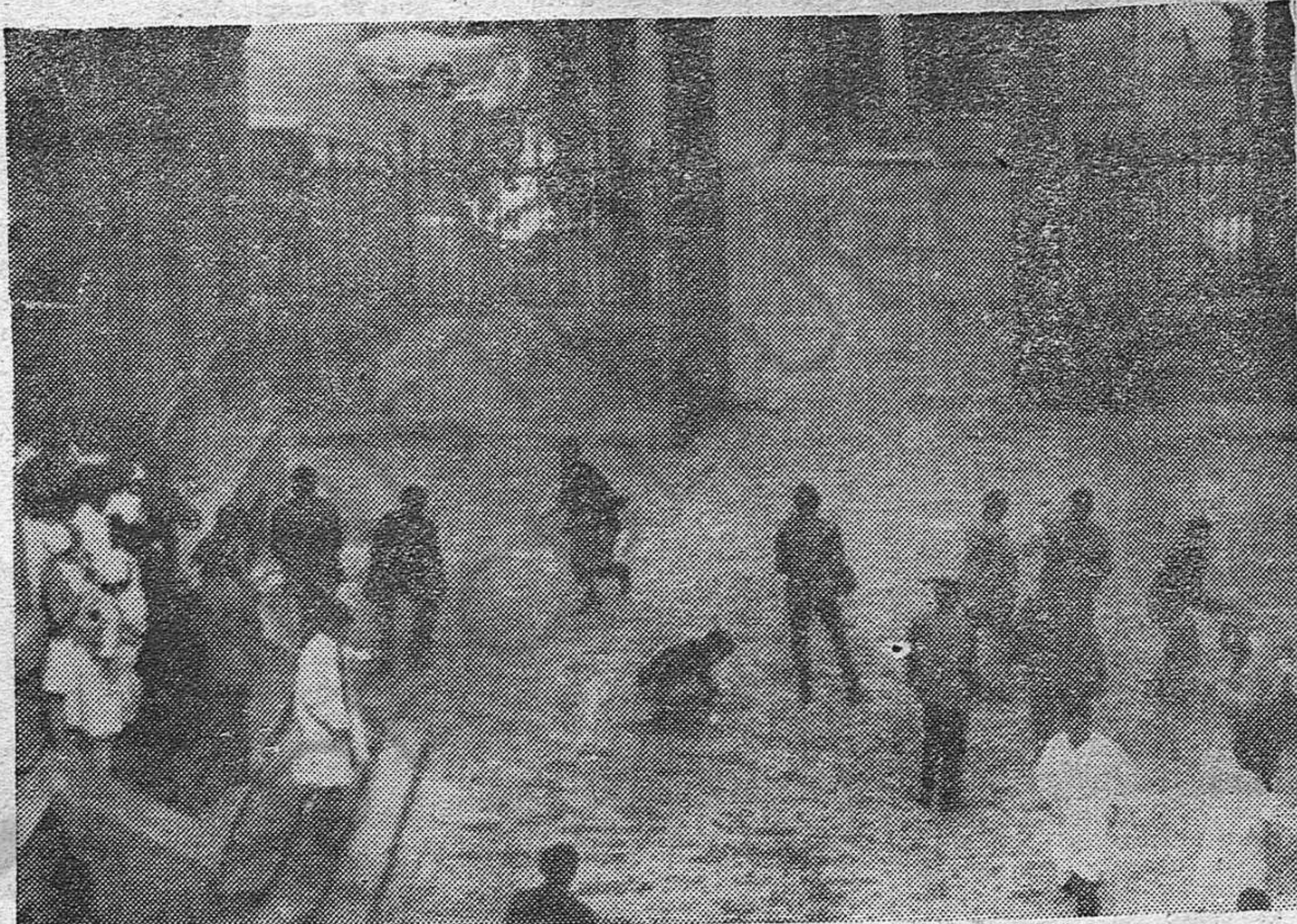
Una escena de la defensa de la Universidad de Barcelona por los estudiantes, cuando la policía intentaba penetrar en ella el día 5 de diciembre.

MADRID, diciembre 11.—Un Tribunal militar de Madrid absolvió a cuatro pintores del grupo llamado "Equipo Realidad" que fueron juzgados bajo la acusación de un delito de "impresión clandestina", por haber reproducido retratos del presidente Ho Chi Minh y del comandante Ernesto Che Guevara.