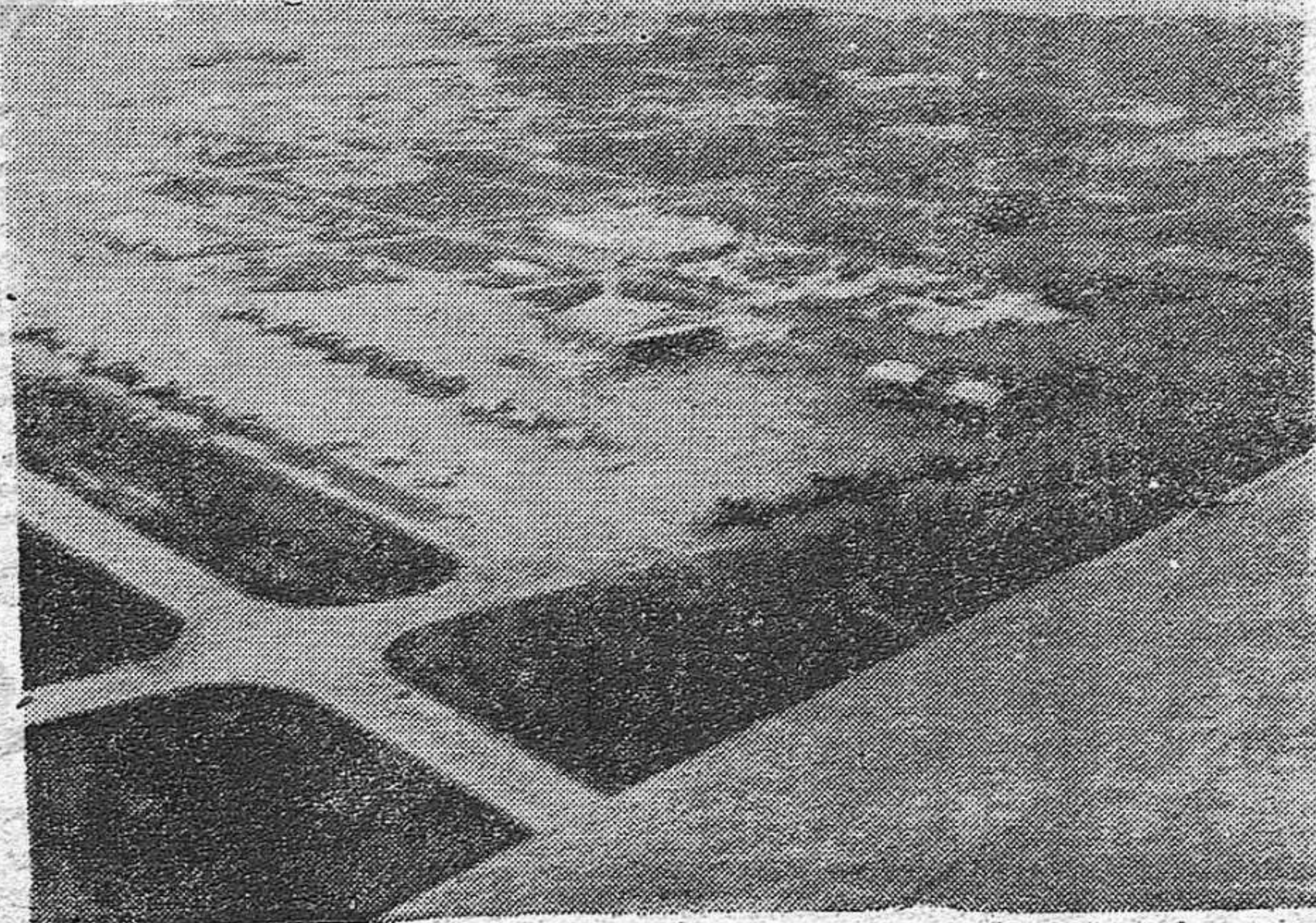
Vista aérea de la base de Rota

En las últimas semanas numerosos visitantes indeseables han llegado a Madrid: el secretario de Estado norteamericano Dean Rusk, los altos jefes militares de los Estados Unidos y, por si fuera poco, el canciller de la Alemania Federal, Kiesinger encargado de "presionar" sobre el gobierno español para que suavice sus exigencias.