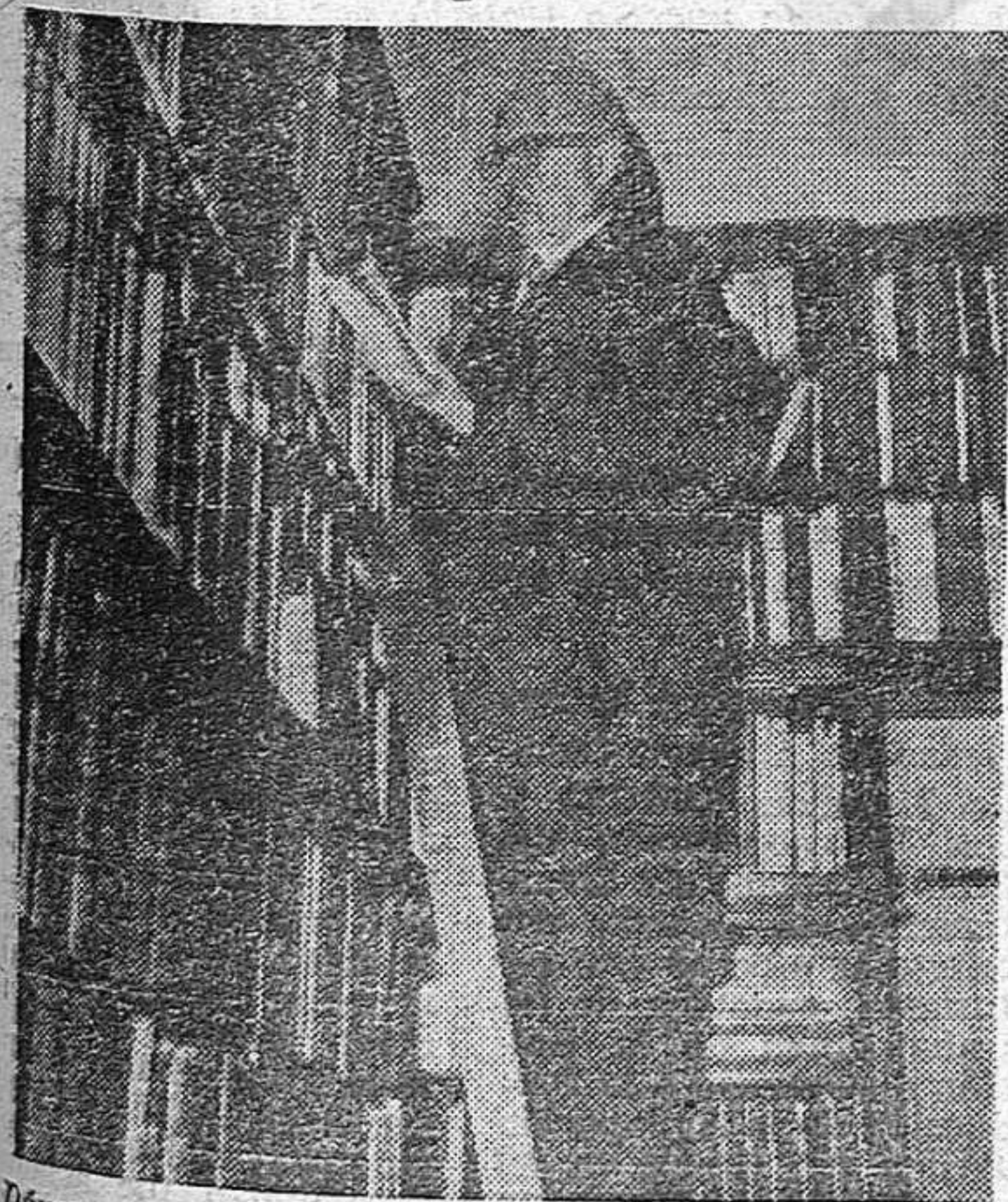
Damaso Alonso, escritor, poeta y filólogo, que acaba de cumplir los 70 años de edad, ha sido elegido para sustituir como presidente de la Real Academia Española, al patriarca de la ciencia española, don Ramón Menéndez Pidal, que falleció el 14 de noviembre. (En la foto que publicamos, una de las últimas de Damaso Alonso, aparece éste en su biblioteca).

Presidente de la Real Academia Española.