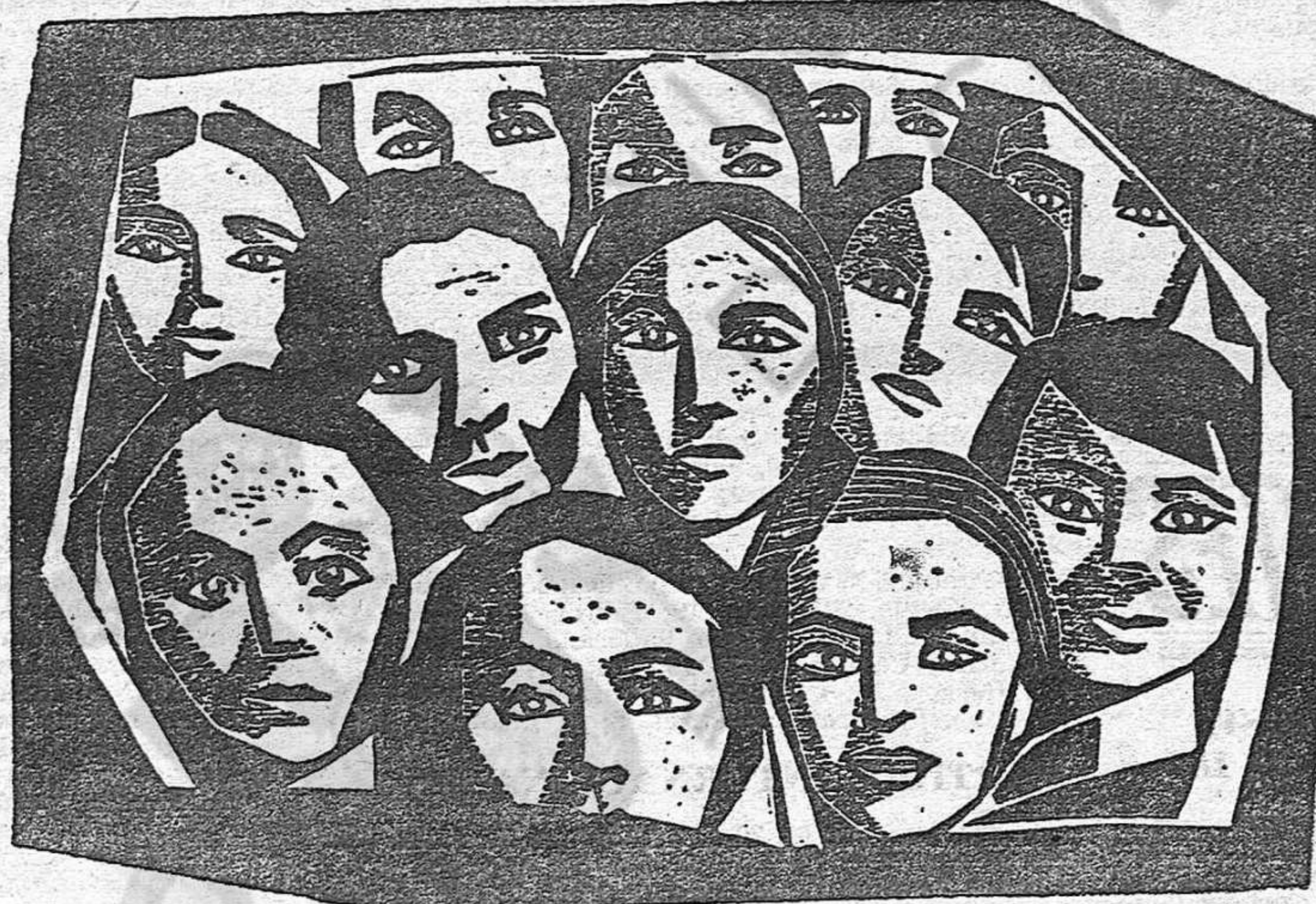
Grabado de Manuela Renau

Lo expuesto y mucho más plantea a los comunistas la necesidad de seguir atentamente y de valorar justamente la fuerza revolucionaria que ello contiene. Ninguna de las reivindicaciones específicas de la mujer debe ser ignorada por las fuerzas de vanguardia porque cada una de ellas es un factor que moviliza y organiza a millones de españoles, imprescindibles a la lucha general por la democracia y el socialismo.