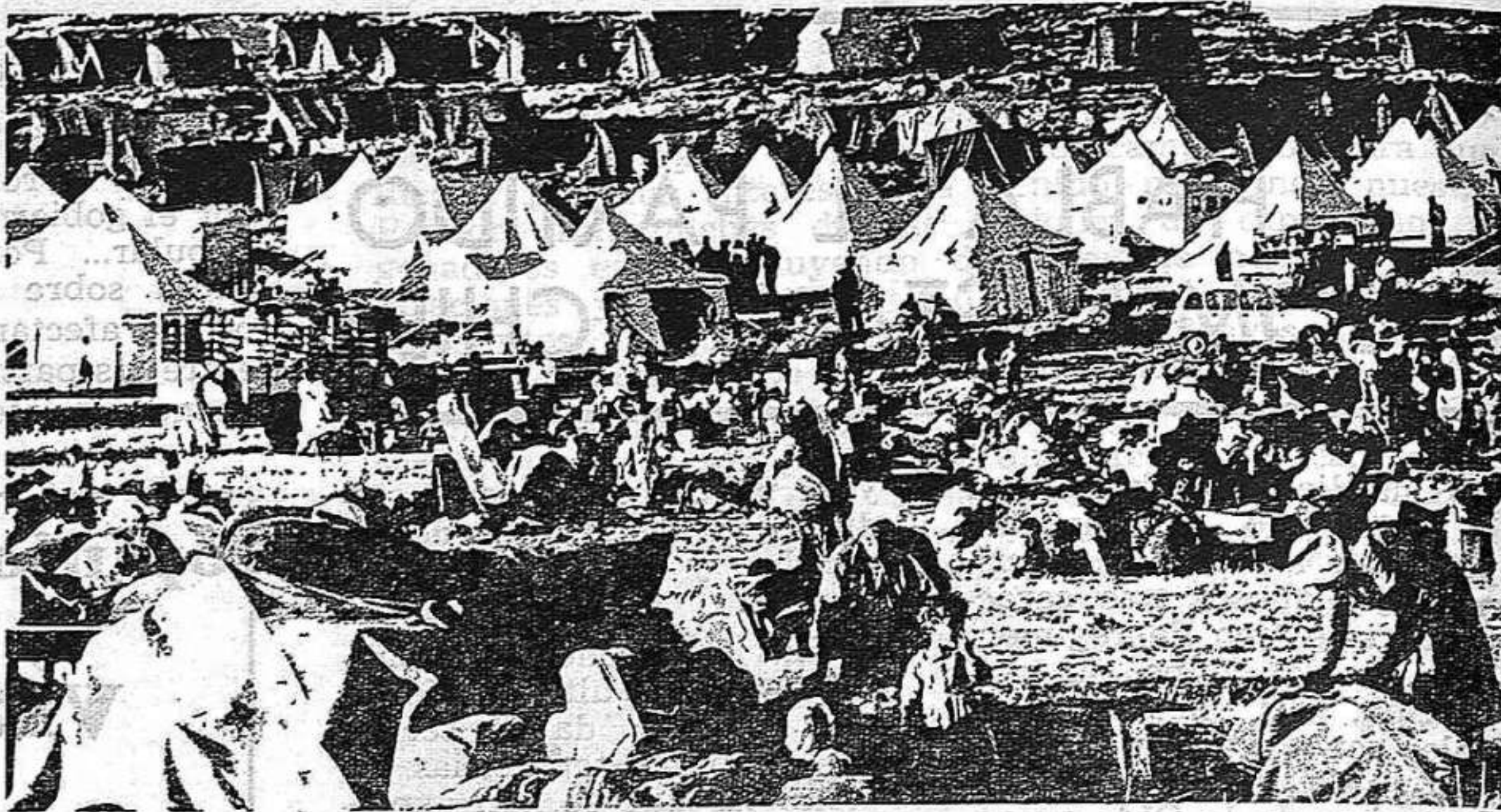
No habrá paz justa en tanto los palestinos no tengan más suelo nacional que los campamentos en la arena.

22 octubre. El Consejo de Seguridad aprueba (con abstención china) la resolución 338, que ordena el alto el fuego , cuyo proyecto ha sido presentado conjuntamente por la URSS y los EE.UU. Cuarenta y ocho horas más tarde las fuerzas de Israel habían aprovechado el «alto el fuego» (de los egipcios) para ampliar la zona de territorio que ocupaban ya el 22 en la orilla occidental del Canal de Suez. Y cuanto Egipto —y la URSS— reclaman la adopción de medidas efectivas para poner término a la violación por Israel de la resolución del Consejo de Seguridad, el presidente Nixon proclama el «estado de alerta n° 3», cubriendo así la operación de las tropas de Dayan bajo la protección del paraguas atómico norteamericano.