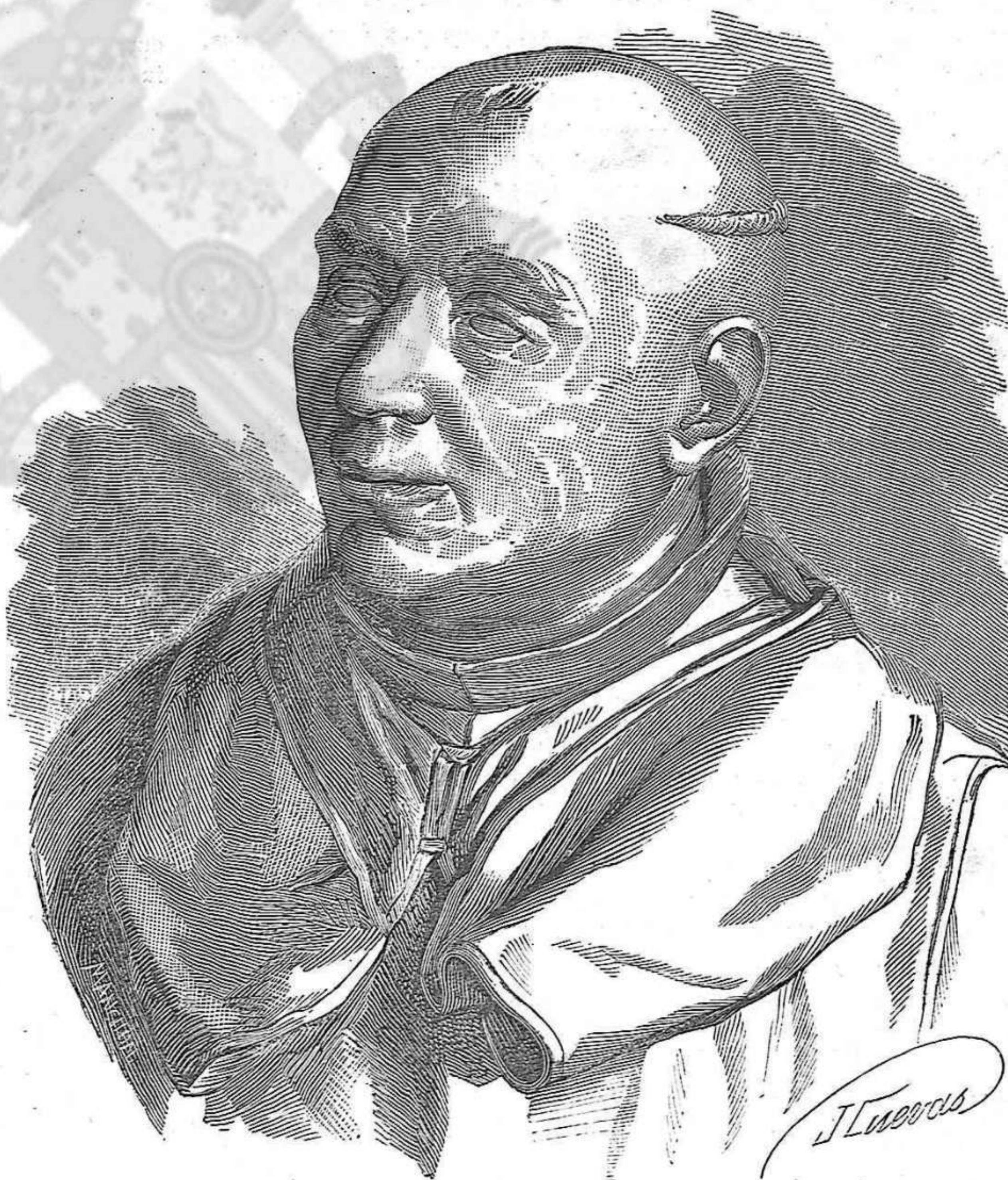
EL PADRE SARMIENTO

(Copia de una escultura del célebre artista gallego Felipe de Castro)