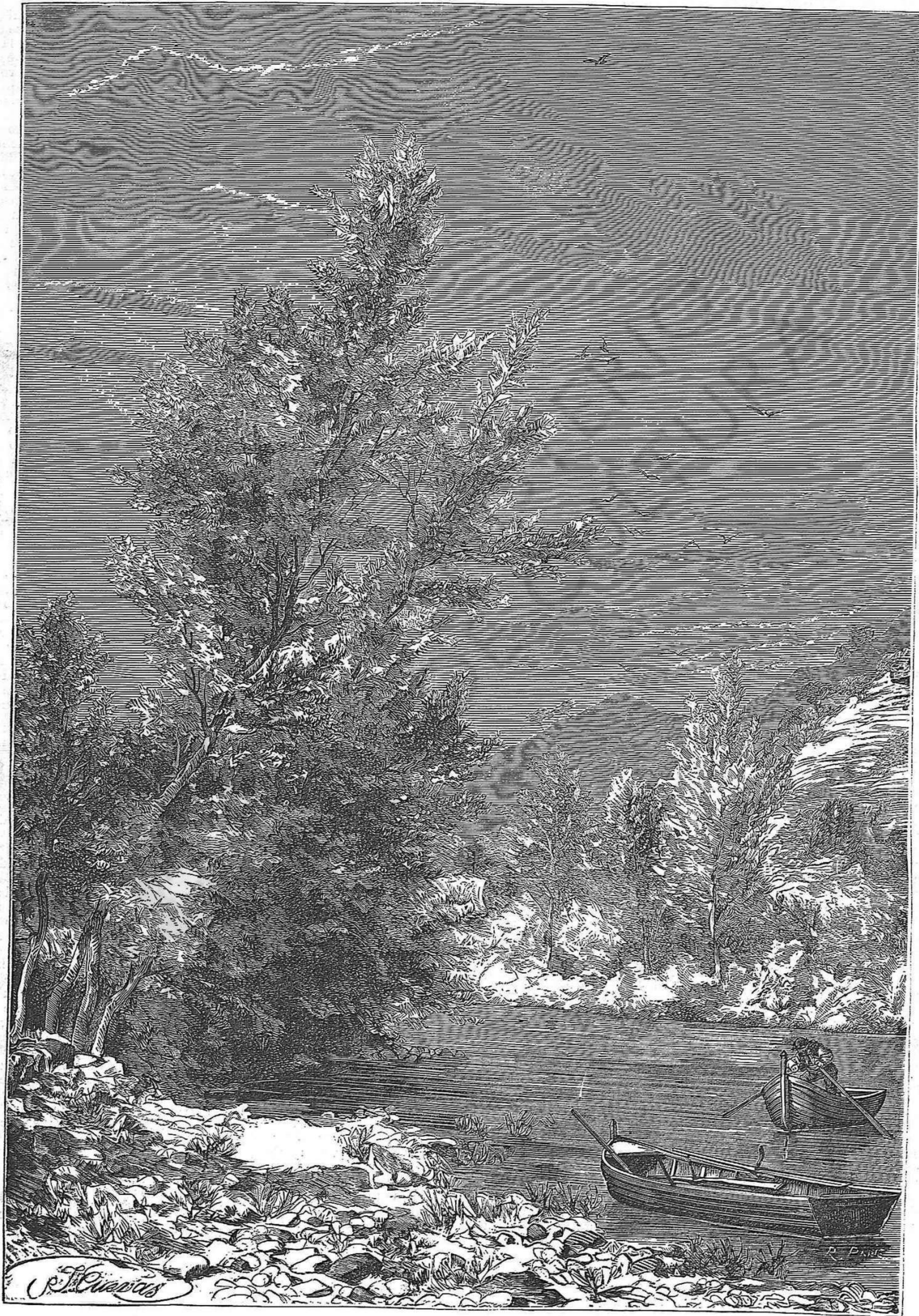
RIBERAS DEL NALON