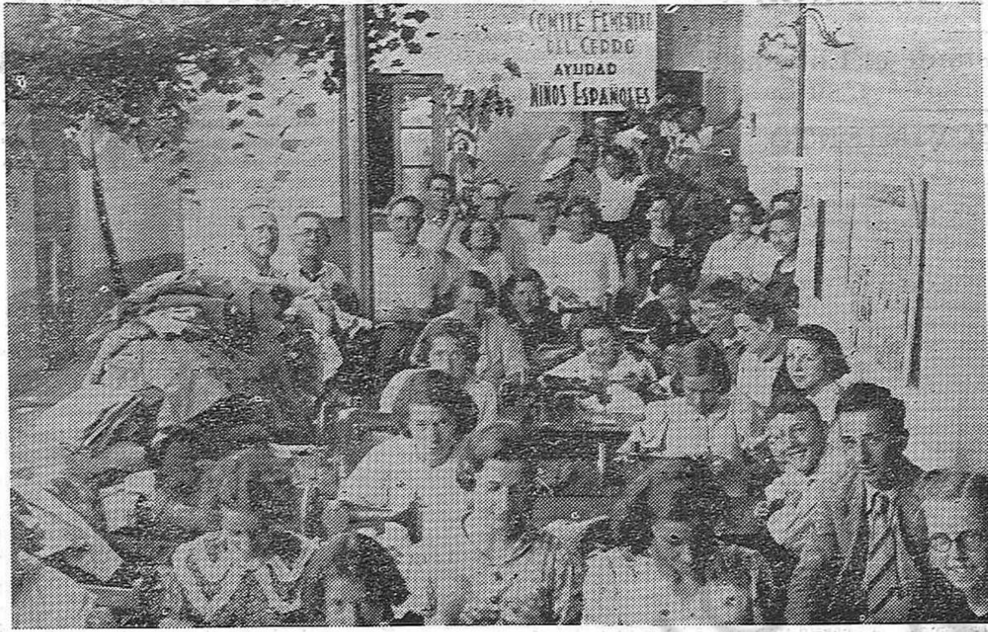
El pasado domingo el Comité del Cerro, realizó el día del "Sacrificio de todo por España", dedicado a realizar un supremo esfuerzo para reparar gran cantidad de ropas destinadas a la República. Entusiastas mujeres, pasaron el día laborando en la costura, con máquinas cedidas por los simpatizantes de las barriadas. La foto nos muestra un momento de intenso trabajo.