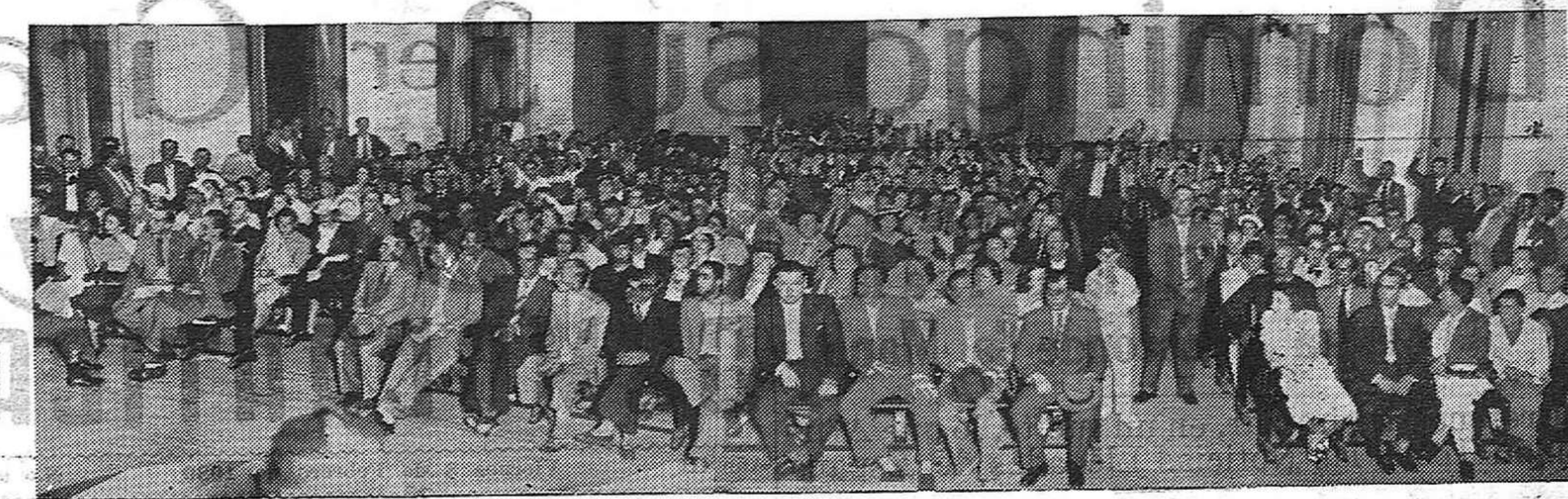
Vista de la numerosa concurrencia que asistió a la asamblea de delegados de los Comités de Barrio el sábado en los salones del Ateneo y en la cual se resolvió la realización de la manifestación de hoy