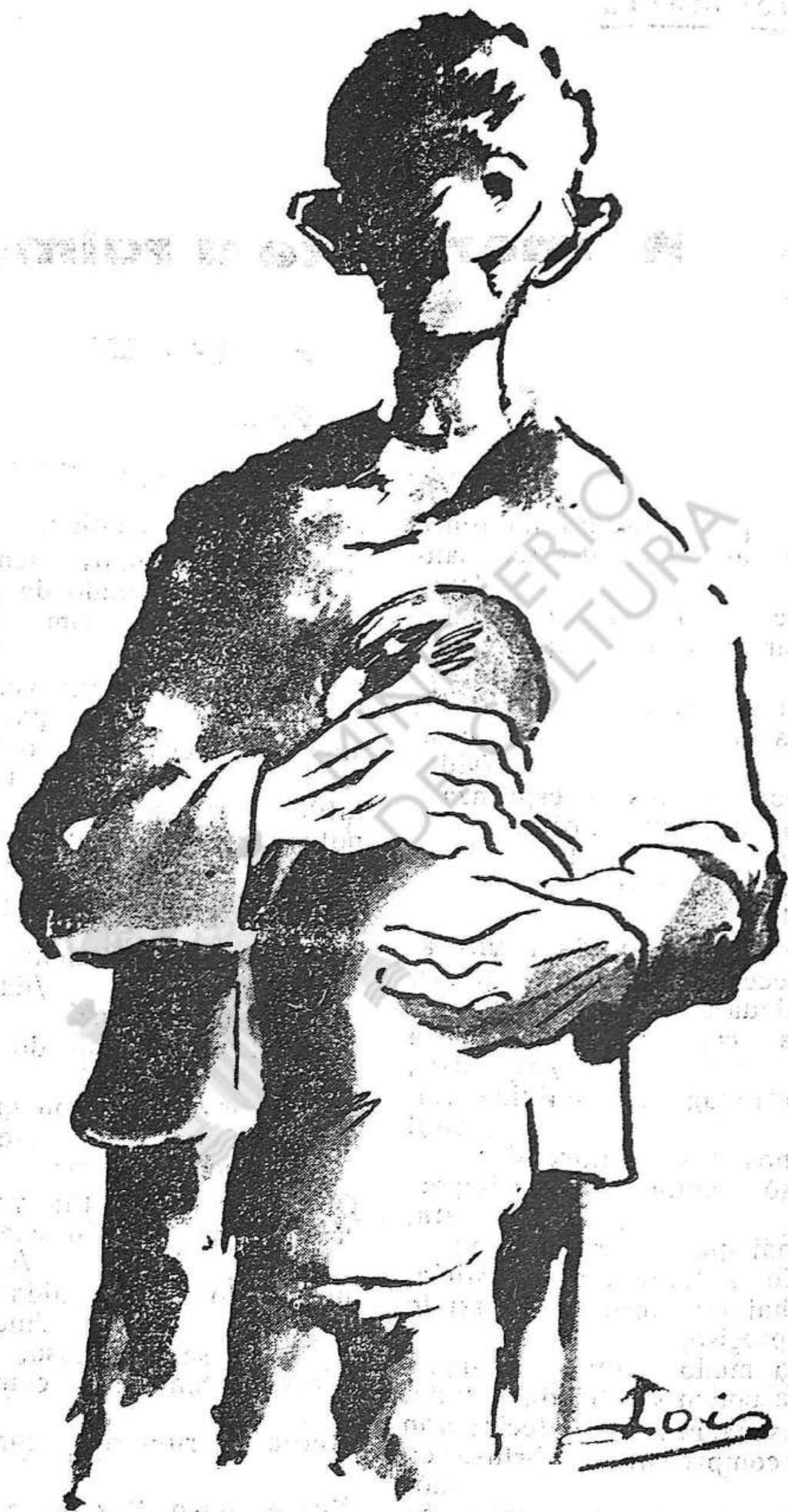
Dibujo de Lois