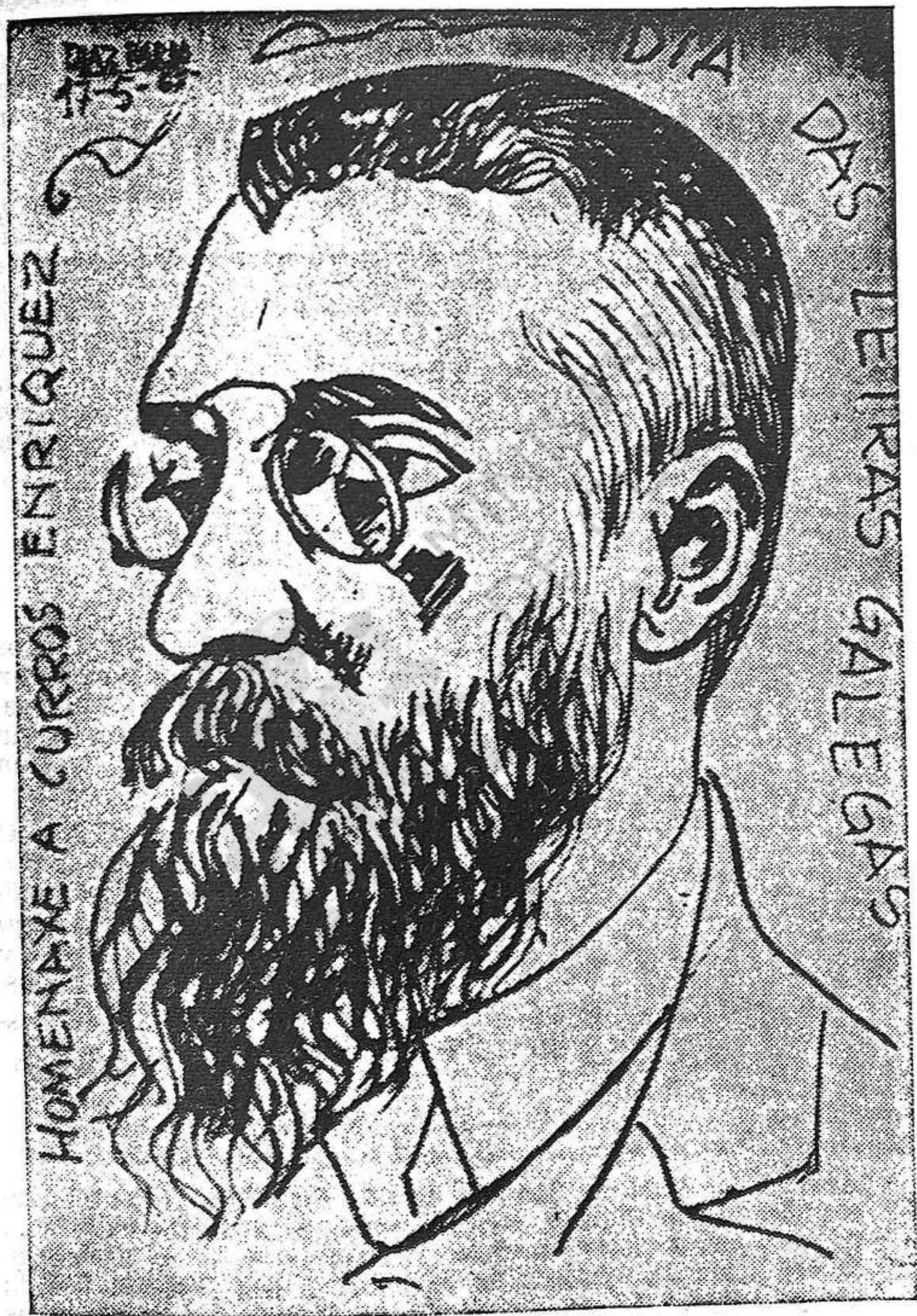
Curros Enríquez.— Dibujo de Díaz Pardo

Curros está vixente aínda; o velehi que Curros sexa pra os poetas i escritores galegos un exemplo permanente.