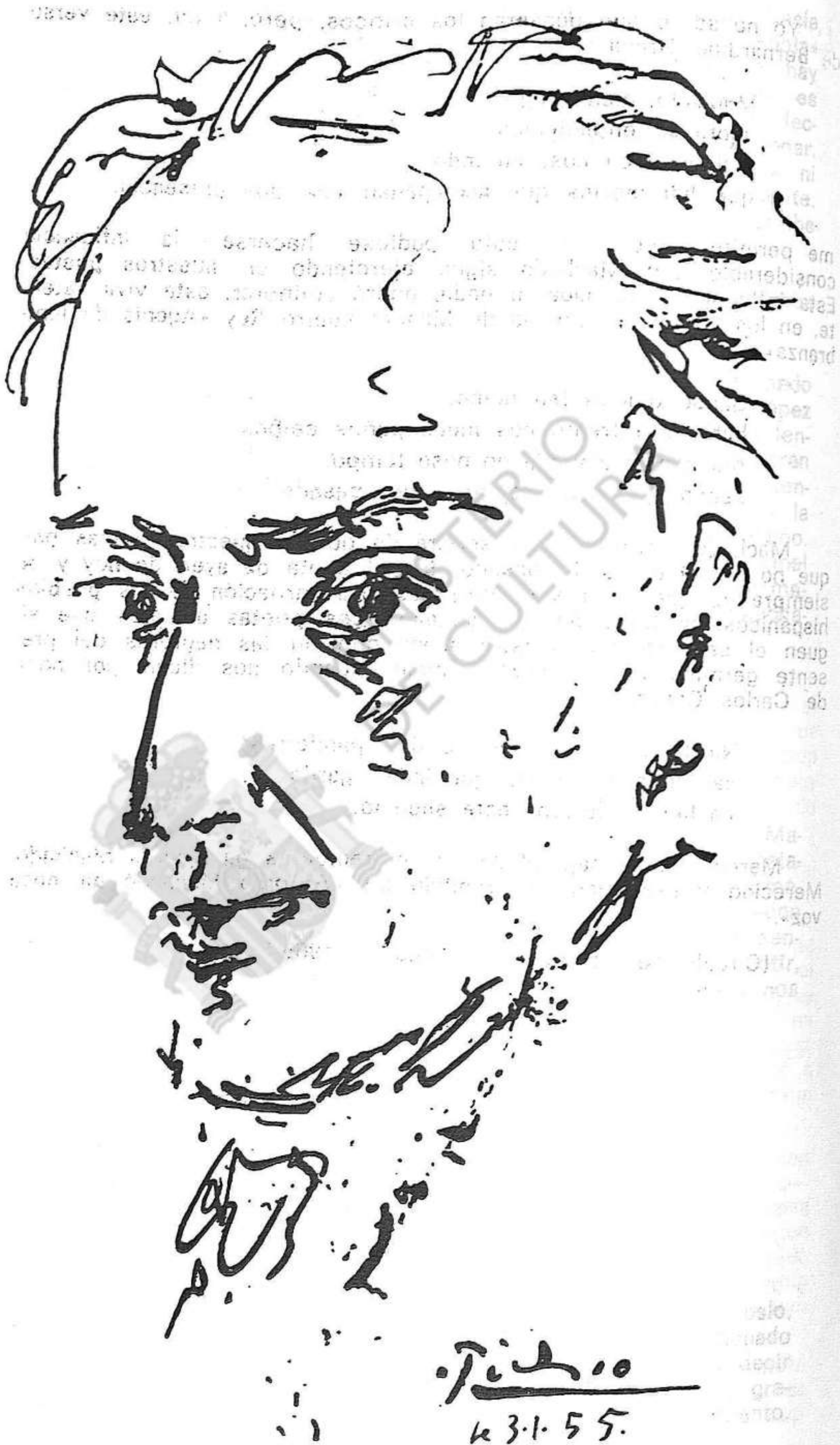
Antonio Machado, por Picasso.