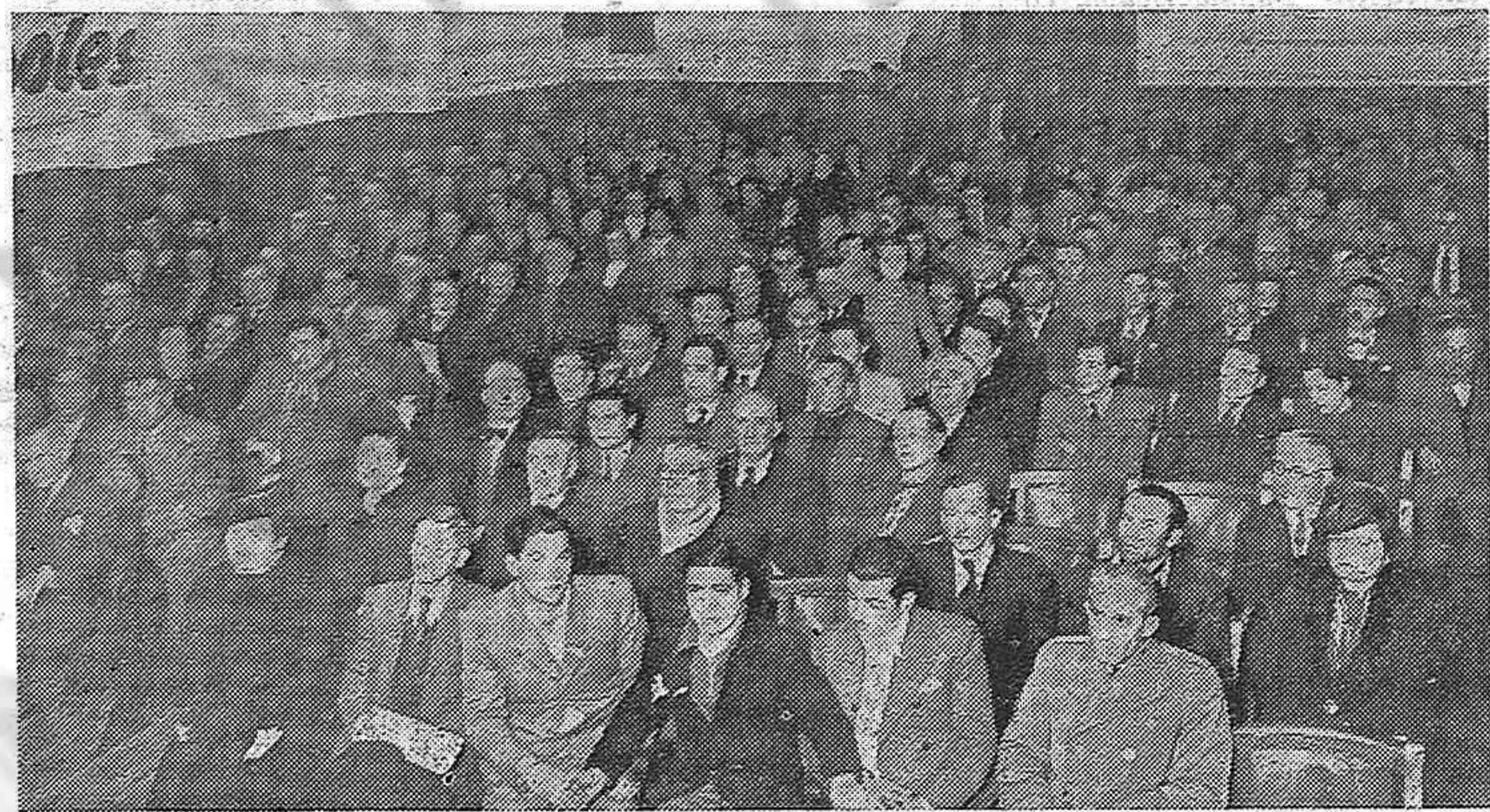
LA SALA DE LA ASOCIACION ESPAÑOLA congregó a varios centenares de personas que tributaron un estuasiasta homenaje a Chile. Los partidos del Frente Popular y los y los leaders de los partidos que lo integran fueron allí aclamados por la ciudad uruguayo