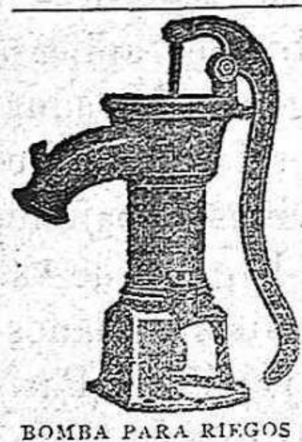
BOMBA PARA RIGOS

Construye prensas de todas clases, pisadoras para uva y artículos para bodega.