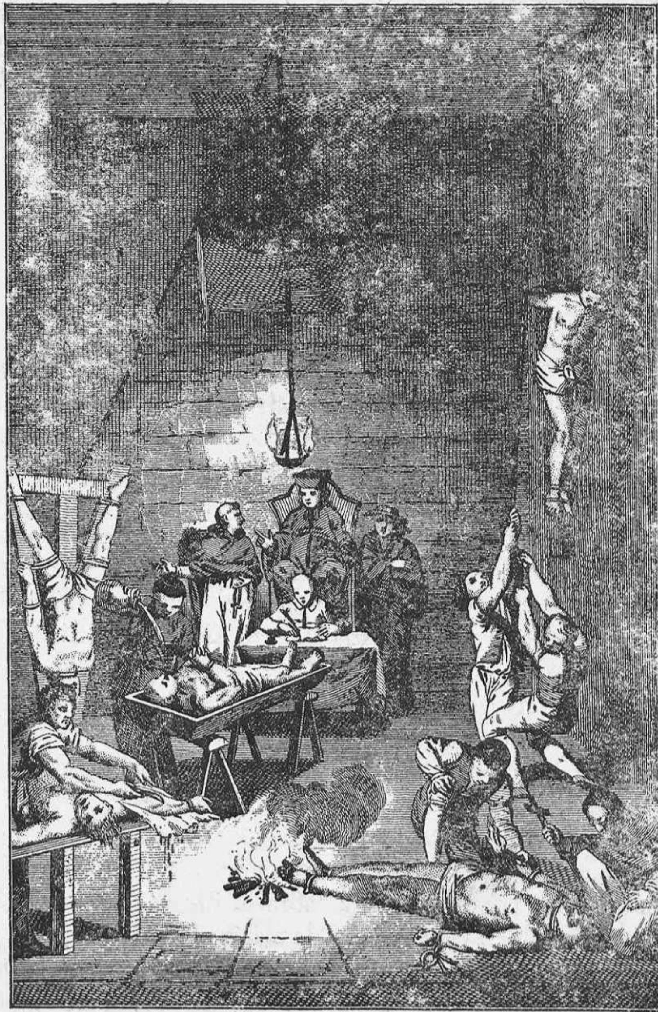
Como actuaba la Santa (?) Inquisición.

Para que los desgraciados mártires declarasen, los sometían a la tortura del fuego, de la puela, del potro, de la cruz y del agua. ¡Con estos medios criminales actuaba la Inquisición en España!