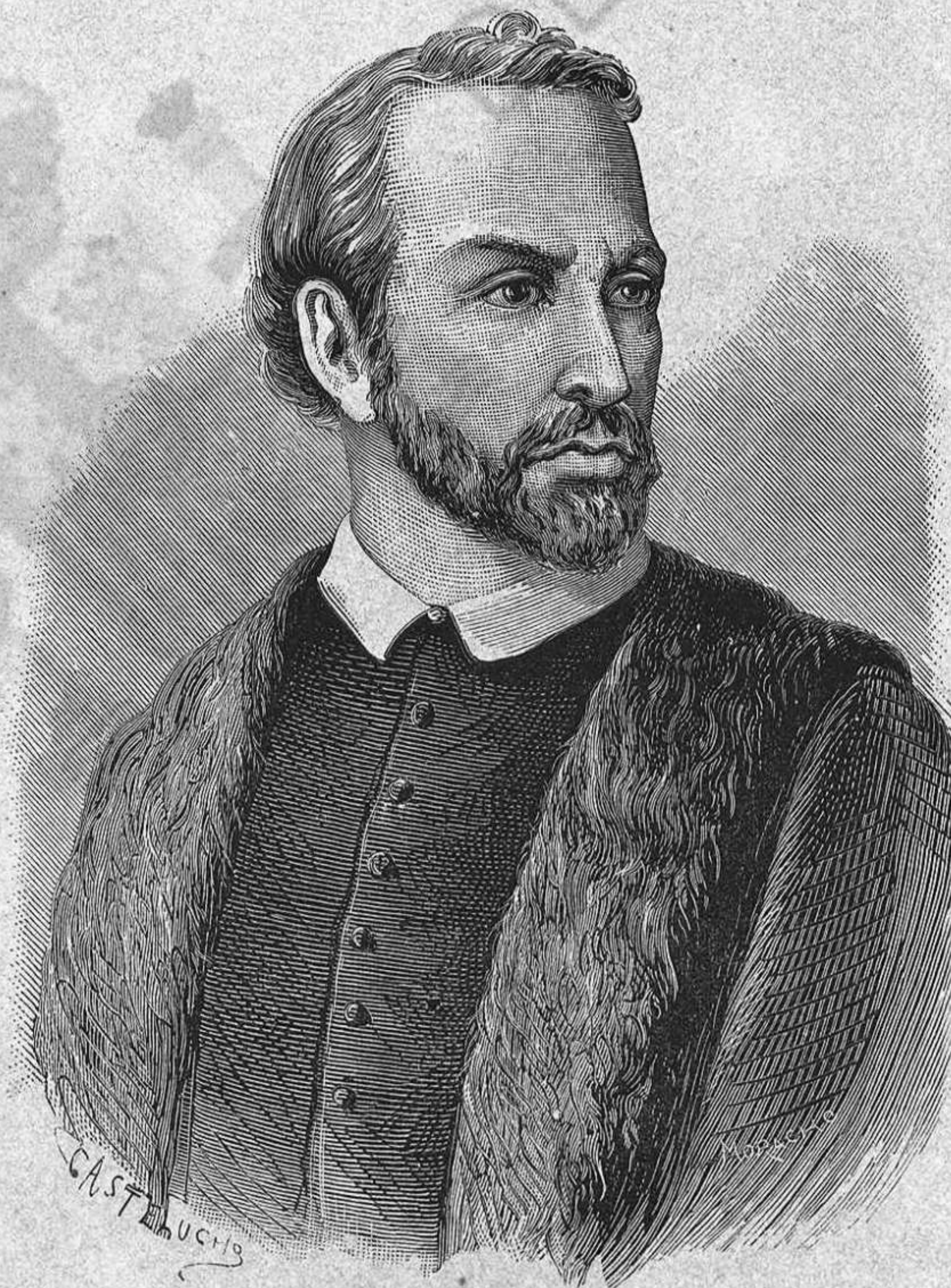
LO CANONJE EN PAU CLARÍS