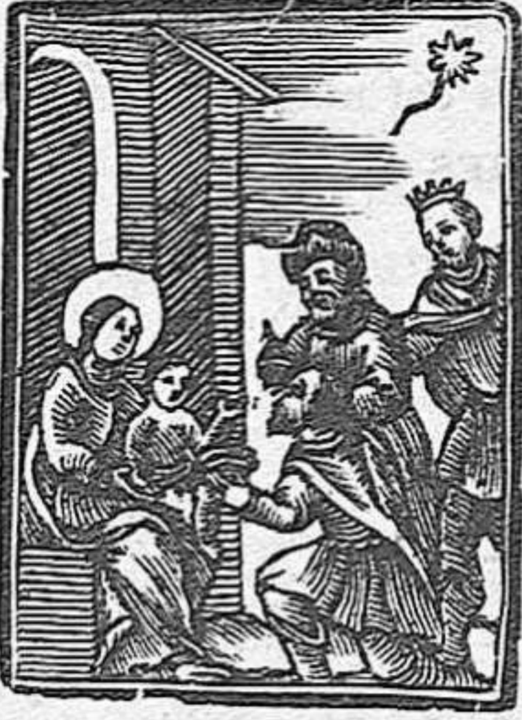
FESTA DE PRECEPT

Doble de 1. a classe amb octava privilegiada de 2on ordre. Ornaments blancs