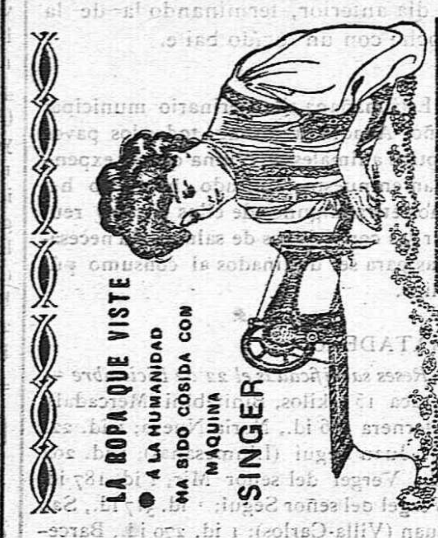
LA ROPA QUE VISTE A LA HUMANIDAD HA SIDO COSIDA CON MÁQUINA SINGER

Se hacen toda clase de escritos a máquina, y toda clase de copias de documentos. Trabajos económicos. Tipo de escritura lo más moderno que se conoce. Encargos en el Ateneo Popular.