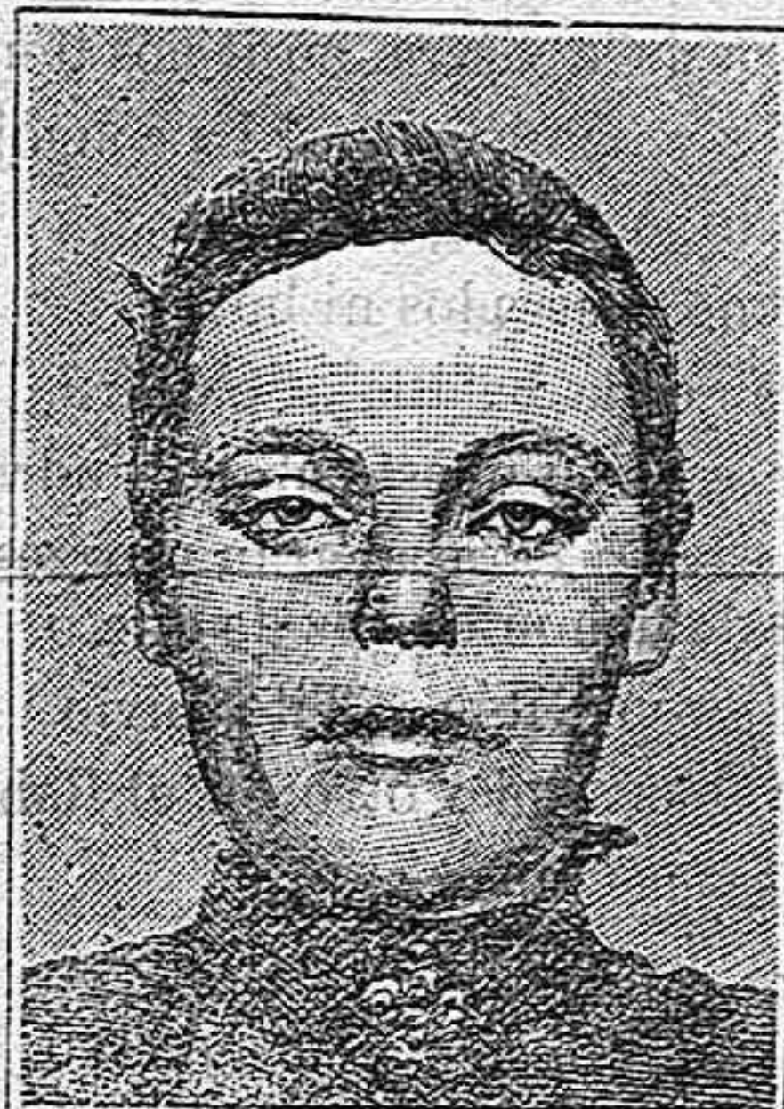
Antes de curación