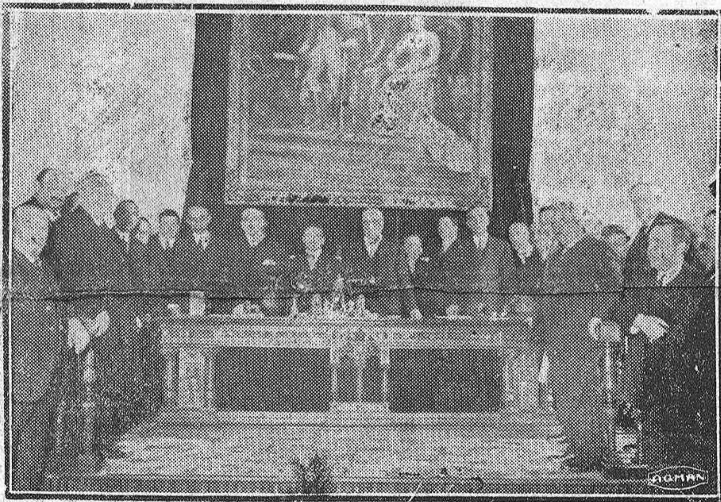
DE LA ASAMBLEA DE ESTA MAÑANA.—A las doce y media dió principio la Asamblea triguera que para hoy estaba anunciada en la Diputación

Mañana hablaremos sobre extremos tan importantes.