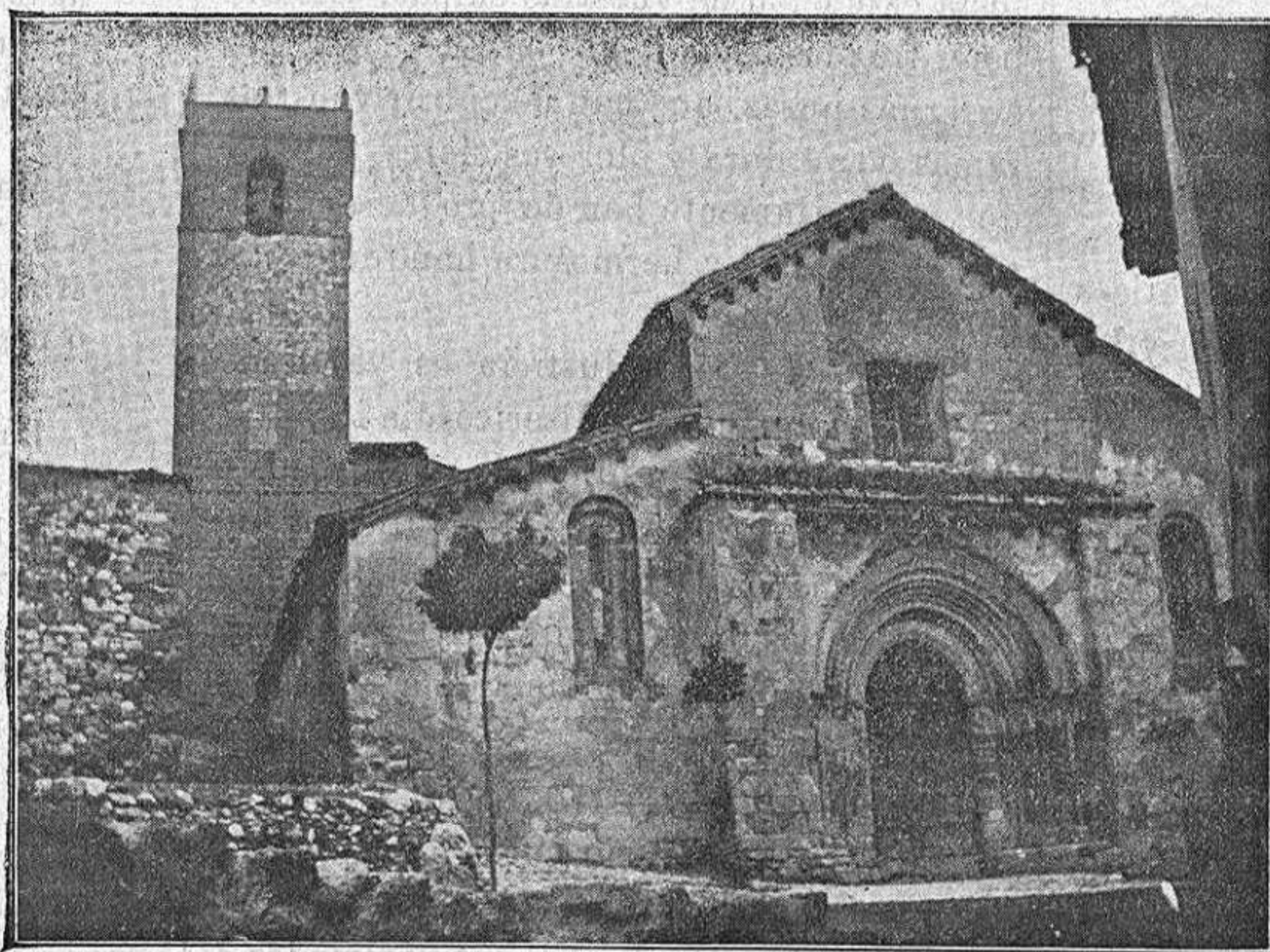
Brihuega.—Iglesia de San Miguel