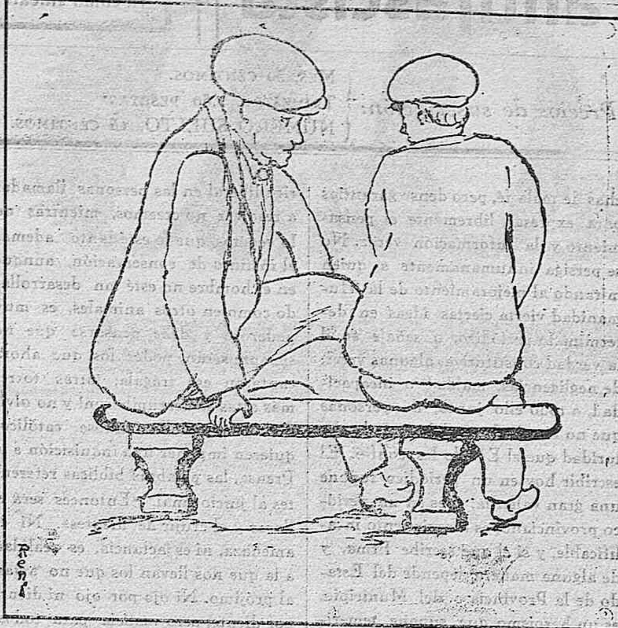
—No te apures, hombre. Gil Robles nos dará trabajo...

que represente a la Comisión gestora en la Junta provincial de espectáculos.