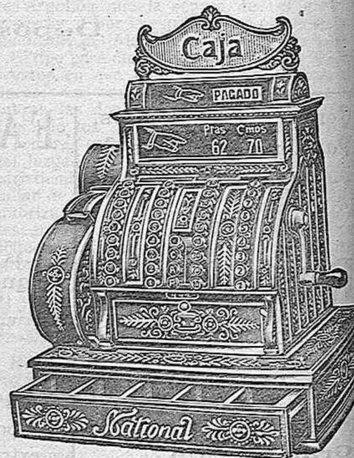
Totalizadora e impresora de cinta y ticket.