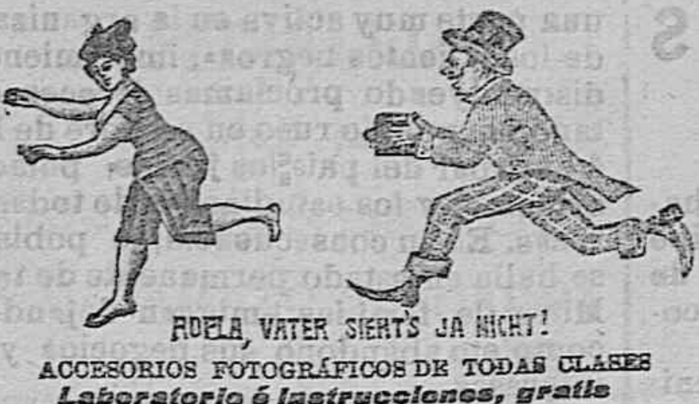
ROELA WATER SIERTS JA NIHT! ACCESORIOS FOTOGRAFICOS DE TODAS CLASES Laboratorio de Instrucciones, gratis