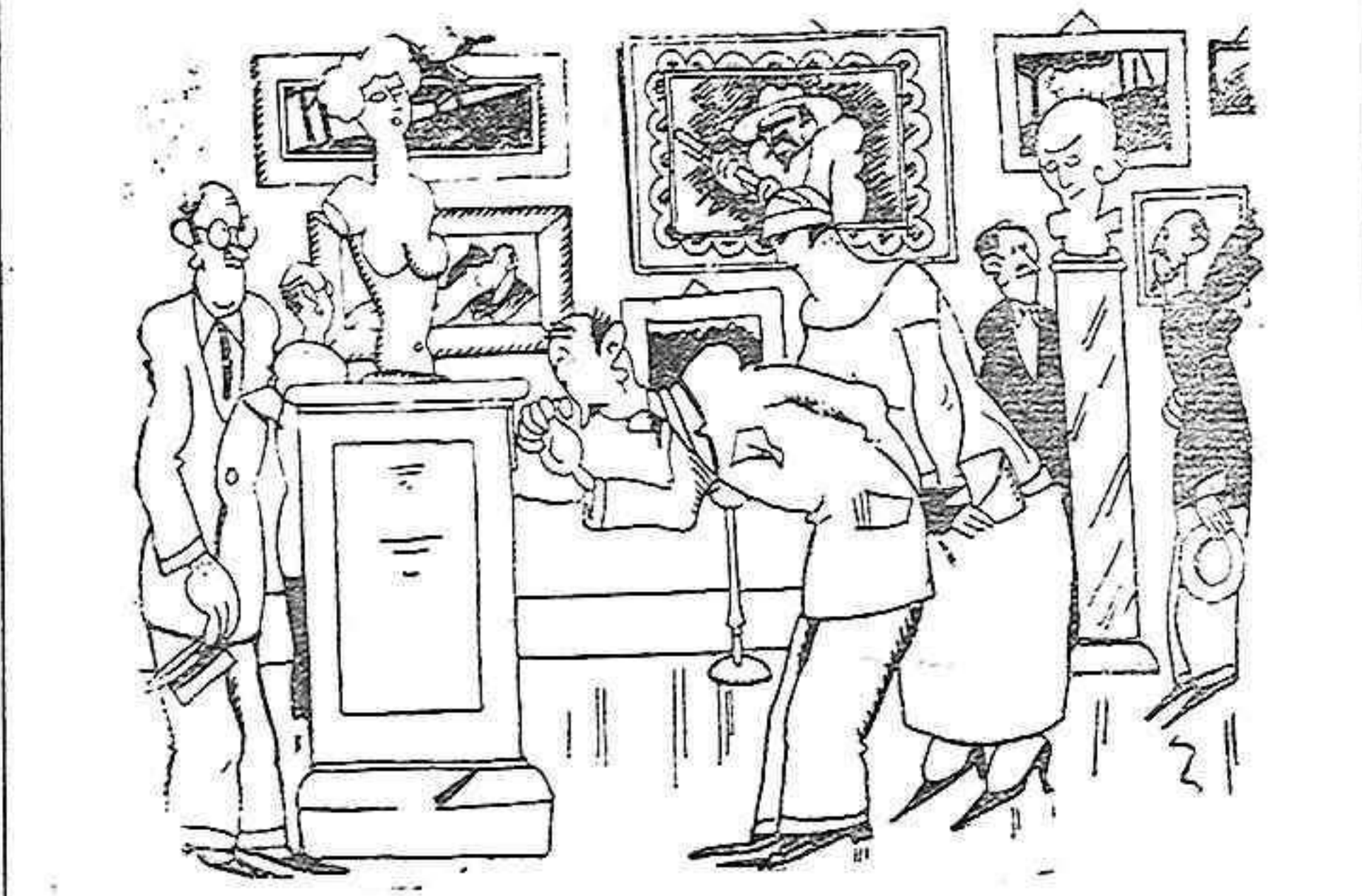
EN LA EXPOSICION

—Pues de otorgar premio, yo se lo daría a ésta. —¿Qué tiene de particular? —Nada; pero por lo menos no se puede decir que esté hecha con los pies.