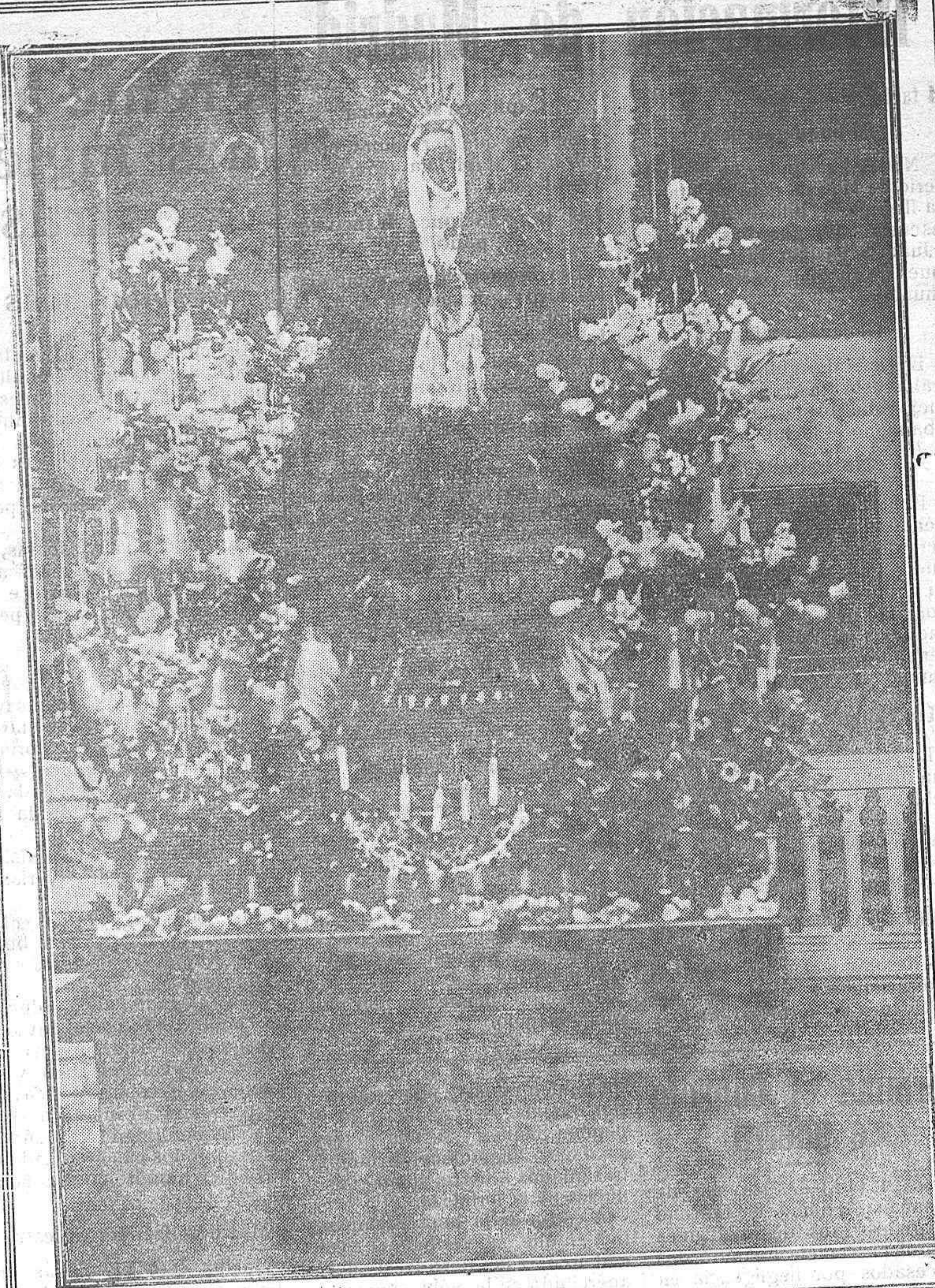
Sagrada imagen de Nuestra Señora de los Dolores, que se venera en la Iglesia de Santiago y que figurará en la procesión de esta noche