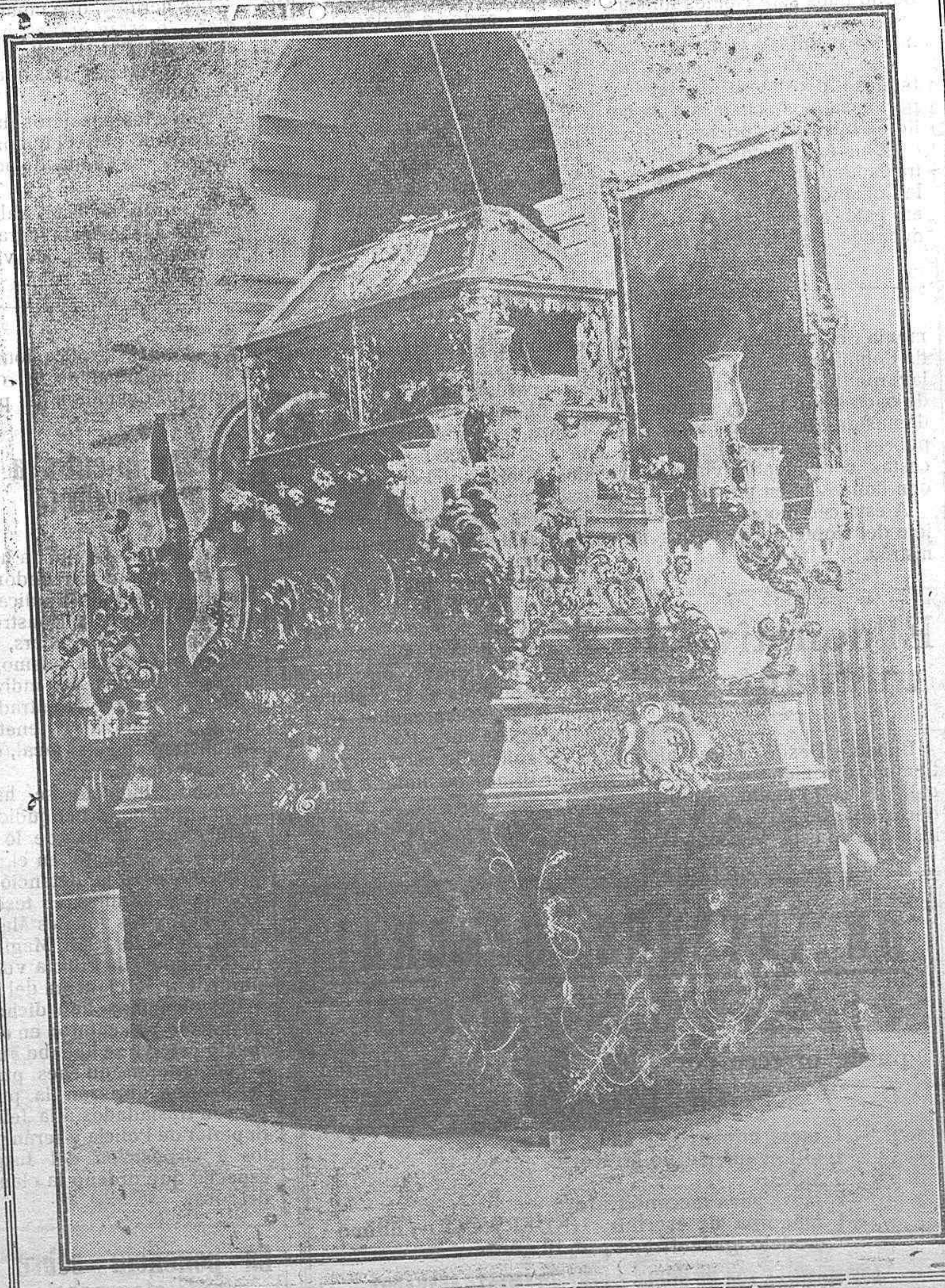
El Santo Sepulcro, que se venera en la Iglesia de San Pedro y que saldrá esta tarde en la procesión del Santo Entierro