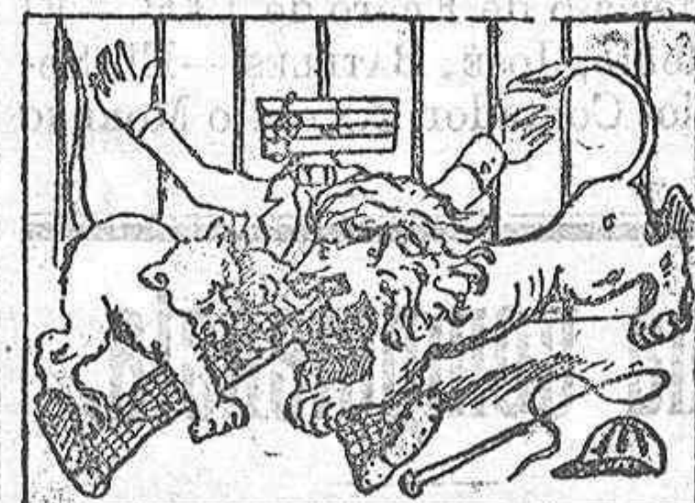
La solución mañana.