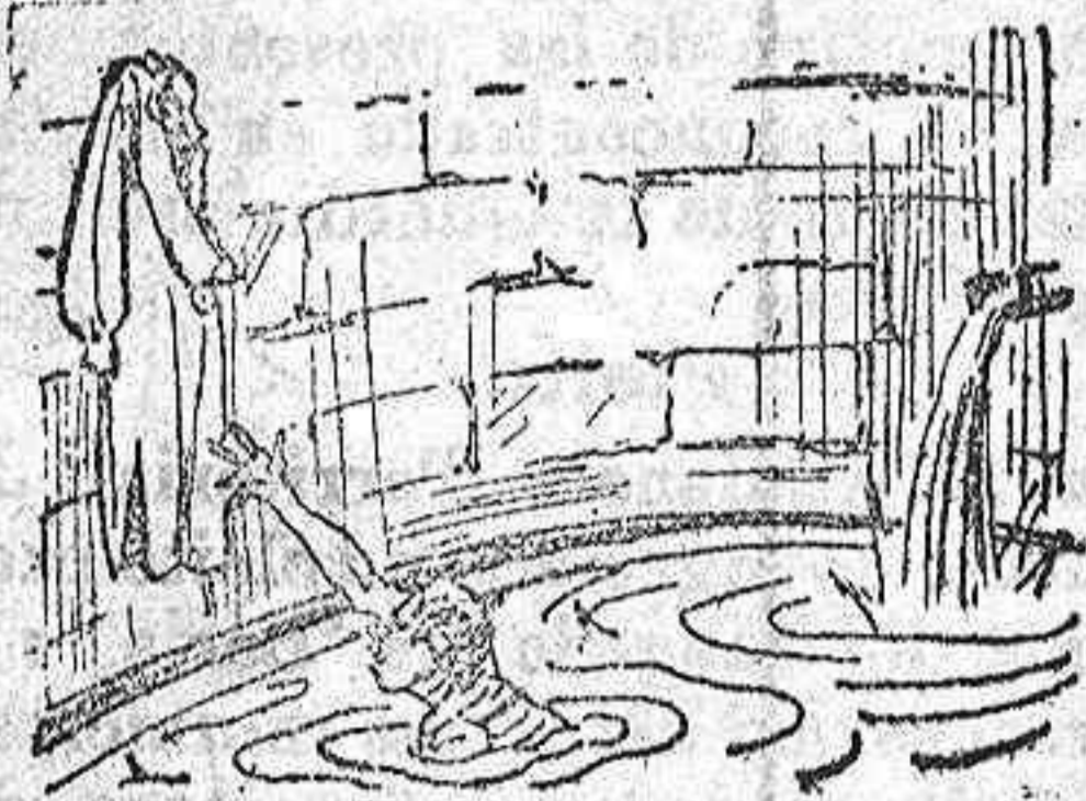
La solución mañana.

Solución á la charada en acción última: Guardacantón. FRASE HECHA