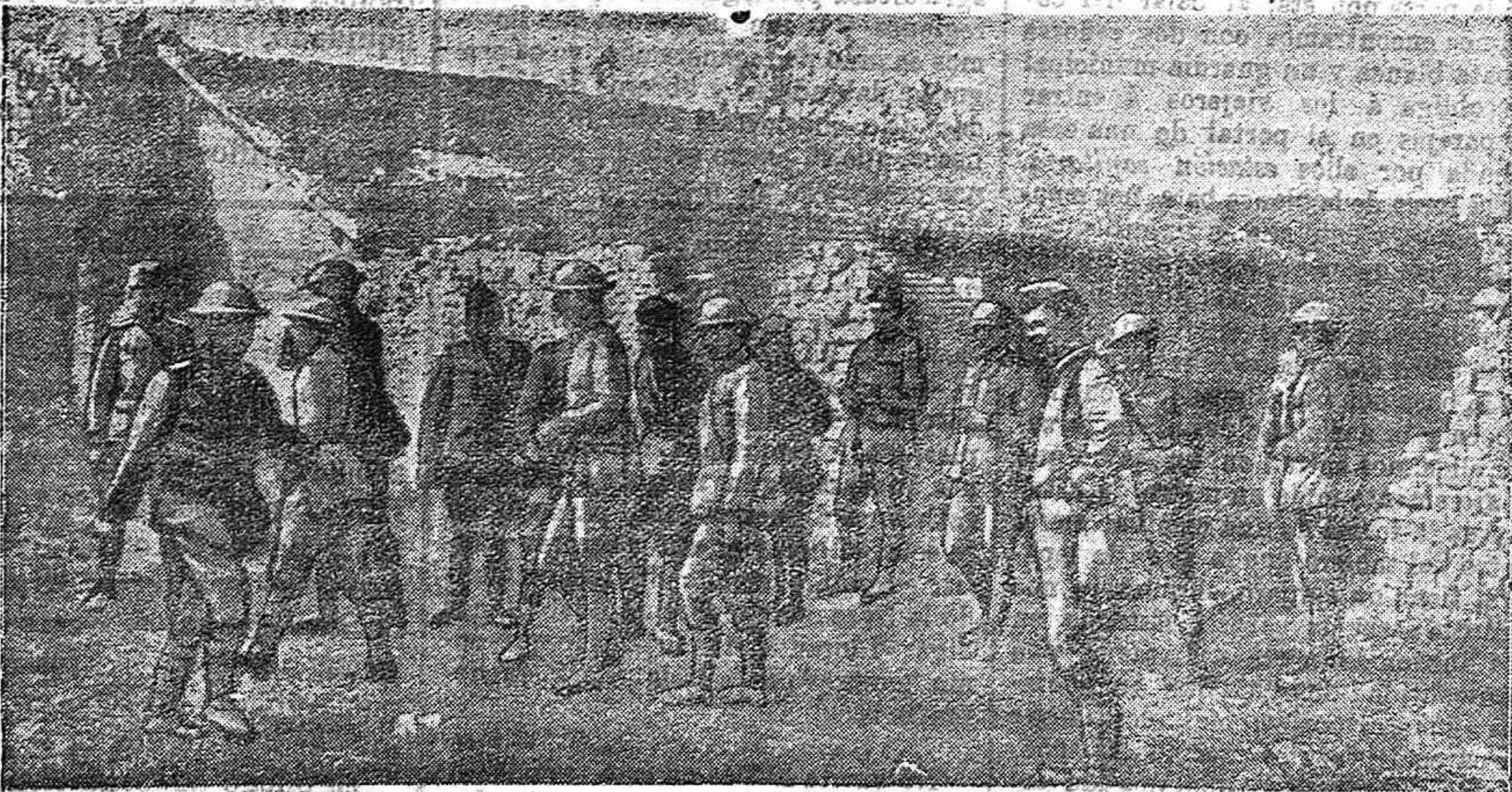
Campamento de tropas americanas.

Suplicamos a nuestros lectores utilicen preferentemente para sus compras los establecimientos que se anuncian en EL BLOQUE.