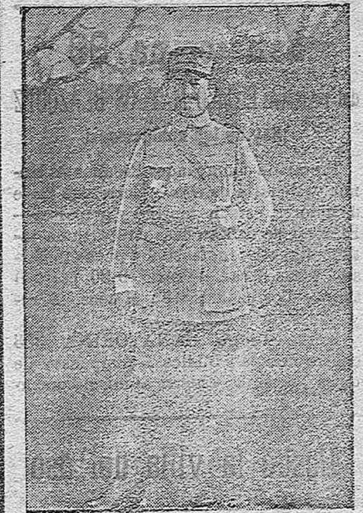
El general Mangin.

Desde estas columnas enviamos nuestro saludo efusivo al ilustre huésped, que á buen seguro emulará la gloria de sus ilustres ascendientes.