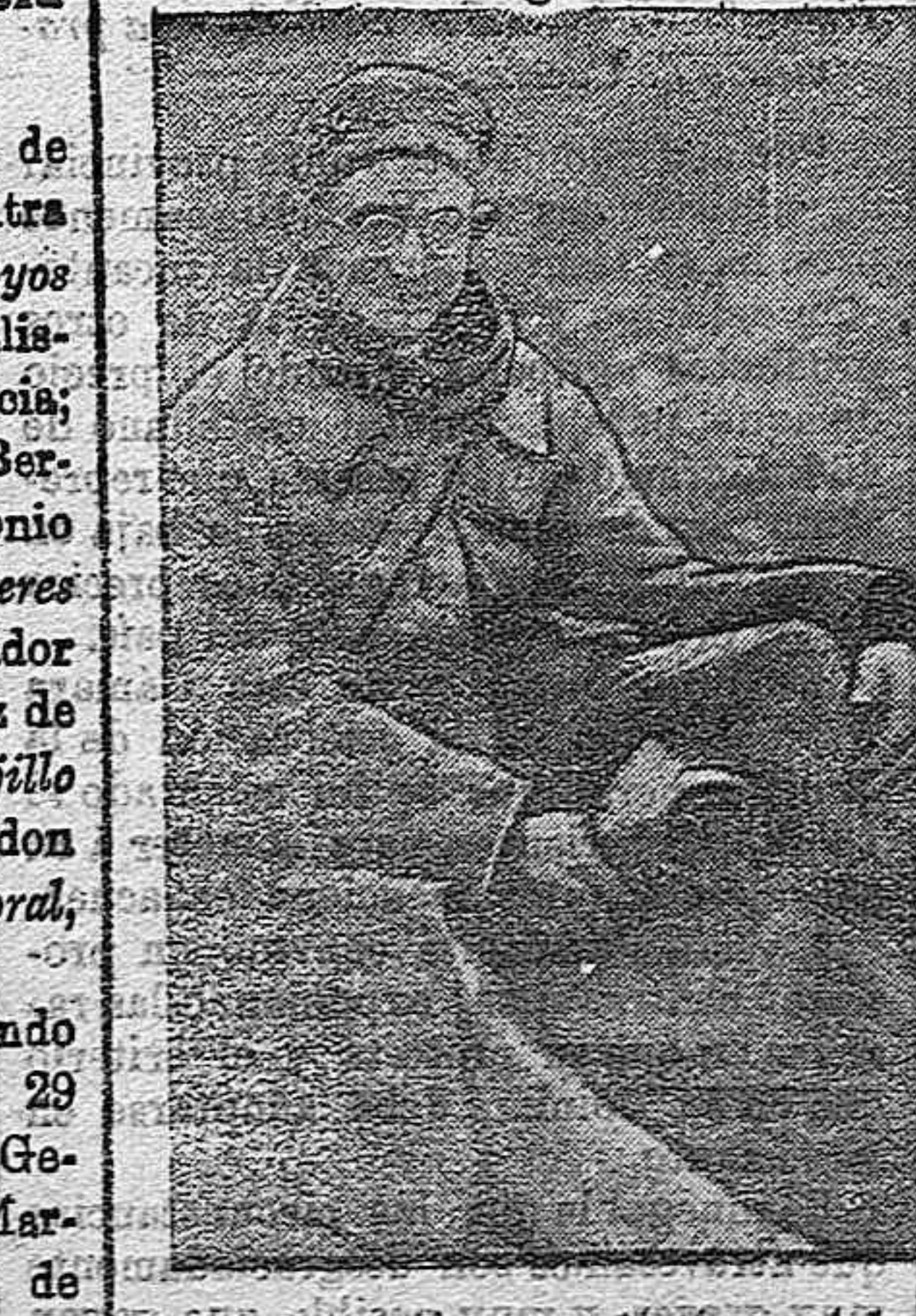
Soldado de la guardia imperial alemana, prisionero.