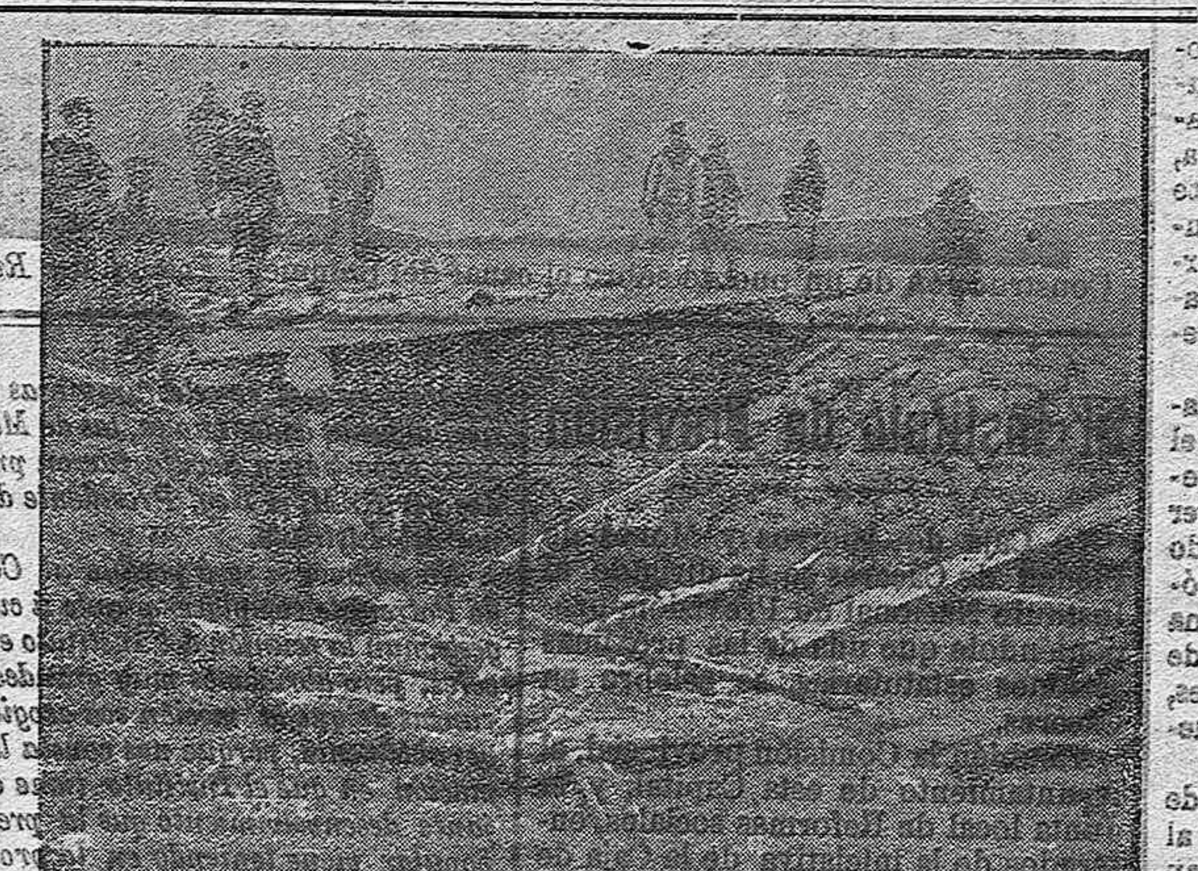
Casamata destruida en el frente de Meurthe a Mosello.