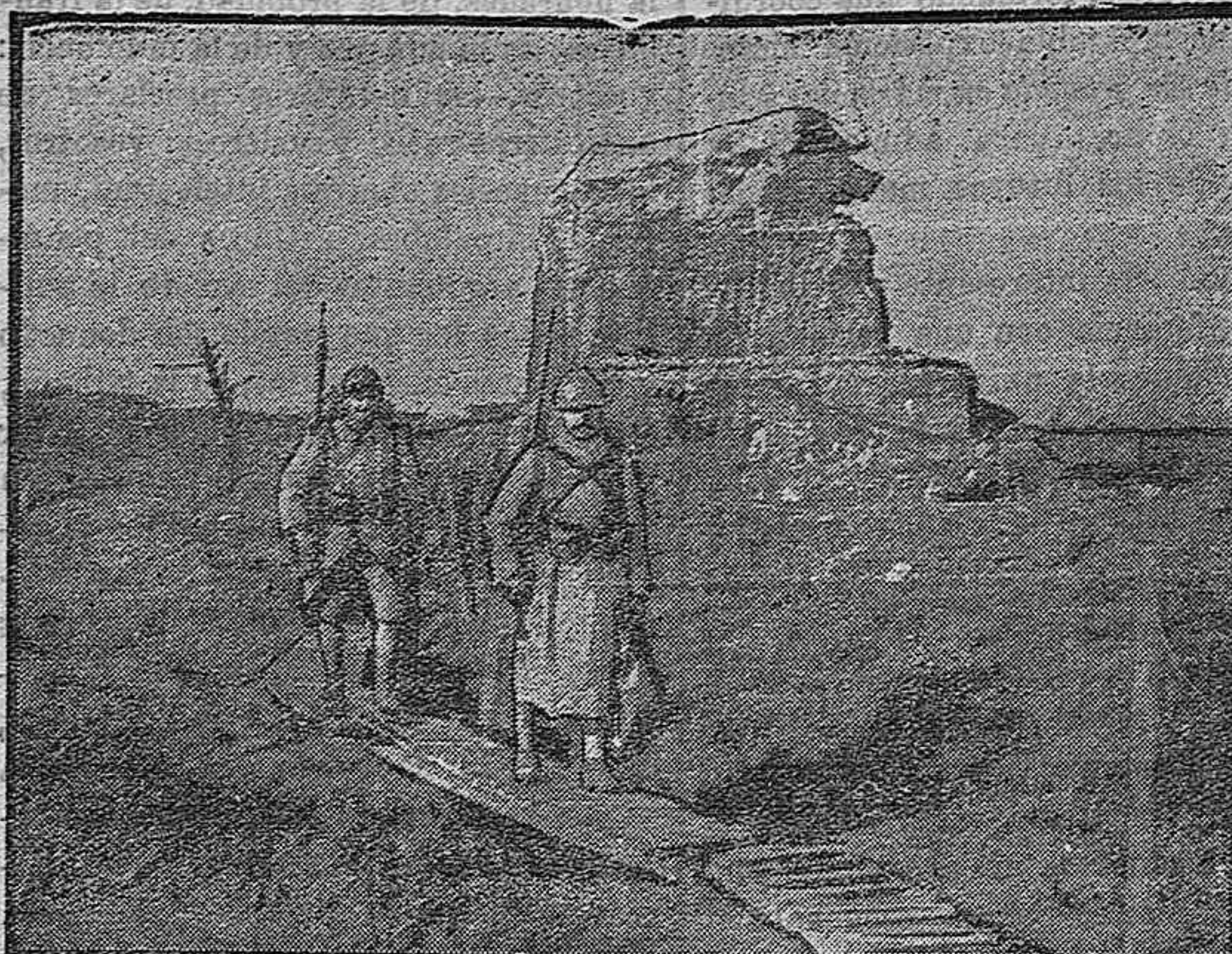
Pasarela cerca de Bixschoote.