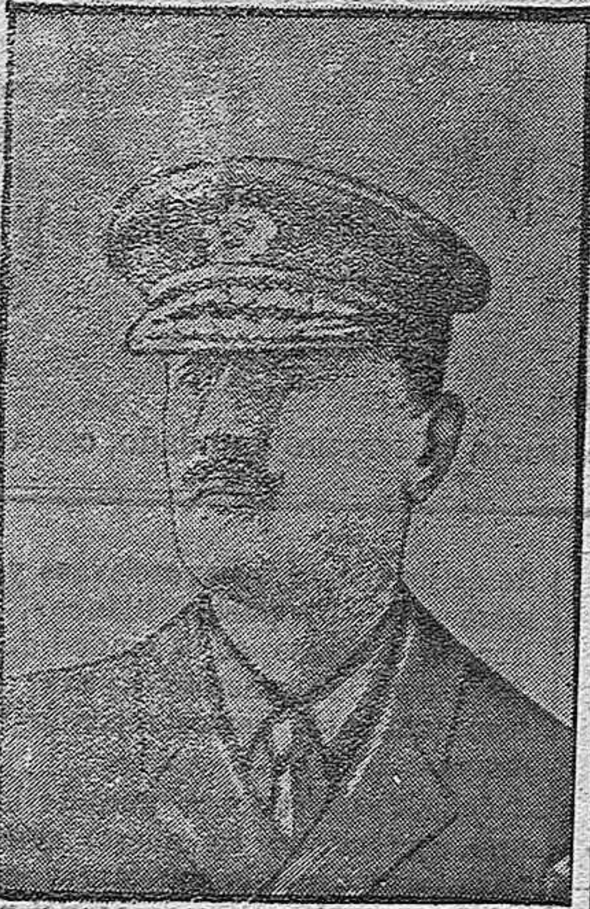
El General Alamy, jefe de las tropas aliadas que han conquistado Gaza y marcharon sobre Jerusalem.

Y que por dicha representación se proponga la elaboración del pan llamado integral, cuyas excelentes condiciones nutritivas é higiénicas son de todos conocidas, y en el cual se emplee la harina sin quitarle el salvado ó quitándole en pequeñísima proporción.