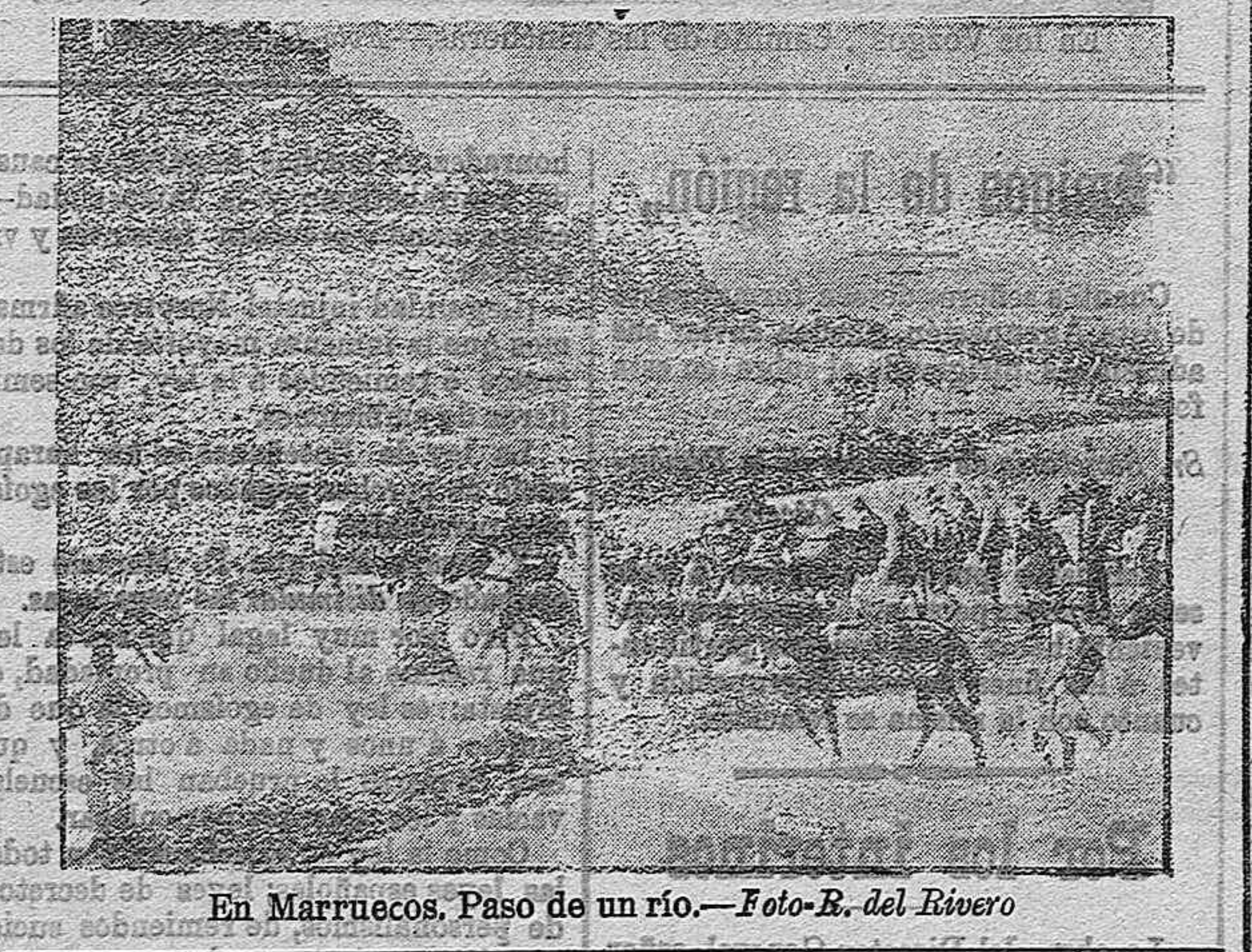
En Marruecos. Paso de un río.

Préstanse á grandes manifestaciones estas insolencias de los porteros de Madrid. ¿Para encontrar uno que sea amable hay que recorrer casa por casa, toda la villa y corte, y aún así, resulta difícilísimo. ¿Por qué—me pregunto yo—no serán amables los porteros? ¿En qué fundarán su soberbia, su desconsideración, sus pujos autoritarios? ¿Qué mal hacemos nosotros al no tener la honra