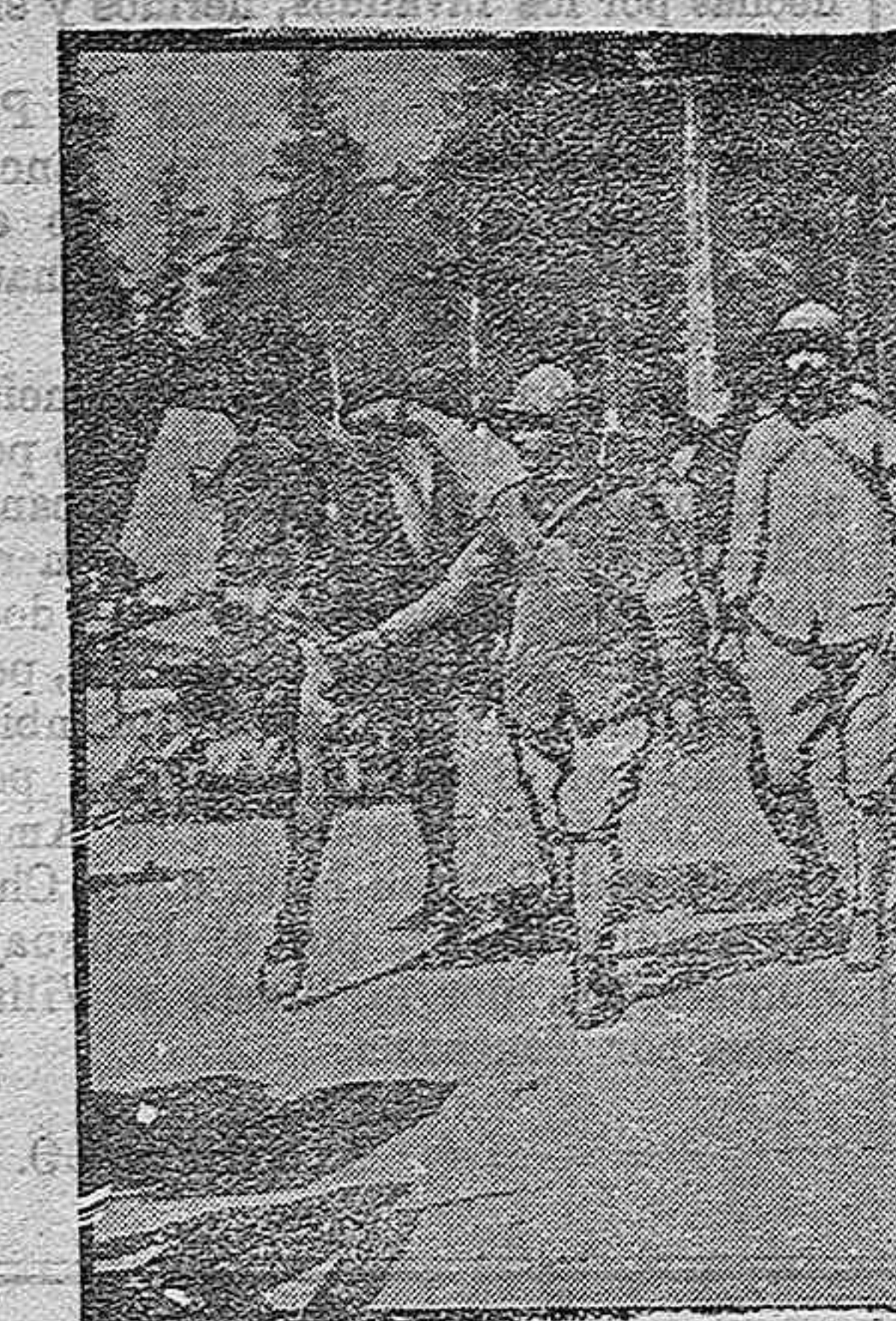
En los Vozgos. Camino de las trincheras.