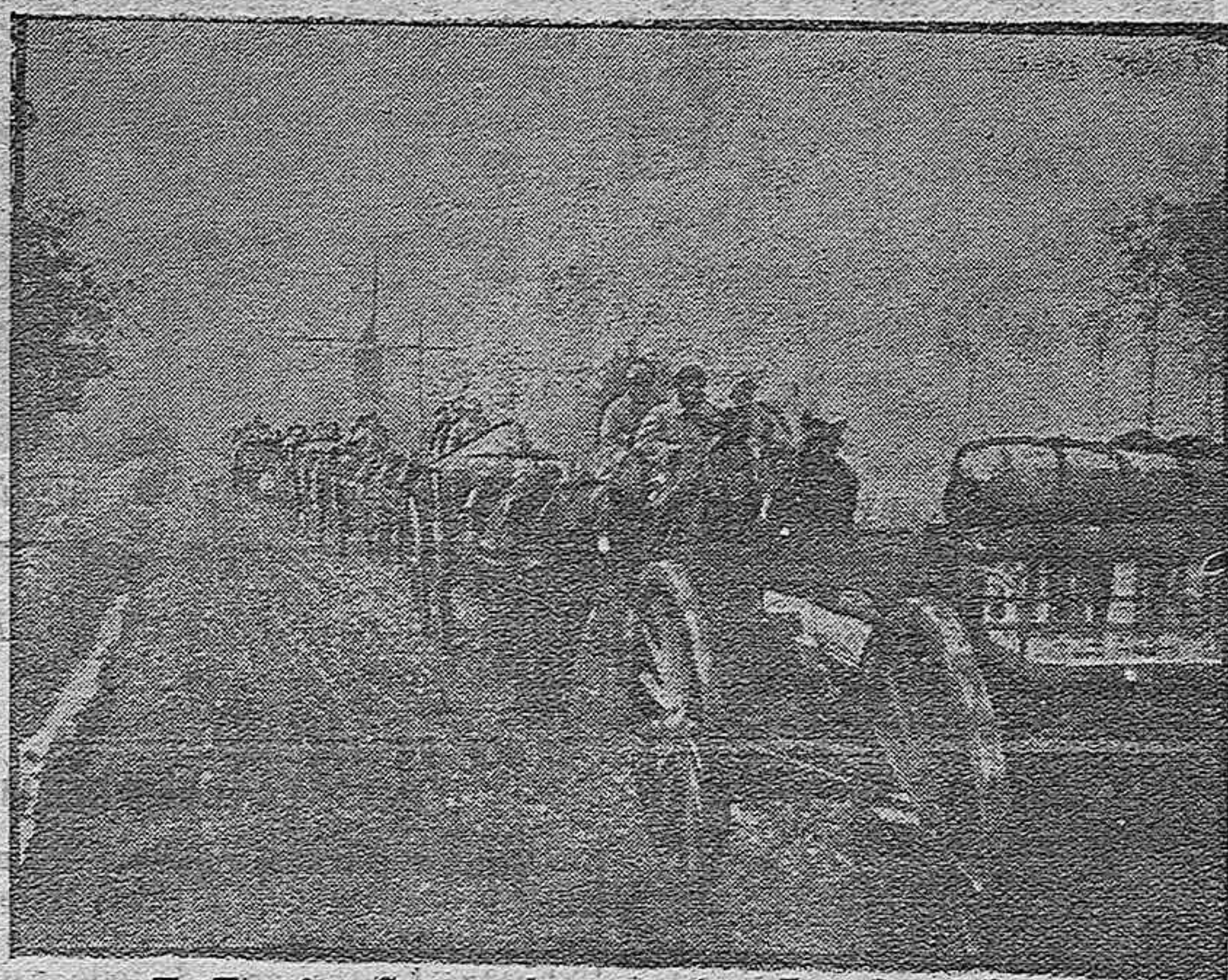
En Flandes. Convoy de artillería.