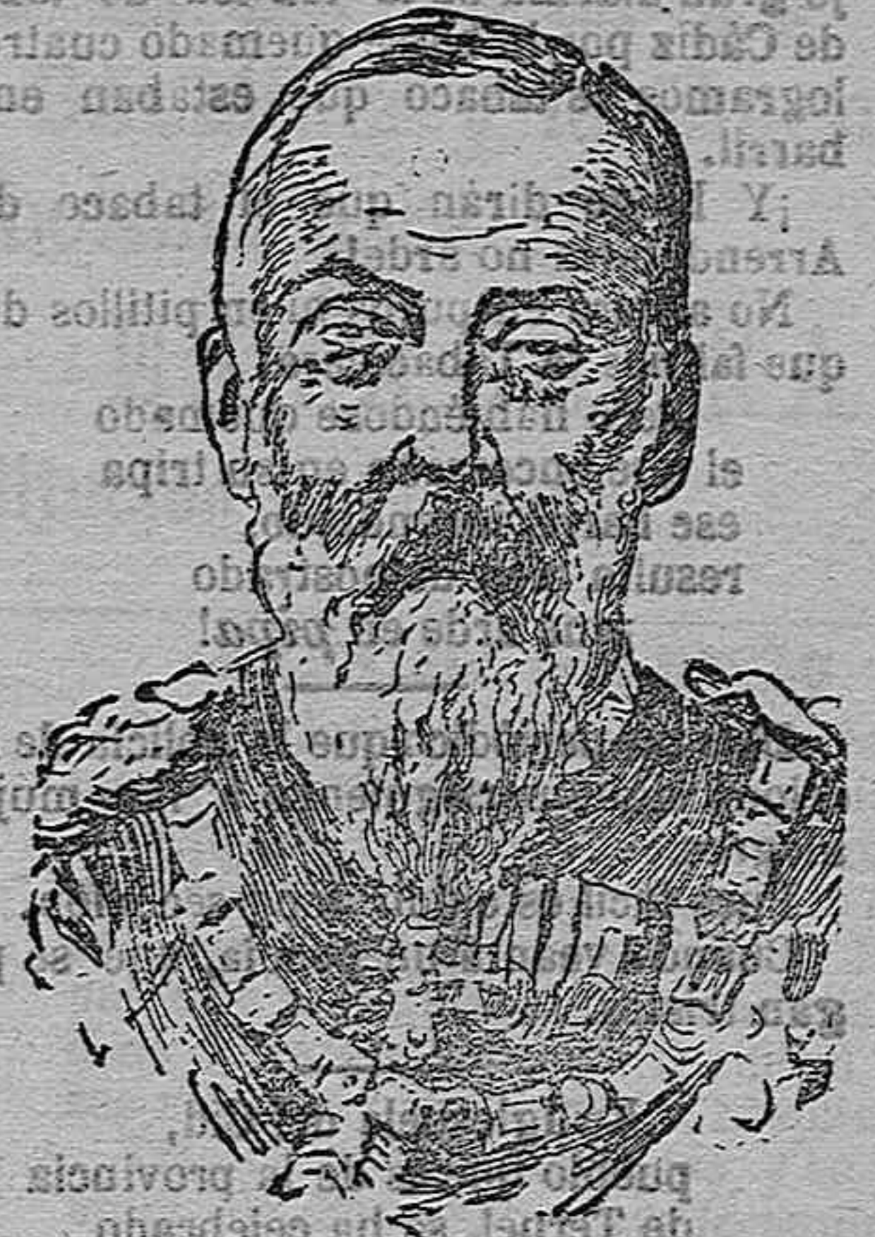
El príncipe Luitpold

El príncipe Luitpold había cumplido los 91 años en el próximo pasado Marzo, y sin embargo de su avanzada edad, con- servábase ágil y vigoroso, tanto que no hace aún muchos meses, con motivo de una cacería, dió incontestables pruebas de vigor que asombraron á sus huéspede- s. Era hijo del rey Luis y de la prince- sa Teresa de Sajonia-Altenburgo, y her- mano del rey Maximiliano.