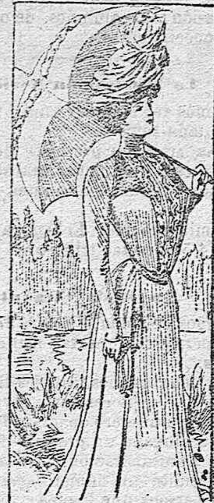
TRAJE PARA SEÑORITA.

Modelos exclusivos para nuestras lectoras de los Grandes almacenes de EL SIGLO, Barcelona