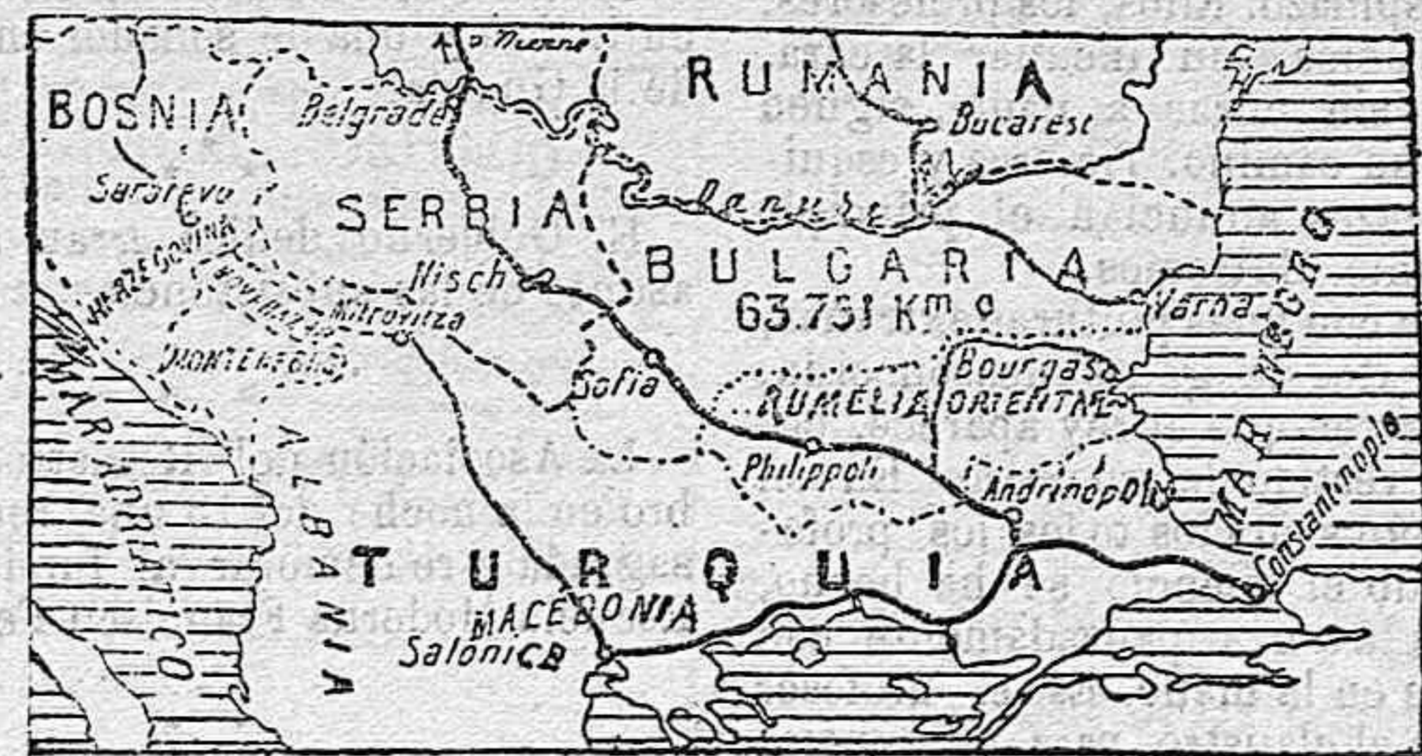
Gráfico de los balcanes