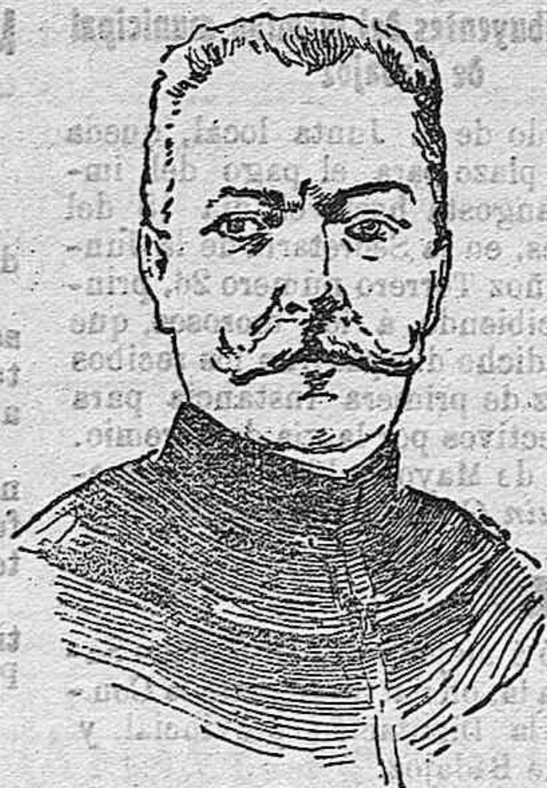
General Serrail comandante del ejército de Verdun