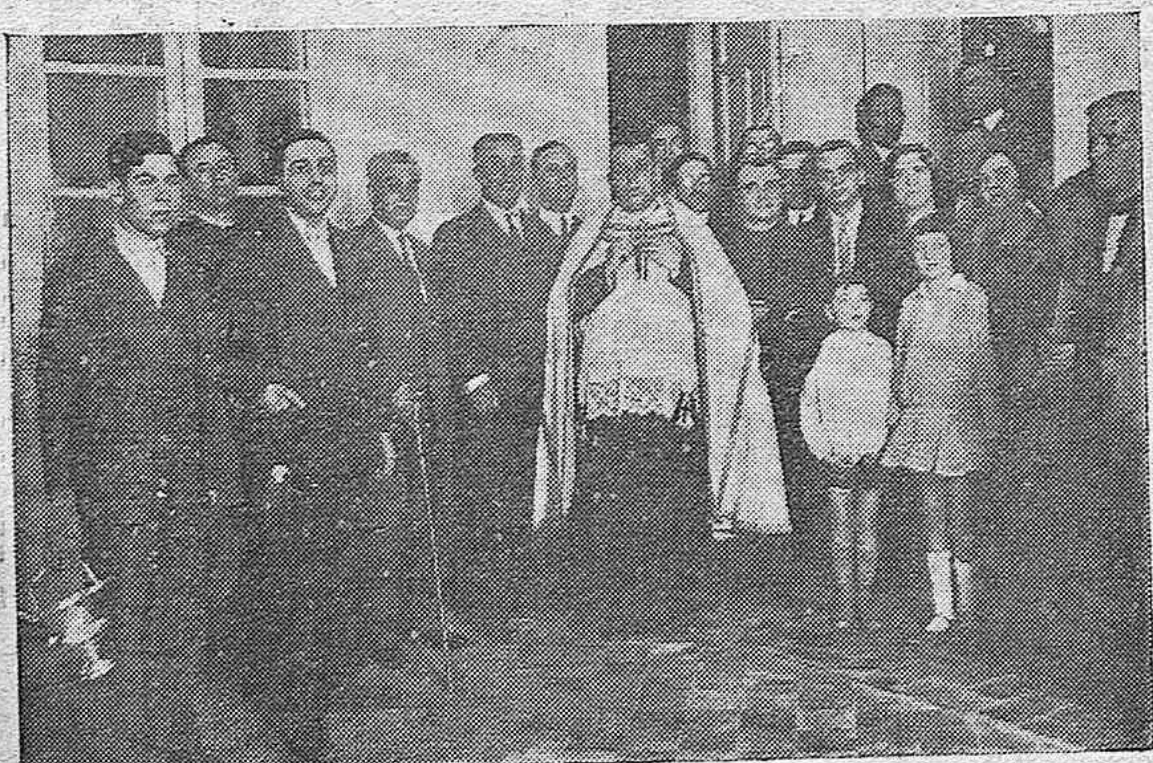
EN EL REALEJO —ACTO DE LA BENDICIÓN E INAUGURACIÓN DE LA NUEVA ESTAFETA DE CORREOS ASISTIENDO EL ADMINISTRADOR PRINCIPAL, JEFES Y OFICIALES DEL CUERPO Y PERSONAL DE LA NUEVA ESTAFETA.

LLEGO: el gran surtido en crespones de seda artificial y de seda natural, y telas preciosas para vestidos, en EL METRO y sus Sucursales