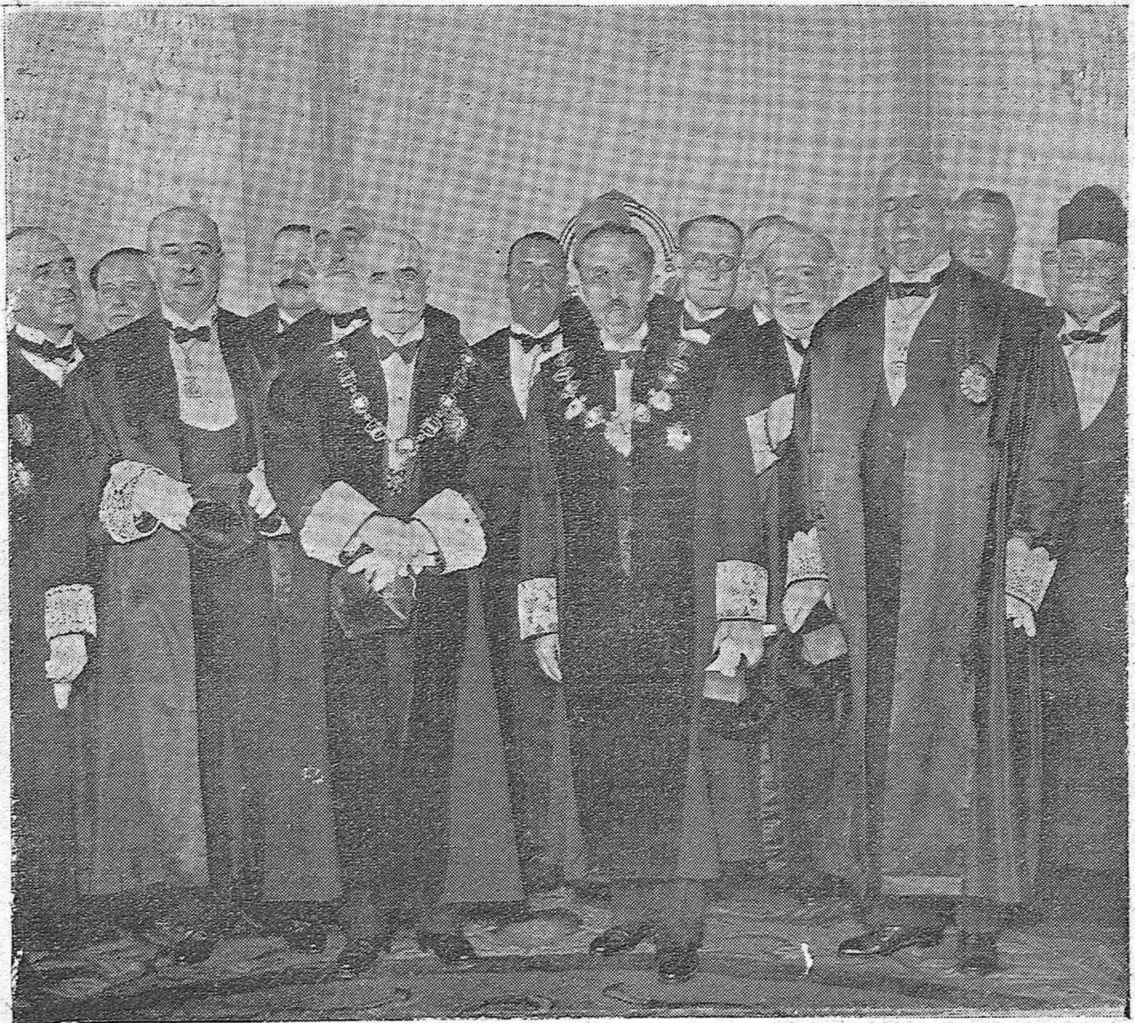
EL MINISTRO DE GRACIA Y JUSTICIA SR. ESTRADA, EN EL MOMENTO DE DAR POSESIÓN DE SU CARGO AL NUEVO PRESIDENTE DEL ALTO TRIBUNAL, SR. ORTEGA MOREJÓN