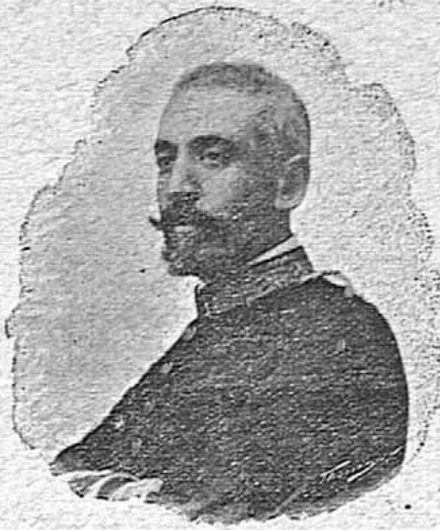
Héroe de Paso Real

El General Luque pertenece á la pléyade de brillantes oficiales que oxigenaron el ejército con nuevo espíritu el 68, después de batirse por la libertad en el Puente de Alcolea. Espíritu abierto á todas las ideas grandes, corazón noble y esforzado, clara inteligencia, fácil palabra y amor acendrado á la patria y al Ejército, son las mas sabientes cualidades del general Luque que acaba de cubrirse de gloria en Paso Real humillando el orgullo de Maceo y haciendo polvo en las calles del pueblo, en lucha desigual á esas hordas de salvajes, valientes cuando en número abrumador caen sobre un destacamento de 17 ó 18 hombres ó cuando después de descarrilar un tren machatean su escolta ó cuando entran como Pedro por su casa, en un poblado desguarnecido y cometen los mas repugnantes crímenes.