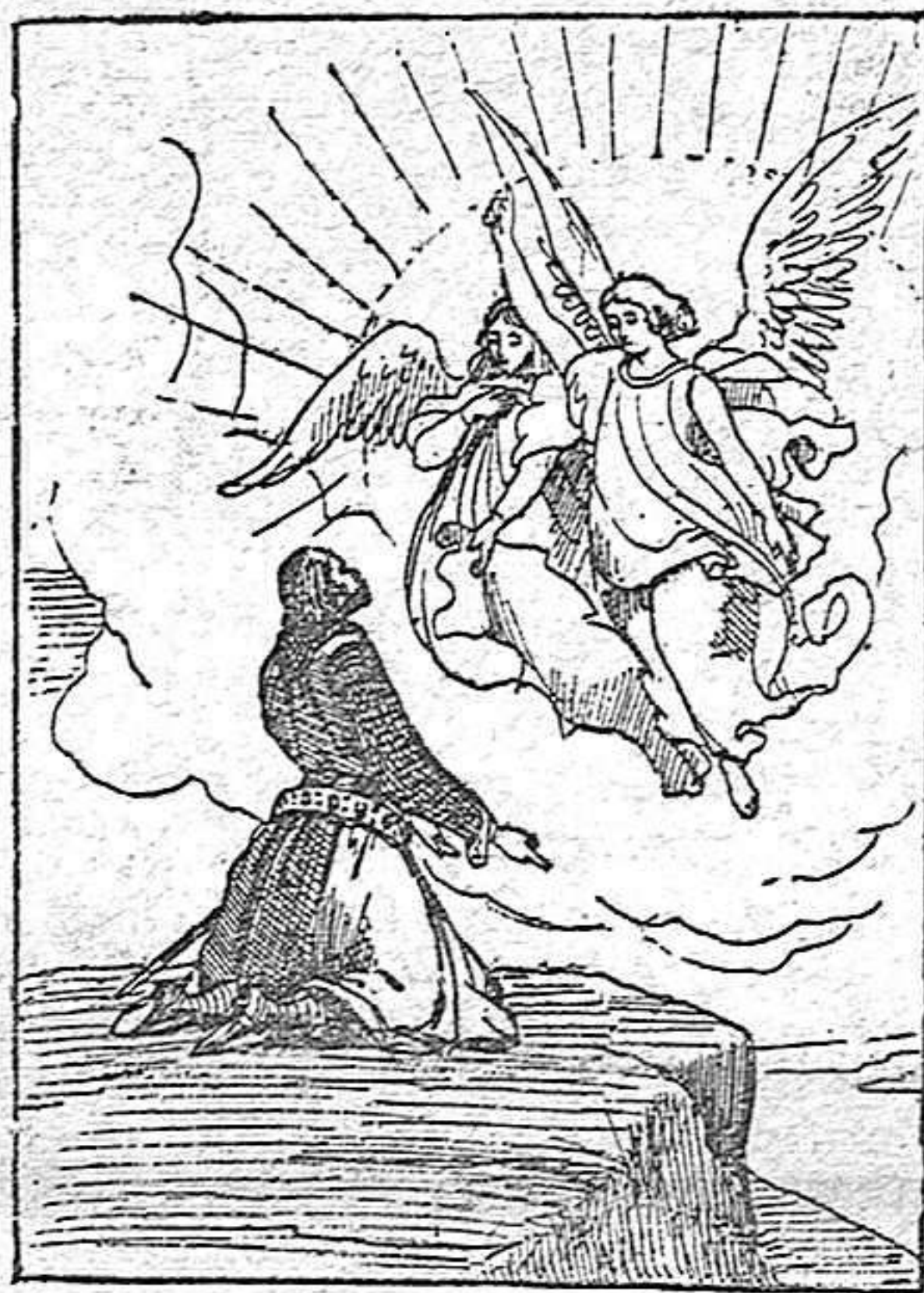
9 de Febrero de 1815

Nace el pintor español Federico de Madrazo