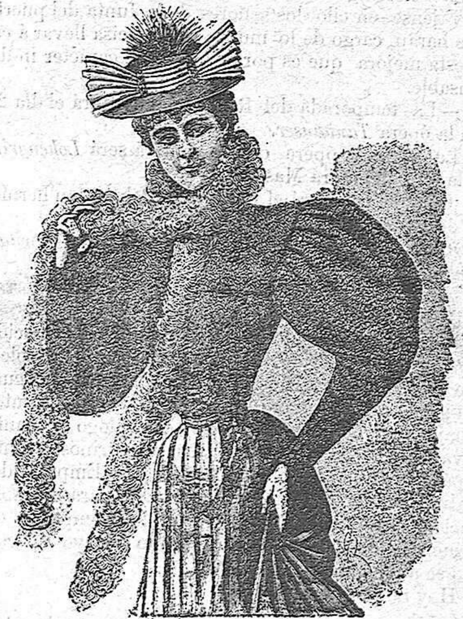
Chaqueta Figaro de tisú con adornos de astrakan y forros variables: Esta hermosa chaqueta constituirá una de las novedades del próximo invierno.