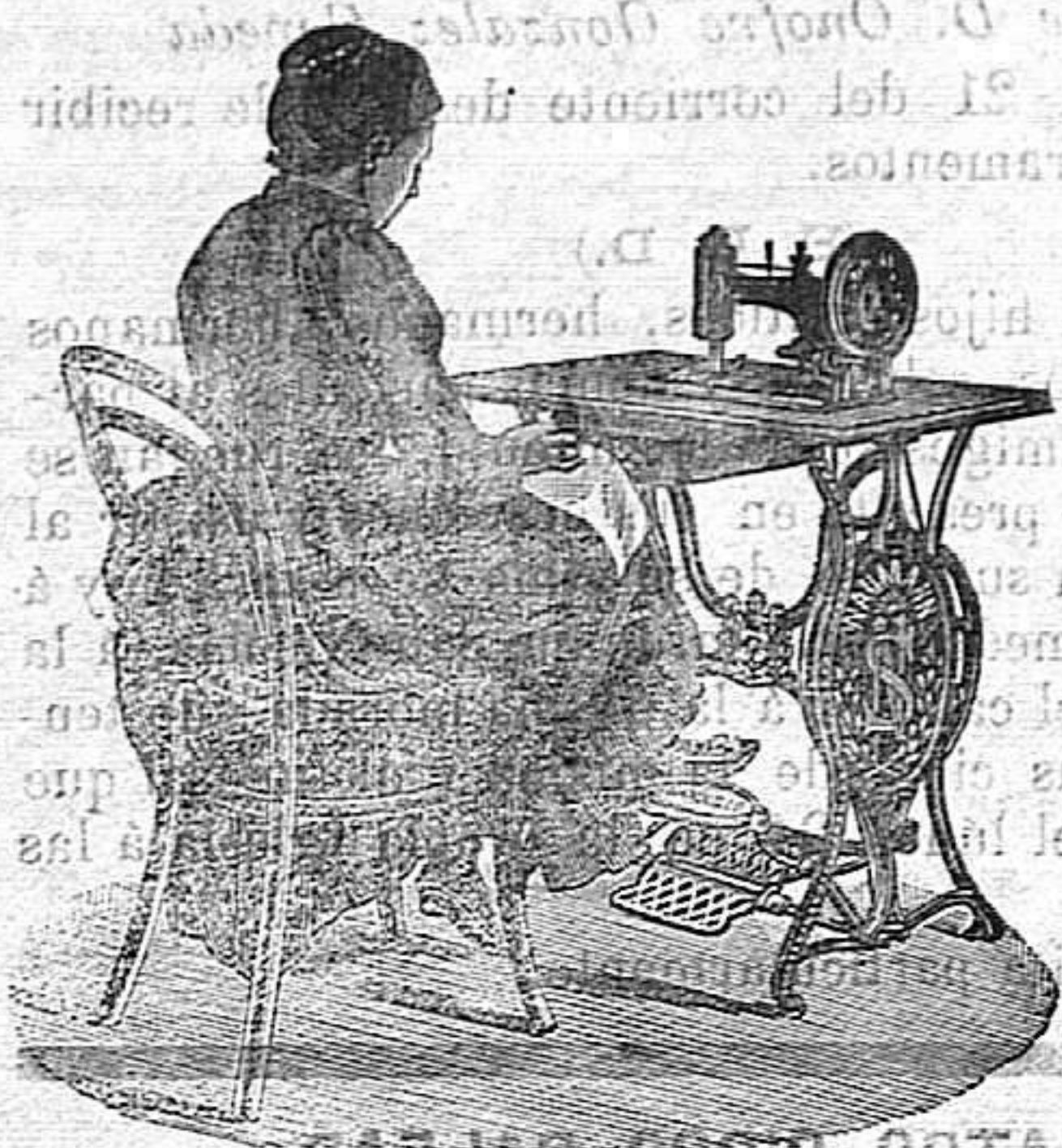
Nuevo, Práctico Higiénico