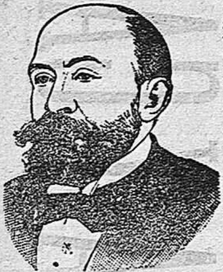
Antonio de Linares

fórmulas medicamentosas, y si ellos insisten universalmente, como es fácil convencerse de ello, en la importancia de que se compre la verdadera Emulsión Scott, no deje nunca de seguirse su consejo y adquiera la legítima, la cual se distinguirá por nuestra marca de fábrica: un hombre cargando un