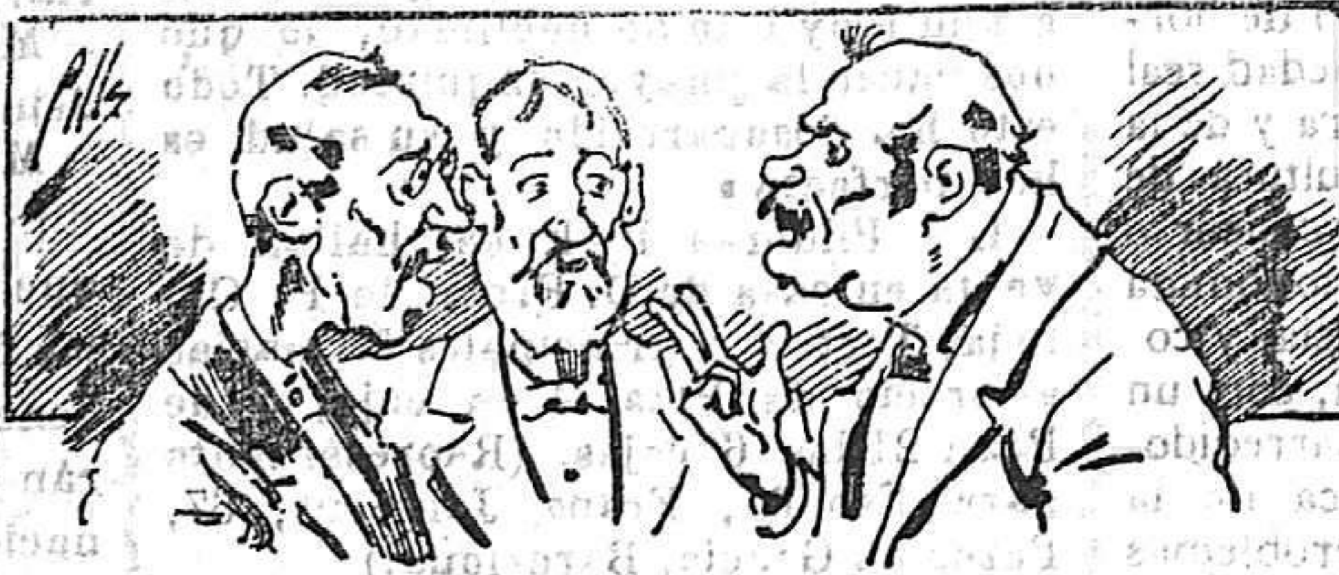
Abominan á nuestros libros..., pero los compran.

fórmulas para toda clase de industria, y cuantas noticias y conocimientos puedan ser beneficiosos. Cuenta además con buenos grabados, parte literaria excelente; da regalos mensuales á sus lectores con la Lotería Nacional y participaciones en la misma, á cuyo efecto compra todos los sorteos, y en una de las Administraciones más afortunadas por la suerte, billetes enteros. La suscripción y los números que se nos pidan se sirven gratuitamente á correo vuelto y franqueados, con sólo indicar el nombre y dirección del que lo desea en sobre dirigido al Sr. Administrador de