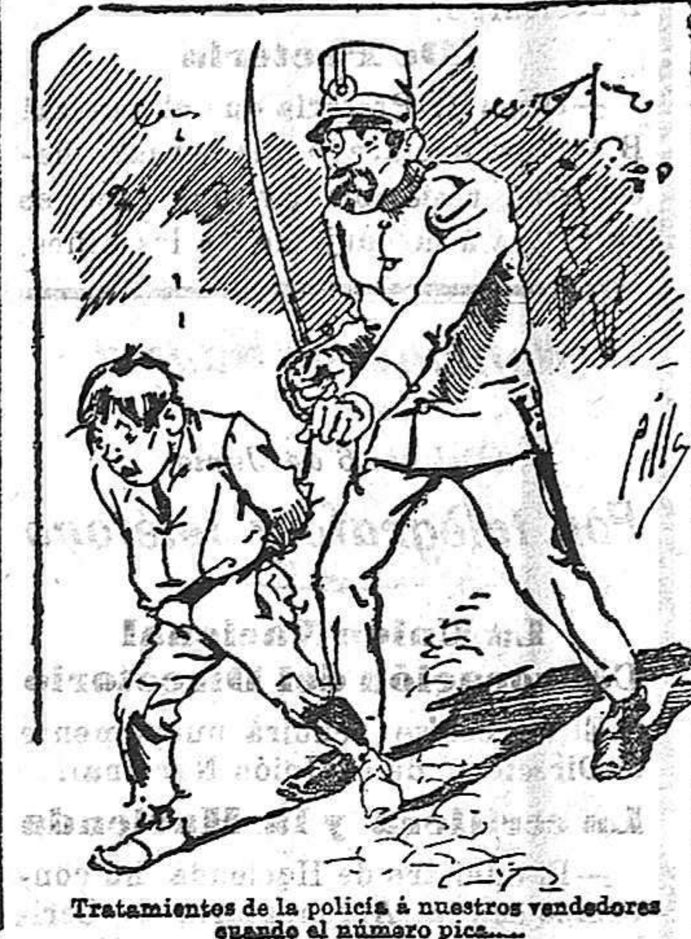
Tratamientos de la policía á nuestros vendedores cuando el número pica...

También puede pedirse LA AVISPA y el CATALOGO RESERVADO en casa de nuestros corresponsales autorizados, si no se quiere escribir á la Administración.