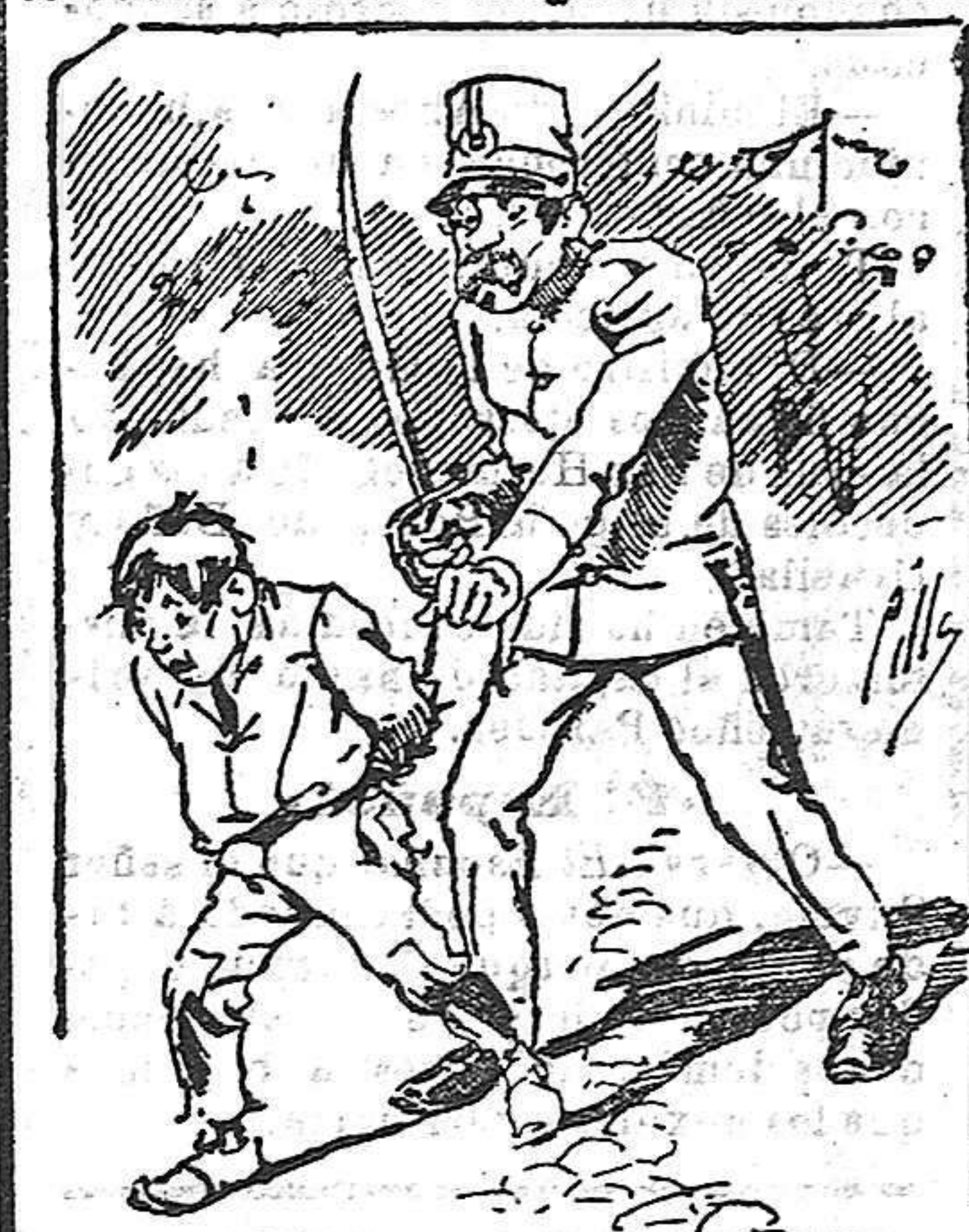
Tratamientos de la policía á nuestros vendedores cuando el número pide...