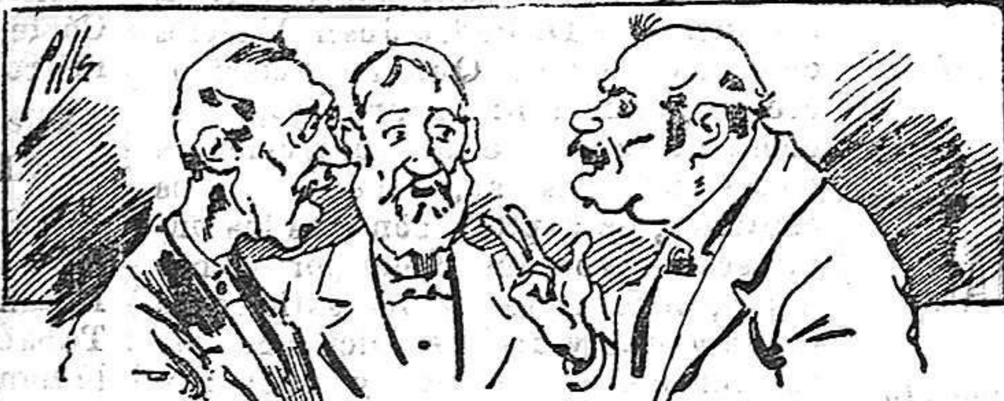
Abominan á nuestros libros..... pero los compran.

fórmulas para toda clase de industria, y cuantas noticias y conocimientos puedan ser beneficiosos. Cuenta además con buenos grabados, parte literaria excelente; da regalos mensuales á sus lectores con la Lotería Nacional y participaciones en la misma, á cuyo efecto compra todos los sorteos, y en una de las Administraciones más afortunadas por la suerte, billetes enteros. La suscripción y los números que se nos pidan se sirven gratuitamente á correo vuelto y franqueados, con sólo indicar el nombre y dirección del que lo desea en sobre dirigido al Sr. Administrador de